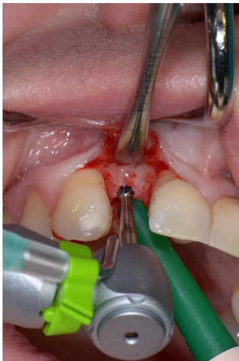
Slika 9. Početna preparacija ležišta implantata.

Nakon postave implantata, mukoperiostalni režanj vraća se u početni položaj i šiva bez tenzije kako bi se omogućilo što brže i lakše cijeljenje per primam . Što se tiče neuspjeha implantata, najznačajniji je biološki čimbenik koji uzrokuje rani (ili primarni) i kasni (ili sekundarni) neuspjeh. Razlozi ranih neuspjeha pripisuju se prevelikoj kirurškoj traumi, usporenom zacjeljivanju, bakterijskoj kontaminaciji i preranom preopterećenju. Kasni neuspjesi implantacije povezani su s periimplantitisom i okluzalnim preopterećenjem. Na taj se način rani neuspjeh implantacije može opisati kao neuspjeh u postizanju oseintegracije, dok kasni predstavlja neuspjeh u održavanju oseintegracije. Mehanički neuspjesi uključuju lom implantata i suprastruktura, dok jatrogeni neuspjesi podrazumijevaju krivi položaj, odnosno angulaciju implantata pri čemu se narušava anatomija okolnih struktura. Implantiranje u mandibularni kanal ili maksilarni sinus predstavljaju jatrogeni neuspjeh (39, 41).