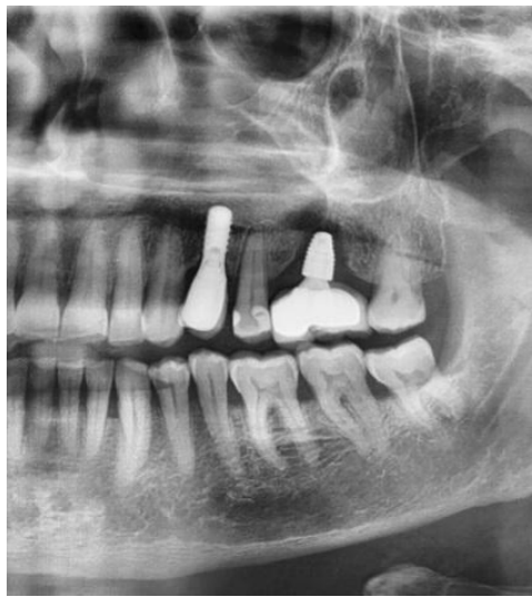
Slika 10. RTG prikaz implantata s koštanim gubitkom u obliku kratera u području 26.

Ukoliko je PPD > 5 mm potrebno je napraviti RTG sliku. Ako je BOP pozitivan i nema kratera (koštani gubitak oko implantata), provodi se postupak pod točkom A. Ako je BOP pozitivan i krater < 2 mm provodi se postupak pod točkom C ili D, a ako je BOP pozitivan i krater > 2 mm provodi se postupak pod točkom D (52).