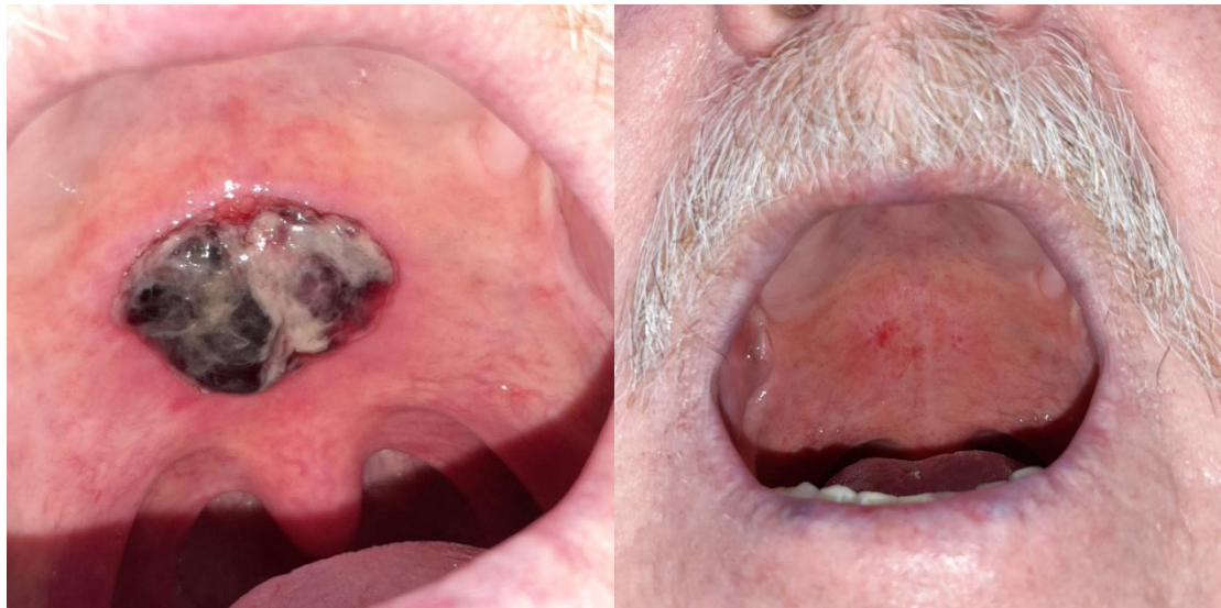
Slika 3. Liver clot kao posljedica otežanog cijeljenja i zgrušavanja krvi na tvrdom nepcu u pacijenta na terapiji varfarinom - prikaz stanja na prvom pregledu i potpuno cijeljenje nakon 14 dana.

Kongenitalna stanja u kojima se javlja povećana sklonost krvarenju su: