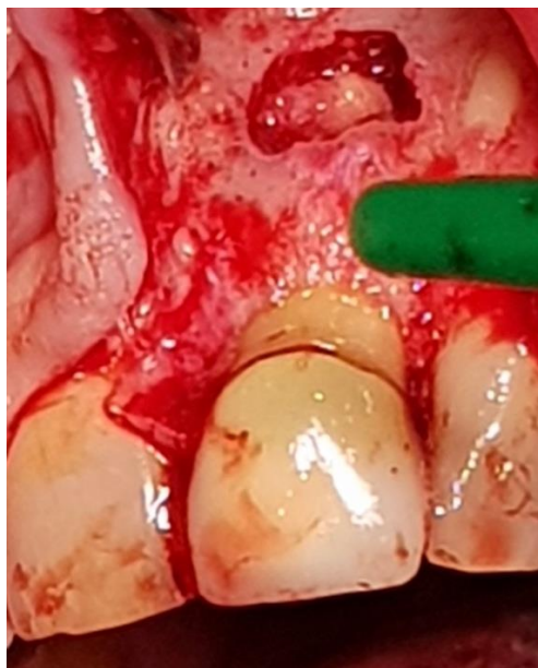
Slika 4. Prikazan apeks korijena zuba