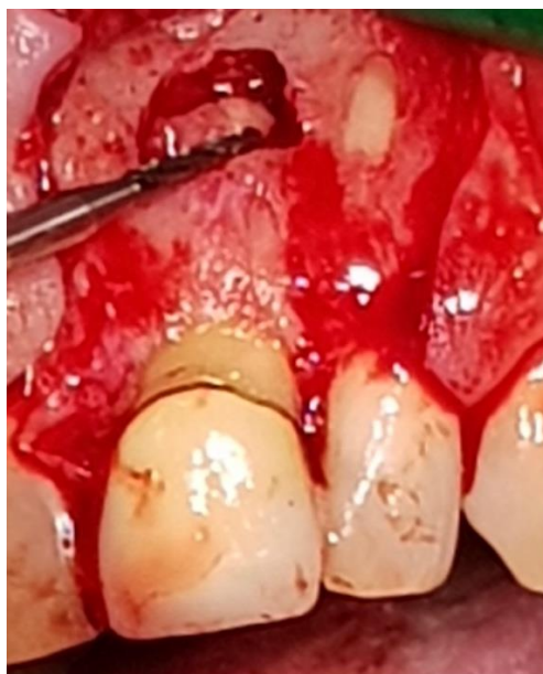
Slika 5. Resekcija vrška korijena fisurnim svrdlom