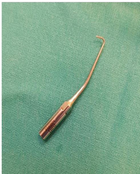
Slika 8. Piezoelektrični nastavak za preparaciju retrogradnog kaviteta