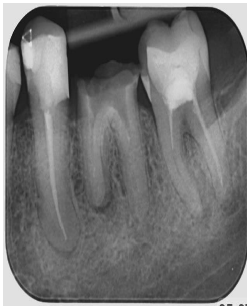
Slika 18. Kontrolna rendgenska snimka zuba 35 nakon 10 mjeseci