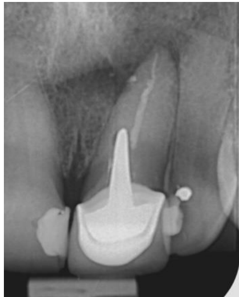
Slika 1. Početni radiološki nalaz zuba 21

Dinamika cijeljenja periapikalne lezije radiološki se kontrolirala snimkama nakon 5 mjeseci (slika 14) te nakon 9 mjeseci (slika 15). Kontrolne radiološke snimke su snimane iz različitog kutova snimanja, iz kojeg se bolje vidjela periapikalna translucencija. Vidljivo je značajno cijeljenje lezije u razdoblju nakon 4 mjeseca.