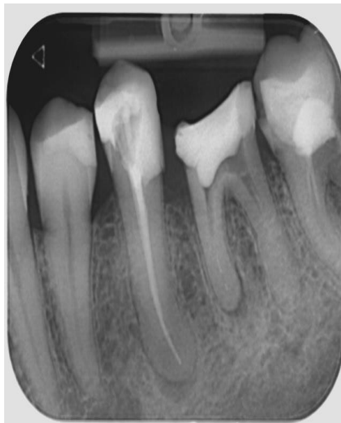
Slika 17. Rendgenska snimka zuba 35 nakon punjenja kanala