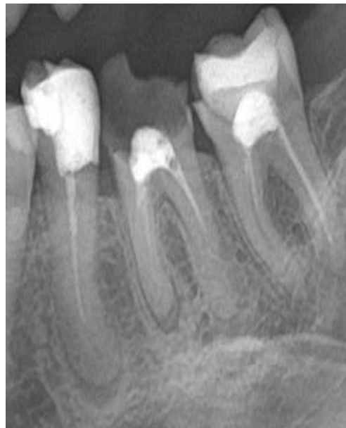
Slika 16. Isječak iz ortopantomograma snimljenog prije postupka Vidljivo kratko punjenje zuba 35 i periapikalna lezija

Napravljena je retroalveolarna rendgenska snimka neposredno nakon punjenja (slika 17) te kontrolna snimka nakon 10 mjeseci gdje je vidljivo značajno cijeljenje periapikalne lezije (slika 18).