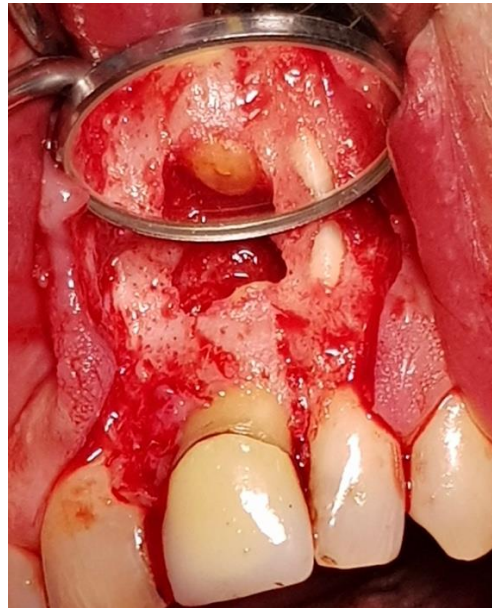
Slika 10. Retrogradni kavitet