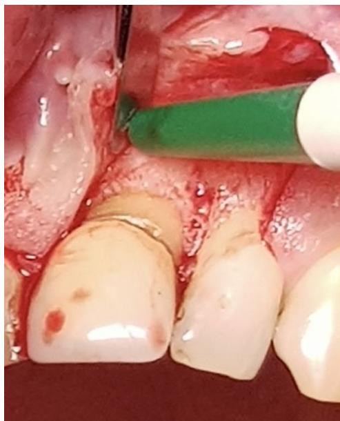
Slika 2. Trokutasti rez i odizanje režnja