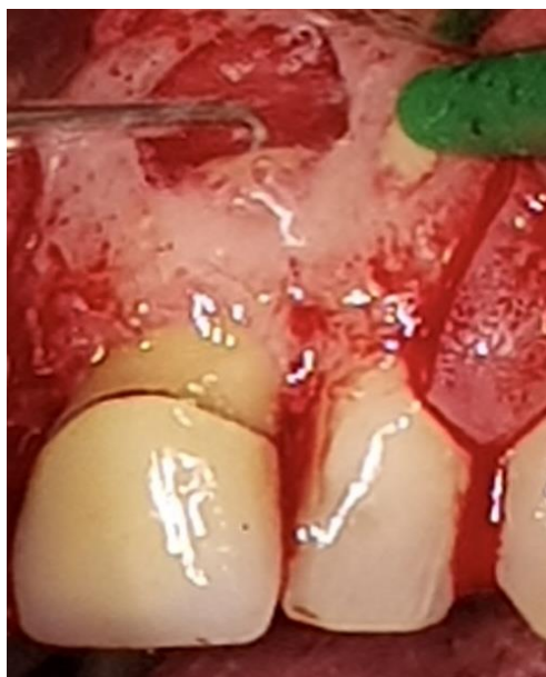
Slika 9. Preparacija retrogradnog kaviteta