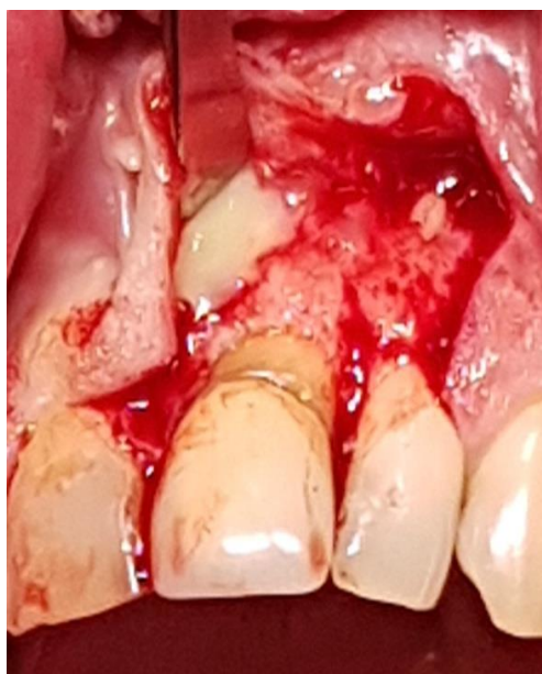
Slika 3. Purulentni sadržaj nakon trepanacije otvora na koštanoj stijenci