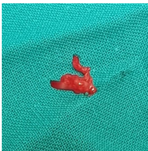
Slika 7. Uzorak tvorbe za patohistološku analizu