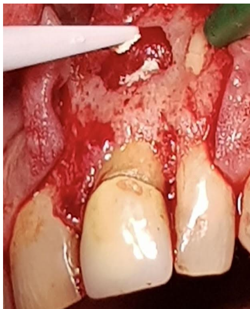
Slika 12. Aplikacija materijala za retrogradno punjenje