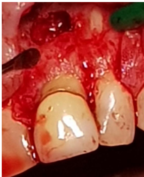
Slika 6. Odstranjenje periapikalne patološke tvorbe (flap-kiretaža)