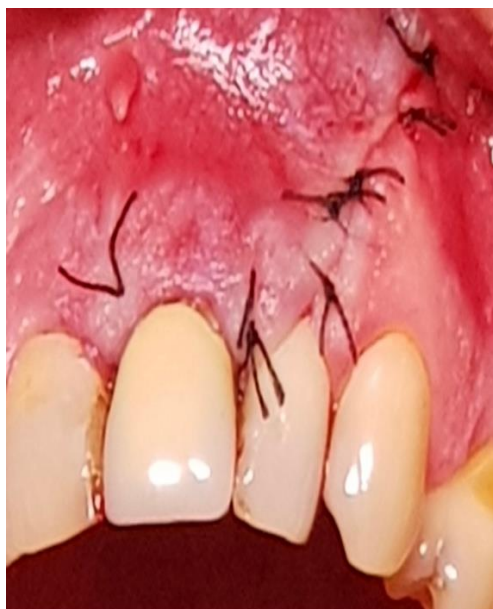
Slika 13. Stanje nakon šivanja