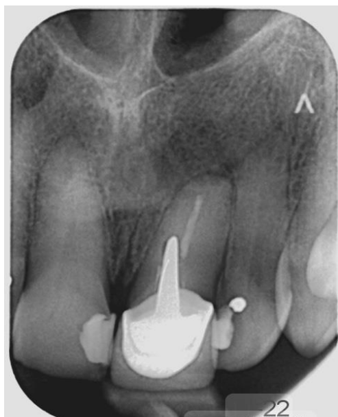
Slika 15. Kontrolna rendgenska snimka nakon 9 mjeseci