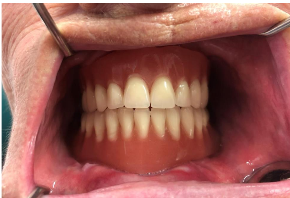
Slika 2. Gornja i donja potpuna proteza.

Terapija je potpunim protezama retiniranim implantatima postala uobičajena zbog većeg terapijskog značaja od konvencionalnih potpunih proteza. Međutim, pacijenti si katkada ne mogu priuštiti implantoprotetsku terapiju pa je upotreba potpunih proteza još uvijek zlatni standard u terapiji potpune bezubosti. Potpuna proteza je mobilni protetski nadomjestak koji nadomješta zube i dijelove resorbiranog alveolarnog grebena i rehabilitira izgubljene funkcije stomatognatnoga sustava (18). Treba biti biokompatibilna i estetski zadovoljavajuća, točno prilijegati na sluznicu rezidualnog grebena i biti usklađena s okolnim žvačnim i mimičnim mišićima kako bi imala dobru retenciju i stabilizaciju i odgovarajući prijenos žvačnog tlaka. Za izradu se proteza najčešće koriste akrilni plastični materijali. Svaka bi potpuna proteza pacijentu trebala omogućiti dostatnu prehranu i pravilan govor, zadovoljiti estetiku i funkciju, očuvati meka tkiva, maksimalno usporiti resorpciju alveolarnog grebena i omogućiti normalnu funkciju svih dijelova stomatognatnog sustava (Slika 2.) (19).