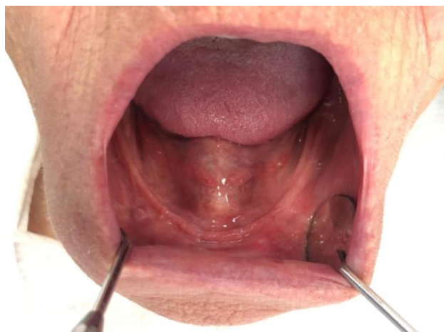
Slika 3. Ekstremno resorbirani alveolarni greben u donjoj čeljusti.