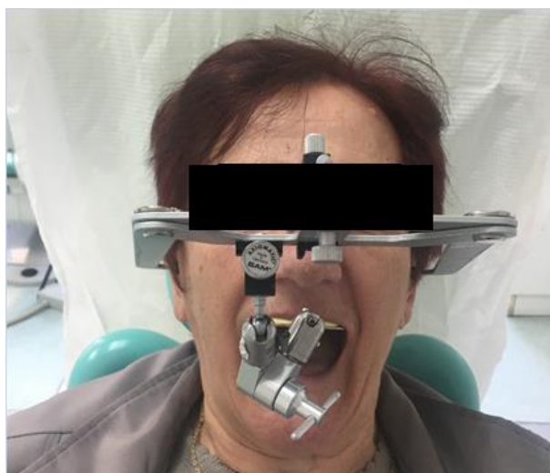
Slika 6. Upotreba obraznog luka.

Pri fiziološkom mirovanju kod žena 1 – 2 mm gornje zagrizne šablone treba biti vidljivo ispod ruba gornje usne, dok se kod muškaraca gornja zagrizna šablona nalazi u razini gornje usne (26). Visina donje šablone treba biti u visini ekvatora jezika, kuta usana i prijelaza sluznice na vermilion donje usne. Gornja i donja šablona trebaju biti paralelne pri dodiru. Pacijentu se kaže da izgovara brojeve od jedan do deset te se u slučaju nedovoljnog slobodnog interokluzijskog prostora korigira donji voštani bedem. Označava se središnja linija lica i linija osmijeha koju čini donji rub gornje usne pri neforsiranom osmijehu. Zatim se obraznim lukom za brzu montažu (Slika 6.) registrira odnos buduće protetske plohe na gornjoj zagriznoj šabloni prema centru rotacije kondila što omogućuje prijenos gornjeg modela u artikulator (Slika 7.). Obrazni luk određuje položaj gornje čeljusti prema transverzalnoj šarnirskoj osi i referentnoj razini glave (20, 25).