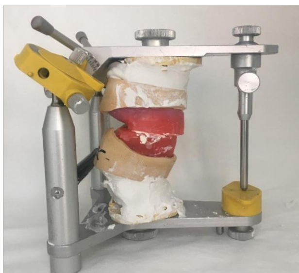
Slika 8. Prijenos zagriznih šablona u artikulator srednjih vrijednosti.

Zatim se zagrizne šablone spajaju pastom na bazi cink-oksida eugenola, a donji se model prenosi u donji dio artikulatora (22). Prije spajanja, zagrizne šablone se pripremaju. Na gornjoj i donjoj šablona se naprave urezi u obliku slova V u području premolara i molara te se između njih makne vosak debljine 2 mm. Fiksacijska se pasta cink-oksida eugenola nanosi na područje premolara i molara donje baze u debljini 6 – 8 mm jer je svaki V izrez dubok 2 mm, a slobodni interokluzijski prostor 2 – 4 mm. Pacijent se vodi u položaj centrične relacije, a šablone se u tom položaju prenose u artikulator prilagođen na srednje vrijednosti (incizalni kolčić 0, kut nagiba kondilne staze 25°, Bennetov kut 15°) (slika 8.) (20, 27).