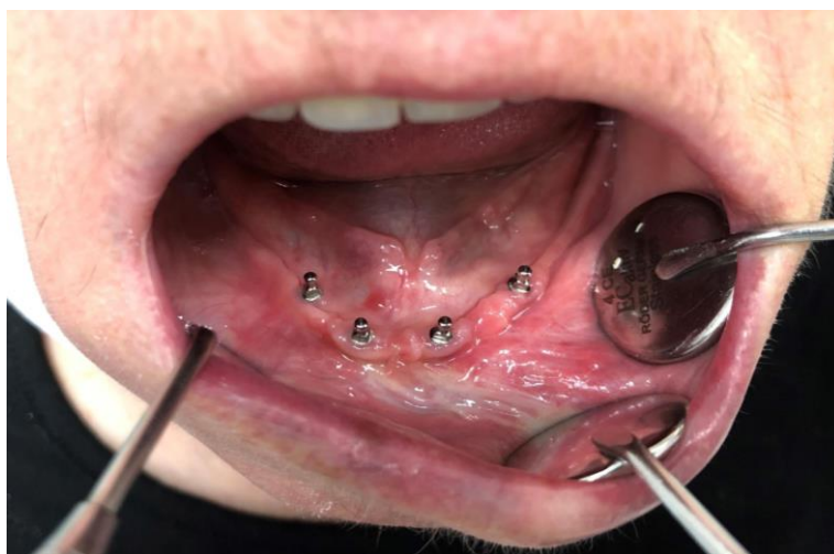
Slika 10. Pacijent s ugrađena četiri MDI.

MDI imaju manji promjer ( <3 mm) u odnosu na konvencionalne implantate ( >3 mm) koji omogućuje njihovo postavljanje u područja uskih grebena, a njihova upotreba za retenciju pokrovnih proteza ne zahtijeva opsežne kirurške metode (20). Osim toga, jednostavniji su za ugradnju, smanjuju rizik od postoperativnih komplikacija, u slučaju neuspjeha lakše uklanjaju (30). Četiri MDI s minimalnom dužinom 10 mm, postavljena u interforaminalnoj regiji preporučena su terapija za rehabilitaciju uskoga mandibularnog grebena u bezubih pacijenata, prema ITI Konsenzusu iz 2014. godine (22) (Slika 10. i 11.).