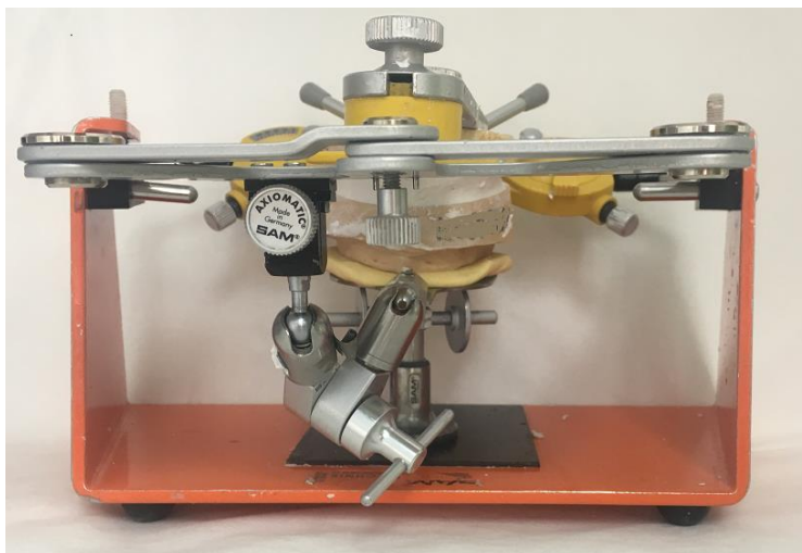
Slika 7. Prijenos gornjeg modela u artikulator.

Zatim se zagrizne šablone spajaju pastom na bazi cink-oksida eugenola, a donji se model prenosi u donji dio artikulatora (22). Prije spajanja, zagrizne šablone se pripremaju. Na gornjoj i donjoj šablona se naprave urezi u obliku slova V u području premolara i molara te se između njih makne vosak debljine 2 mm. Fiksacijska se pasta cink-oksida eugenola nanosi na područje premolara i molara donje baze u debljini 6 – 8 mm jer je svaki V izrez dubok 2 mm, a slobodni interokluzijski prostor 2 – 4 mm. Pacijent se vodi u položaj centrične relacije, a šablone se u tom položaju prenose u artikulator prilagođen na srednje vrijednosti (incizalni kolčić 0, kut nagiba kondilne staze 25°, Bennetov kut 15°) (slika 8.) (20, 27).