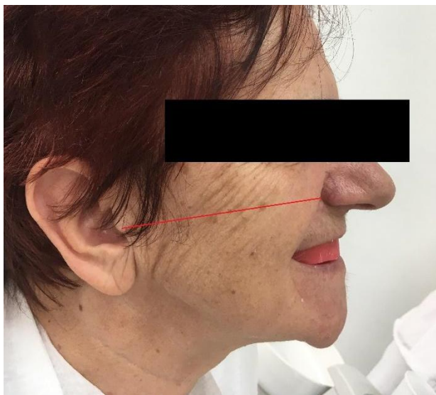
Slika 5. Camperova ravnina.

Pri fiziološkom mirovanju kod žena 1 – 2 mm gornje zagrizne šablone treba biti vidljivo ispod ruba gornje usne, dok se kod muškaraca gornja zagrizna šablona nalazi u razini gornje usne (26). Visina donje šablone treba biti u visini ekvatora jezika, kuta usana i prijelaza sluznice na vermilion donje usne. Gornja i donja šablona trebaju biti paralelne pri dodiru. Pacijentu se kaže da izgovara brojeve od jedan do deset te se u slučaju nedovoljnog slobodnog interokluzijskog prostora korigira donji voštani bedem. Označava se središnja linija lica i linija osmijeha koju čini donji rub gornje usne pri neforsiranom osmijehu. Zatim se obraznim lukom za brzu montažu (Slika 6.) registrira odnos buduće protetske plohe na gornjoj zagriznoj šabloni prema centru rotacije kondila što omogućuje prijenos gornjeg modela u artikulator (Slika 7.). Obrazni luk određuje položaj gornje čeljusti prema transverzalnoj šarnirskoj osi i referentnoj razini glave (20, 25).