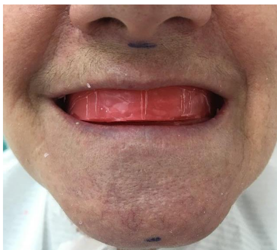
Slika 4. Referentne točke Sn i Gn za određivanje vertikalne dimenzije okluzije.

Niswongerova metoda određivanja VDO se veoma često koristi u kliničkoj praksi. VDO se određuje pomoću fiziološkog mirovanja koje se određuje mjerenjem udaljenosti između označenih točaka na gornjoj i donjoj čeljusti dok pacijent pri izgovoru sloga „mi“ polako zatvara usta do blagog dodira usana. Te točke su najčešće Sn ( subnasale – spojnica septuma nosa i filtra gornje usne) i Gn ( gnathion – najniža točka simfize brade) (Slika 4.). Kako bi se izmjerila VDO, oduzima se veličina slobodnog interokluzijskog prostora od vertikalne dimenzije fiziološkog mirovanja (25).