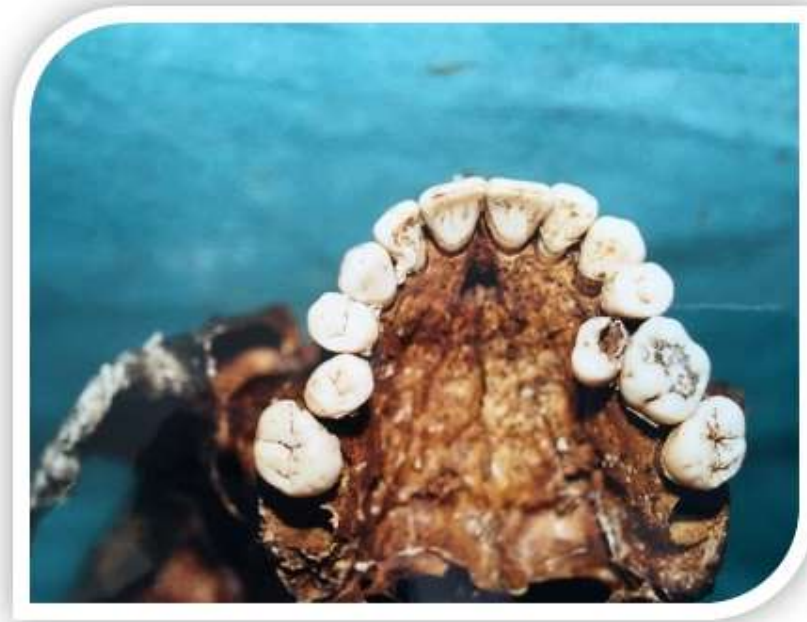
Slika 8. Ektopični lijevi i rotirani desni gornji drugi pretkutnjak

Arhiva Zavoda za dentalnu antropologiju Stomatološkog fakulteta Sveučilišta u Zagrebu