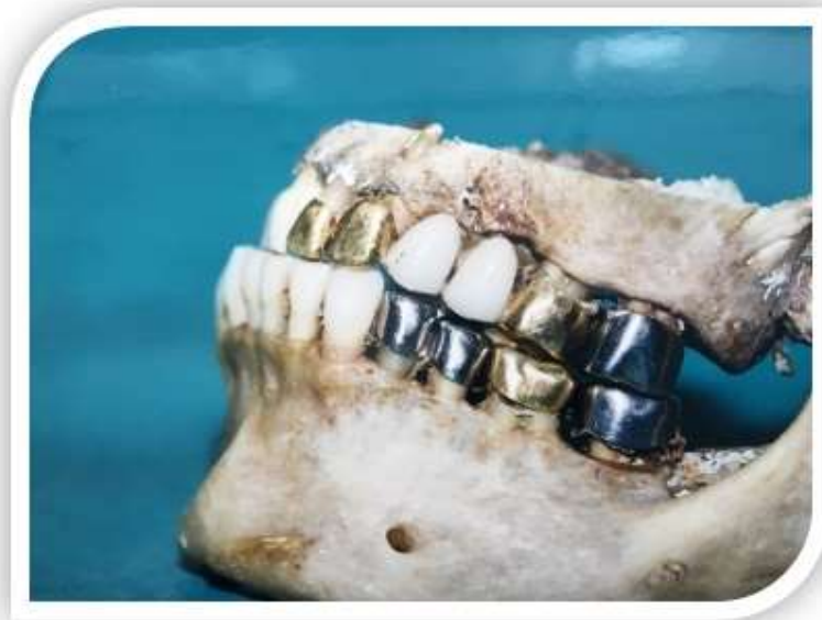
Slika 4. Malokluzija