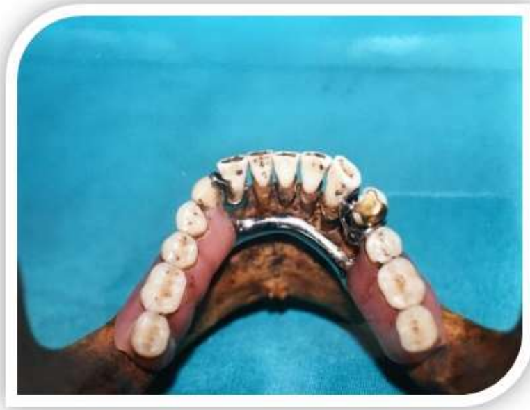
Slika 5. Kombinirani rad

Arhiva Zavoda za dentalnu antropologiju Stomatološkog fakulteta Sveučilišta u Zagrebu