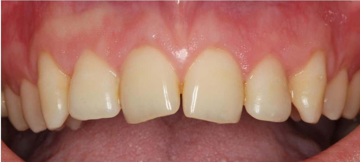
Slika 5. Stanje gingive jedan mjesec nakon apikalnog repositioniranja reznja