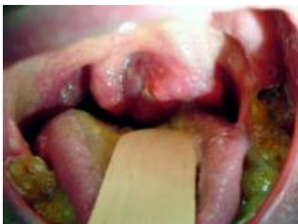
Slika 8. HPV-om uzrokovani karcinom grla. Preuzeto iz (5).