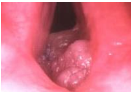
Slika 7. Laringealna papilomatoza. Preuzeto iz (5).