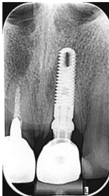
Slika 4. Kontrolna rendgenska snimka nakon zahvata s uredno postavljenim implantatom.