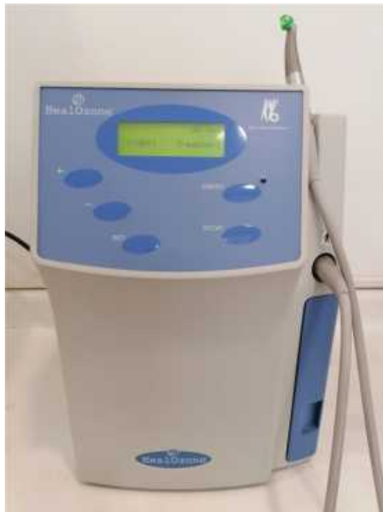
Slika 1. Generator ozona HealOzone (KaVo Dental GmbH, Germany).