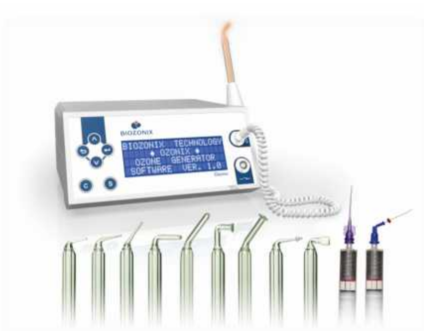
Slika 2. Generator ozona Ozonix (Biozonix, München, Deutschland).