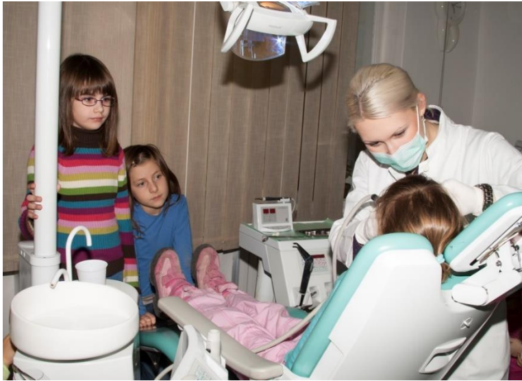
Slika 4. Primjer oblikovanja ponašanja djeteta prisustvovanjem zahvatu drugog kooperativnog djeteta