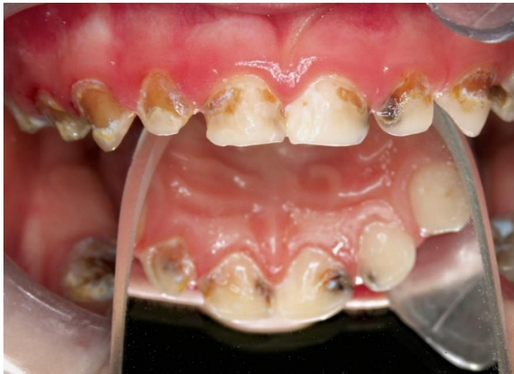
Slika 1. Utjecaj DSA-a na oralno zdravlje; nalaz koji se često uočava kliničkim pregledom djeteta s DSA-om, ECC, engl. early childhood caries (stadij 3+), ljubaznošću izv. prof. dr. sc. Waltera Dukića

Komunikacija između triju komponenti tog trokuta (međusobna ovisnost svake komponente o stavu preostalih dviju) ključan je čimbenik u stvaranju uvjeta odgovarajućih za obavljanje dentalnog tretmana (16). Ako se DSA ne regulira pravilno, povećava se rizik od ulaska pacijenta u tzv. začarani krug DSA-a. To se može objasniti na sljedećem primjeru: svakim izbjegavanjem zahvata zbog straha pogoršava se oralno zdravlje pacijenta, što indicira izvođenje invazivnijih zahvata koji pak opet utječu na povećanje straha od istih (17, 18, 19).