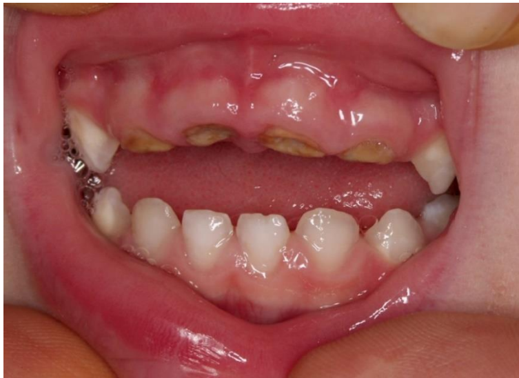
Slika 2. Primjer tzv. začaranog kruga; odgađanje posjeta dovodi do pogoršanja nalaza ECC-a (stadij 4)

Dakle, problemi s oblikovanjem ponašanja u dentalnoj ordinaciji ovise o sposobnosti doktora dentalne medicine da se nosi s njima, ali ne i isključivo o doktoru dentalne medicine već o suradnji između pacijenta, roditelja i doktora, što oblikovanje ponašanja čini još težim (14, 15, 20, 21). Zadatak doktora dentalne medicine je znati procijeniti je li iskazana reakcija strah od novog i nepoznatog (normalna emocionalna reakcija za djecu), radi li se o trenutnom anksioznom odgovoru na dentalni stimulus (DSA) ili je pak u pitanju psihijatrijski poremećaj, tj. generalizirana anksioznost (1). Kako bi se poboljšala dentalna njega nesuradljivih pacijenata, važno je odrediti sve odlike koje dijete izlažu riziku iskazivanja anksioznog ponašanja u dentalnoj ordinaciji (12).