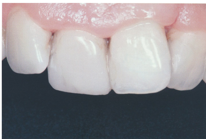
Slika 12. Nakon terapije. Preuzeto: (27)