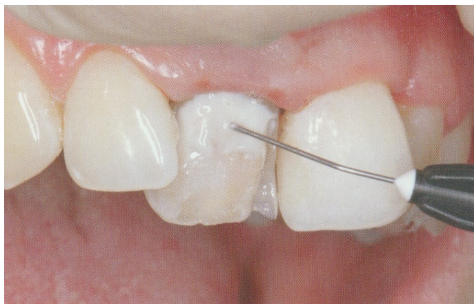
Slika 11. Nanošenje tekućeg kompozita. Preuzeto: (27).