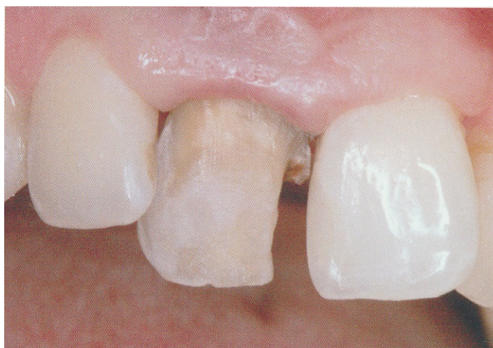
Slika 9. Izbrušeni zub 11. Preuzeto: (27).