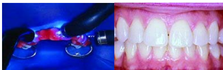
Slika 6. Grijanje i osvjtljavanje Slika 7. Nakon terapije

Slike 4-7. Postupak izbjeljivanja. Preuzeto: (23).