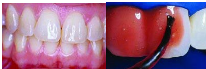
Slika 4. Situacija prije izbjeljivanja Slika 5. Nanošenje sredstva za izbjeljivanje

nakon izbjeljivanja skraćuju dugotrajnost postignutog rezultata. Stoga je za dugotrajnije održavanje postignutih rezultata potrebno, uz pravilnu oralnu higijenu, izbjegavati hranu i pića koji uzrokuju diskoloraciju zubi (2,24).