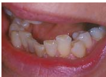
Slika 2. Zbijenost. Preuzeto: (3).