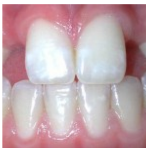
Slika 1. Hipodoncija.

Obuhvaćaju trajne morfološke i histološke poremećaje tvrdih zubnih tkiva. Sukladno pojavljivanju, ovi se poremećaji dijele na poremećaje u inicijalnom stadiju, poremećaje u vrijeme morfodiferencijacije tvrdih zubnih tkiva, poremećaje za vrijeme apozicije i mineralizacije tvrdih zubnih tkiva, te poremećaje za vrijeme nicanja zubi i poremećaje u boji zubi (2).