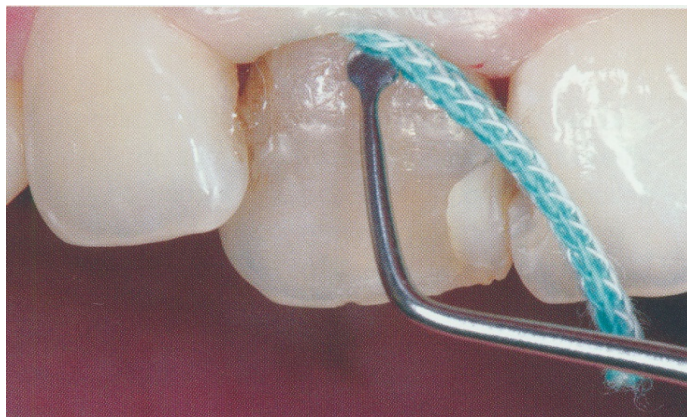
Slika 10. Postavljanje retrakcijskog končića. Preuzeto: (27).