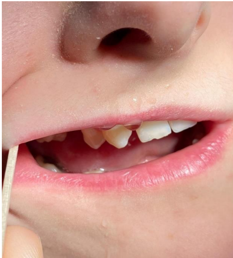
Slika 7. Klinički prikaz prolaska tekućine iz usne šupljine kroz nos nakon ispiranja fistule fiziološkom otopinom.