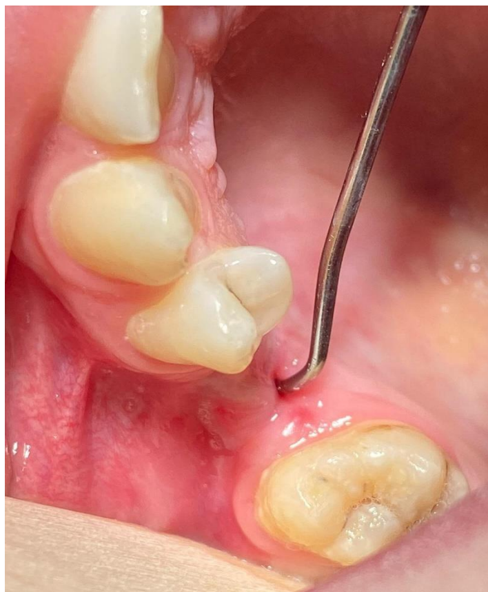
Slika 2. Klinički prikaz provjere oroantralne komunikacije korištenjem tupe sonde.

Jedan od načina provjere je i provjera tupom sondom. Kod prisutne komunikacije, kada sondom ulazimo u ekstrakcijsku ranu, ona propada u sinus. Ukoliko je sluznica dna alveole intaktna, sondiranjem se može probiti, a ukoliko je otvorena, sondiranjem se može unijeti infektivni materijal. Stoga se ova metoda treba koristiti kada se drugačije ne može postaviti dijagnoza, a postoji opravdana sumnja na postojanje komunikacije (7).