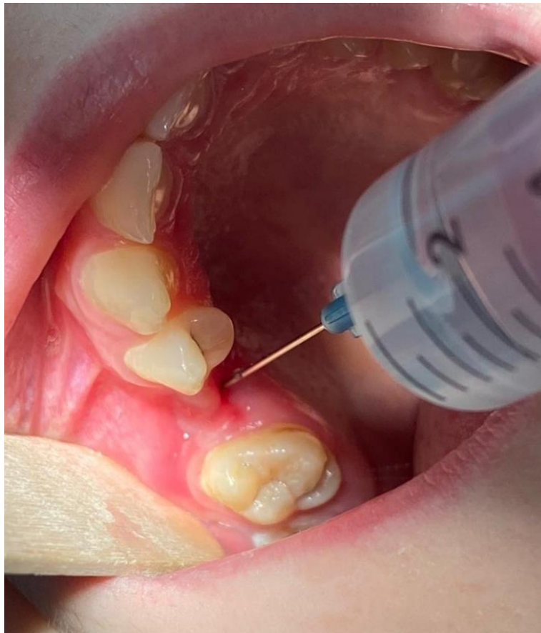
Slika 6. Ispiranje oroantralne fistule fiziološkom otopinom.