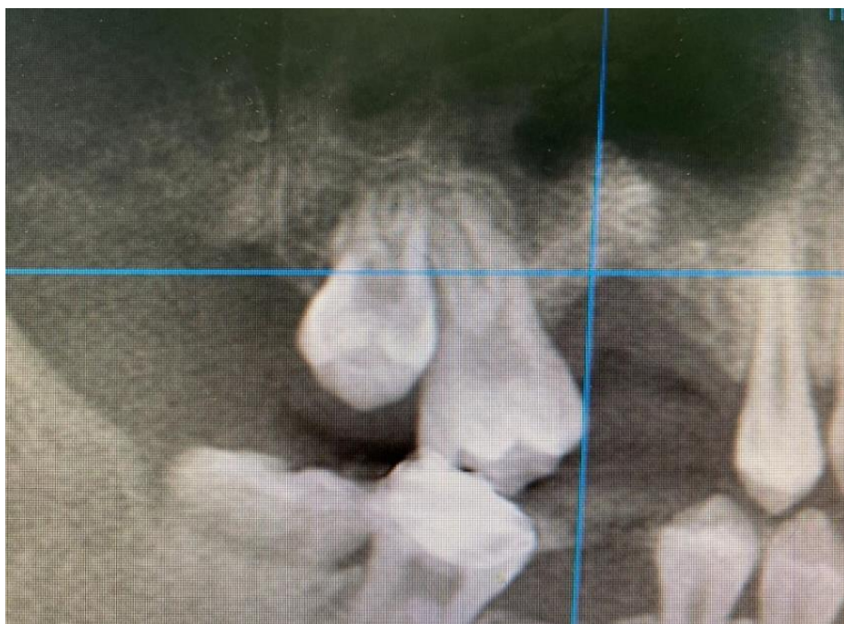
Slika 4. Isječak ortopantomograma na kojem je uočljiv diskontinuitet lamine dure.

Radiološki postupak uključuje snimanje ortopantomograma koji daje prikaz defekta kosti oko fistule i pokazuje prisutnost korijena zuba, implantata ili stranog tijela koje se utisnulo u sinus. Oroantralna komunikacija očituje se kao diskontinuitet radioopaktne linije koja predstavlja laminu duru. CT se može koristiti za trodimenzionalni prikaz fistule te za isključivanje prisutnosti maksilarnog sinusitisa (13).