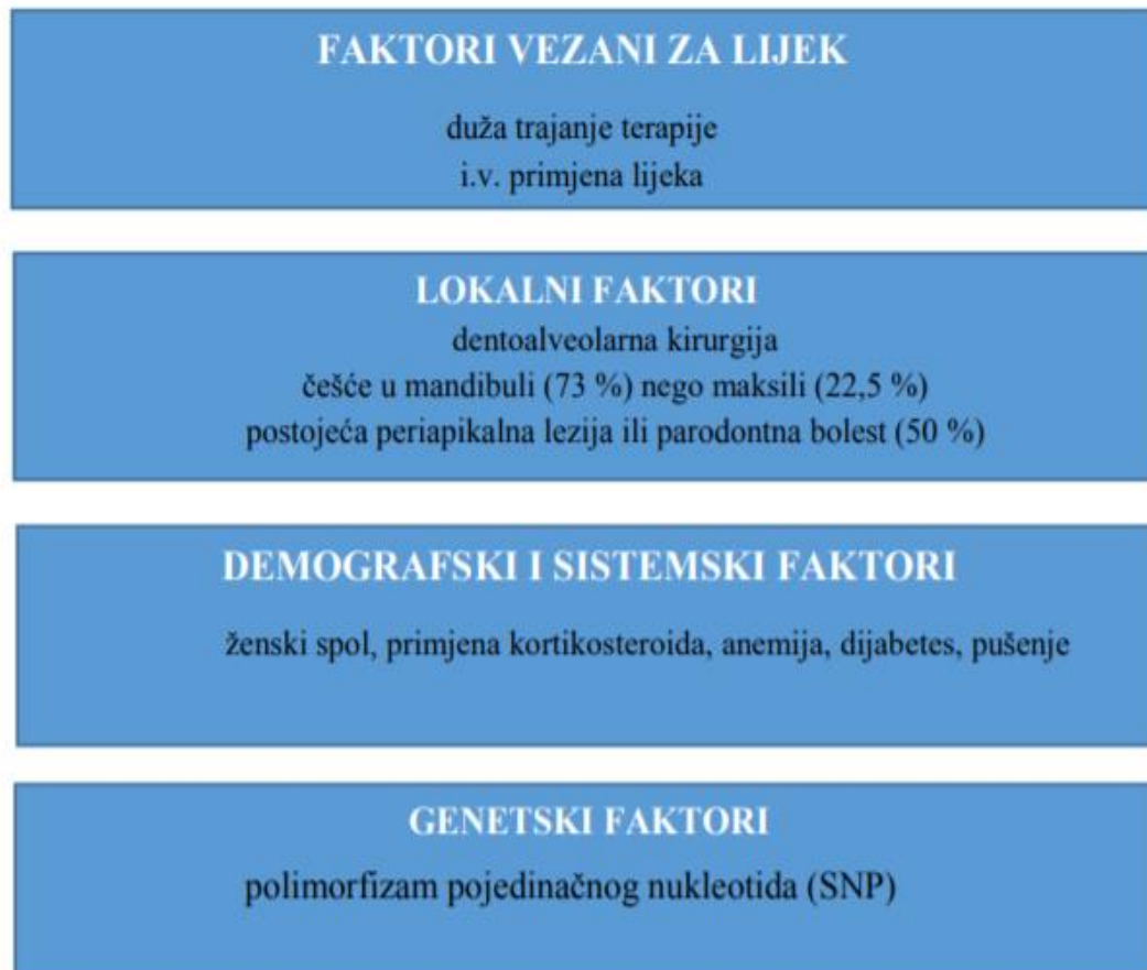
Slika 1. Rizični faktori za razvoj medikamentozne osteonekroze čeljusti. Preuzeto i prilagođeno: (22)

of the Jaw- BRONJ), a označava je koštana smrt koja nastaje kao posljedica poremećene krvne opskrbe koštanog tkiva (22). Uzrok ove pojave često je multifaktorski, a istraživanja navode inhibiciju angiogeneze, mikrotraume, manjak vitamina D, infekcije i upale, pad imuniteta te inhibiciju pregradnje kosti kao potencijalne uzroke (Slika 1).