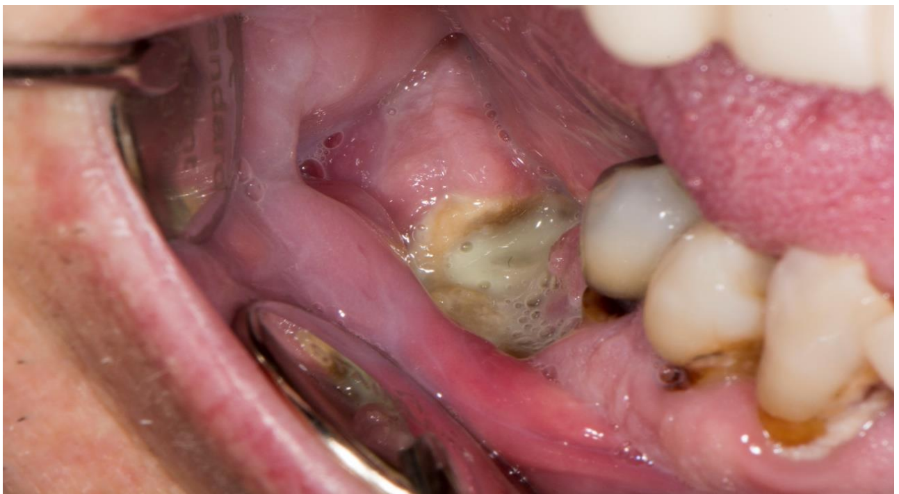
Slika 3. Klinička slika kod istoga pacijenta.