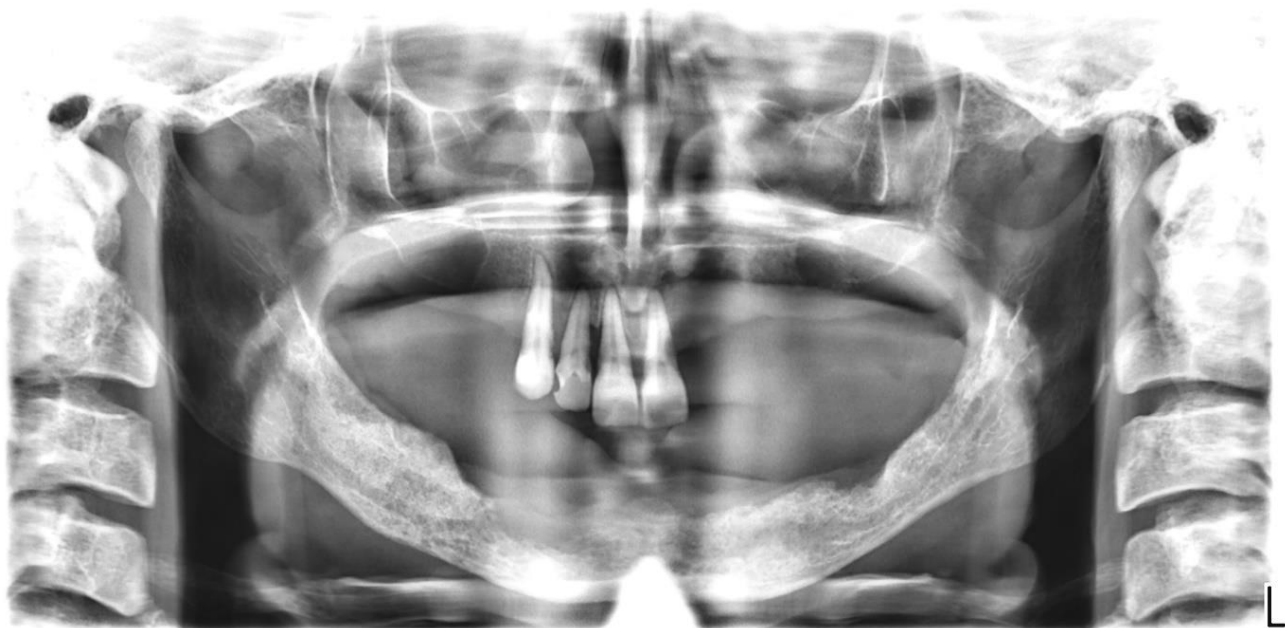
Slika 4. Osteonekroza mandibule kod pacijentice oboljele od karcinoma paratireoidne žlijezde i sekundarizma pluća.