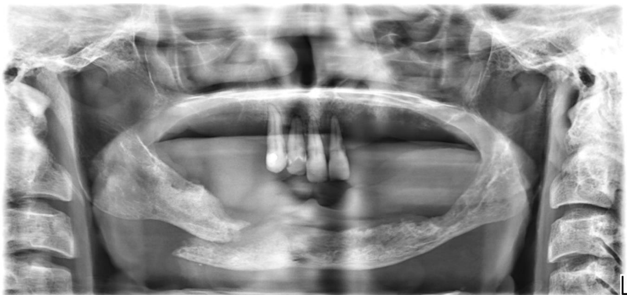
Slika 5. Fraktura desne strane tijela donje čeljusti.