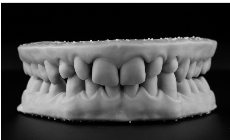
Slika 2. Digitalni 3D printani modeli gornje i donje čeljusti

ispisati u 3D pisačima ili izglođati iz diska ako stomatolog ili tehničar zatrebaju fizički model (Slika 2). Oni se izrađuju od polimera na bazi polimetilmetakrilata (PMMA). To se sve češće i radi jer je materijal jeftin, a preciznost i stabilnost modela je visoka (5) što omogućava korištenje modela kao anatomskih i radnih u analizama ili slojevanju ako se ne rade monolitni radovi.