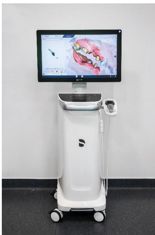
Slika 3. CEREC Primescan AC

TRIOS IOS System (3Shape, Copenhagen, Danska). On ima sposobnost hvatati 3000 dvodimenzionalnih slika u sekundi (11) i ne zahtijeva korištenje reflektirajućeg sredstva, titan-dioksidnog praha. Skener ima mogućnost oslanjanja na zube prilikom skeniranja kao oslonac tijekom skeniranja.