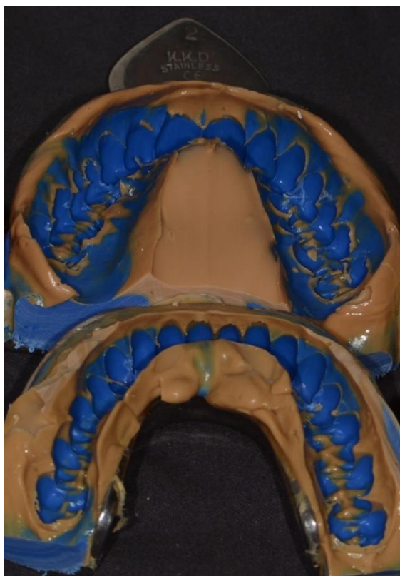
Slika 1. Situacijski otisak uzet u konfekcijskoj žlici

Paste za retrakciju gingive imaju istu ulogu kao i retrakcijski konci. Djeluju kemijsko-mehanički tako da blago horizontalno otvaraju sulkus i imaju mogućnost zaustavljanja malih krvarenja. Pogodni su za tanki biotip sluznice. Još jedna metoda može pomoći u prikazivanju cervikalne granice preparacije, ali samo uz pažljivu primjenu. To je kirurško otvaranje sulkusa elektrokirurški ili laserom na mjestima gdje tehnikom jednog konca ne možemo vidjeti rub stepenice. Pravilnom primjenom, posljedice u obliku upale i recesija su slabo vjerojatne.