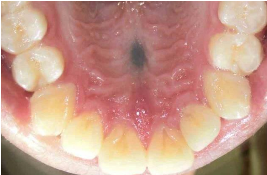
Slika 4. Intraoralni plavi madež na tvrdom nepcu.

Intraoralni plavi madež iznimno je rijetka pojava, a na oralnoj se sluznici manifestira između trećeg i petog desetljeća života. Veća je incidencija među ženskom populacijom. Dvije trećine svih intraoralnih plavih madeža nalazimo na tvrdom nepcu (Slika 4.). Druga najčešća lokalizacija je bukalna sluznica (21).