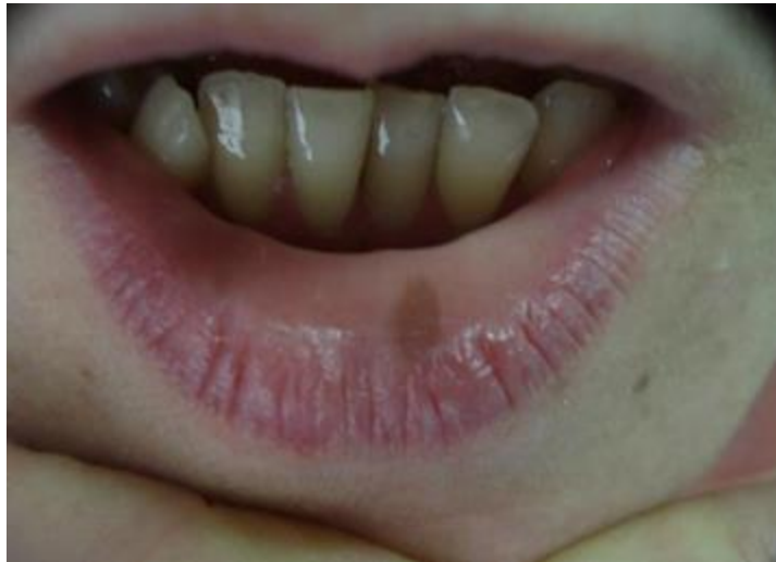
Slika 5. Melanotična makula usne.

Ako dermatoskopski nije moguće isključiti maligne promjene, posebno za lezije na nepcu, gdje je najveća prevalencija melanoma, potrebno je napraviti biopsiju. Nakon što je dijagnoza postavljena, daljnje liječenje nije potrebno (15).