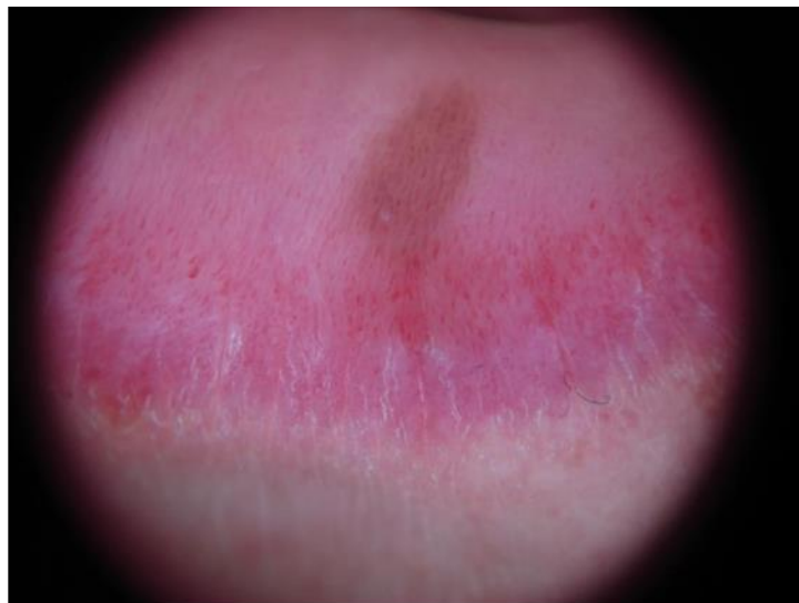
Slika 6. Melanotična makula usne – dermatoskopski prikaz paralelnog uzorka.