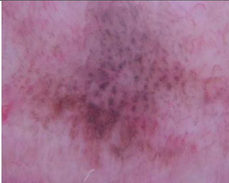
Slika 7. Melanotična makula usne – dermatoskopski prikaz globularnih struktura.