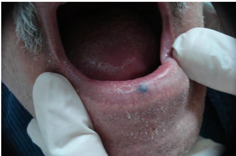
Slika 3. Hemangiom.

Izvođeci test vitropresije, očekujemo da će lezije poblijediti pod pritiskom tj. anemizirati (14, 15). Test se izvodi tako što se lezija nježno pritisne mikroskopskim stakalcem (15). Pozitivan rezultat (lezija blijedi na pritisak) ukazuje na to da se krv unutar vaskularnih prostora premjestila pod djelovanjem tlaka (15). Međutim, negativan test vitropresije ne isključuje da je riječ o vaskularnoj leziji jer se negativan rezultat može dobiti i uslijed nastanka ugrušaka u lumenu krvnih žila (14, 15).