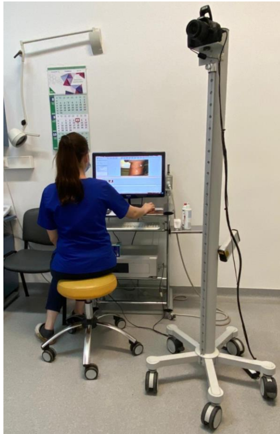
Slika 2. Sustav digitalne dermatoskopije.