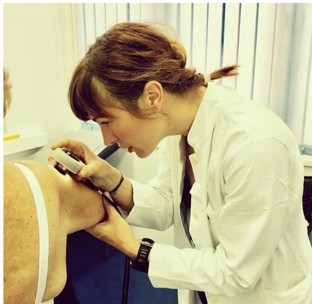
Slika 1. Primjena ručnog dermatoskopa.

Dermatoskopski pregled obavlja se dermatoskopom – neinvazivnim optičkim instrumentom koji se koristi u povećanju kožnih ili sluzničnih promjena (Slika 1.). Najčešće se upotrebljava ručni dermatoskop, a u novije vrijeme sve više i digitalni dermatoskopi te dermatoskopi integrirani uz fotoaparate. Svaki dermatoskop ima izvor svjetlosti i leću. Centralni dio čini leća koja kod ručnih dermatoskopa povećava sliku 10 – 20 puta, a kod digitalnih i do 70 puta. Izvori svjetlosti lampe postavljeni su oko leće, a danas se uglavnom ugrađuju LED lampe. Instrument se postavlja izravno na površinu kože iznad promjene, prosvjetljuje epidermis i papilarni dermis te prikazuje osnovne morfološke karakteristike određene promjene. Kada promatramo kožu golim okom, većina svjetla se reflektira o površinu kože što nas sprječava da vidimo promjene ispod rožnatog sloja (10).