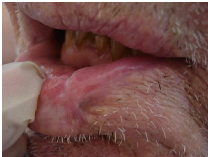
Slika 9. Klinički izgled recidiva melanoma usne.

Preuzeto s dopuštenjem autora: doc. dr. sc. Marija Buljan.