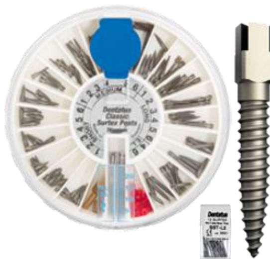
Slika 1. Osnovni tipovi intrakanalnih konfekcijskih kolčića.

Konfekcijske metalne nadogradnje mogu biti izrađene od zlata, titana, čelika i mjeda, dok individualne nadogradnje mogu biti načinjene od plemenitih slitina (zlato-platina), poluplemenitih slitina (paladij-srebro) i neplemenitih slitina (kobalt-krom-molibden). Metalne intrakanalne nadogradnje mogu se podijeliti na konične (glatkih stijenki, s navojem), te paralelne (bez navoja, s navojem, s koničnim vrhom) (Slika 1). Nedostaci kovinskih kolčića su mogućnost obojenja zuba i okolnih struktura, korozija, oksidacija, toplinska vodljivost, bimetalizam i uzdužna fraktura korijena. Modul elastičnosti metala se jako razlikuje od modula elastičnosti dentina pa metalni kolčići djeluju kao klin u korijenu te uzrokuju uzdužnu frakturu korijena zuba (7).