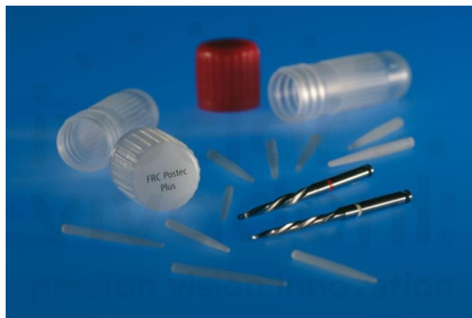
Slika 3. Kompozitni intrakanalni kolčići sa svrdlima za izradu intrakanalnog ležišta.

Kolčići, koji se temelje na kompozitnim materijalima, mogu sadržavati radioopakna karbonska vlakna (karbonski), polietilenska ili staklena vlakna. Karbonski kolčići posjeduju dobra biomehanička svojstva i modul elastičnosti sličan dentinu (30-40 GPa, dentin 15-25 GPa) (12). Otporni su na koroziju i biokompatibilni. No, nedostatak im je crna boja. S druge strane, kompozitni kolčić pojačan staklenim vlaknima bijele je boje i biokompatibilan (Slika 3). Modul elastičnosti sličan je dentinu (15 GPa), a u kombinaciji s adhezijskim cementiranjem ostvaruje čvrstu retenciju (12).