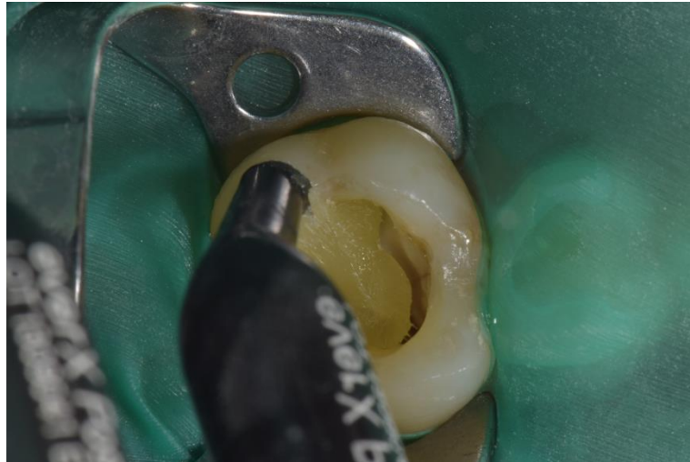
Slika 10. Unošenje kompozitnog materijala ojačanog vlaknima (EverX Posterior, GC, Tokio, Japan).