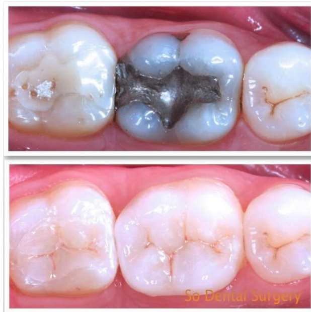
Slika 17. Zamjena amalgamskog ispuna keramičkim indirektnim ispunom.