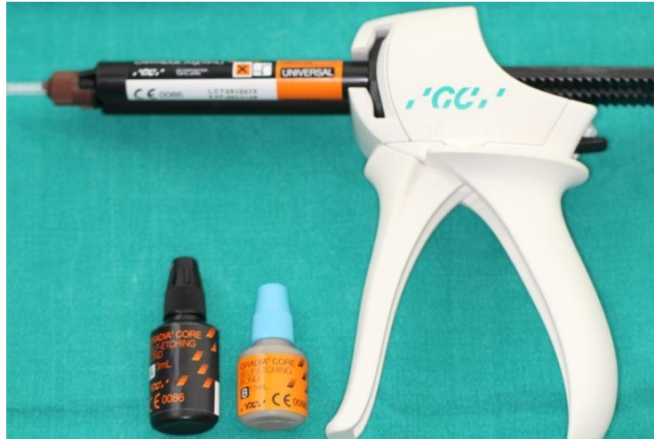
Slika 20. Dvostruko stvrdnjavajući kompozitni cement sa samojetkajućim adhezivnim sustavom.