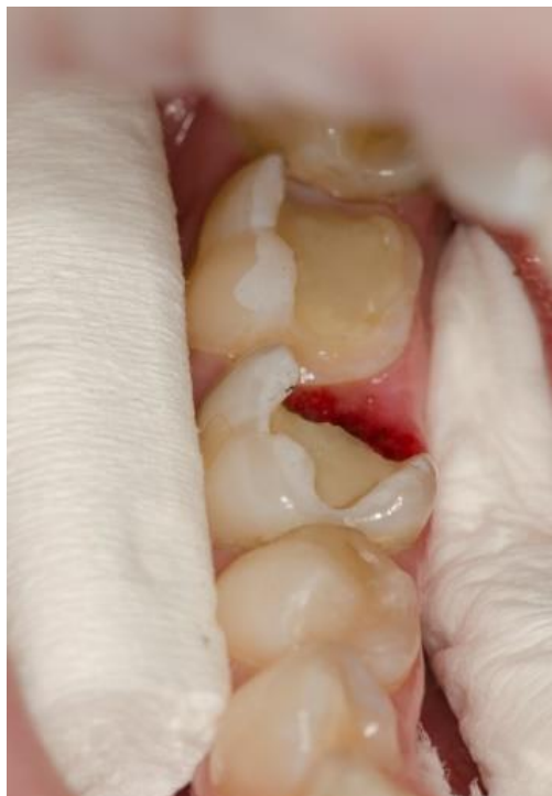
Slika 13. Preparacija kaviteta s divergentnim zidovima.