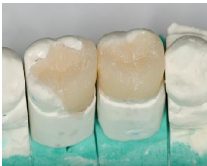
Slika 14. Izrada indirektnoga kompozitnog ispuna na modelu.