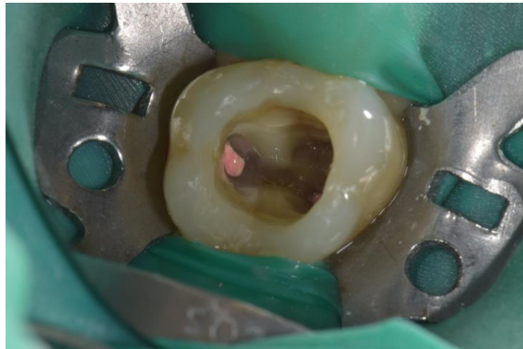
Slika 9. Endodontski liječen zub 16.

Razvoj kompozitno-adhezijske tehnologije doveo je do razvoja vlaknima ojačanih kompozita, koji su otvorili nove mogućnosti rješavanja estetskih i restaurativnih problema u stomatologiji. Vlakna daju čvrstoću i smanjuju mogućnost loma preostale zubne strukture te se često primjenjuju u postendodontskoj opskrbi. Koristi se kao zamjena za dentinsko tkivo te se kombinira s običnim kompozitom koji služi kao zamjena za caklinu (Slika 9, 10, 11).