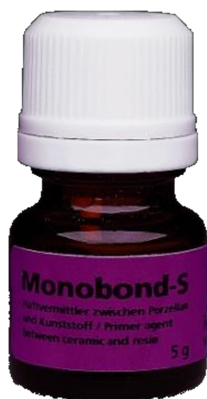
Slika 5. Sredstvo za silanizaciju.