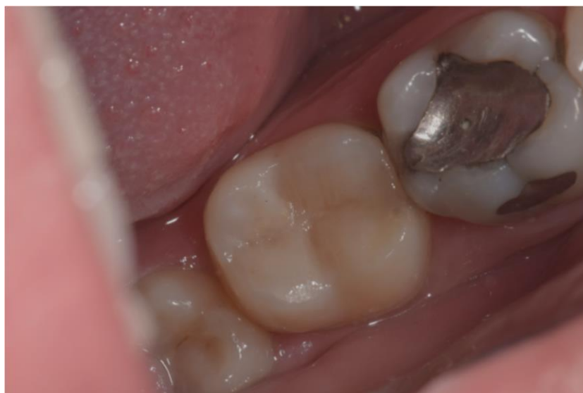
Slika 8. Zamijenjen amalgamski ispun kompozitnim materijalom na zubu 47.