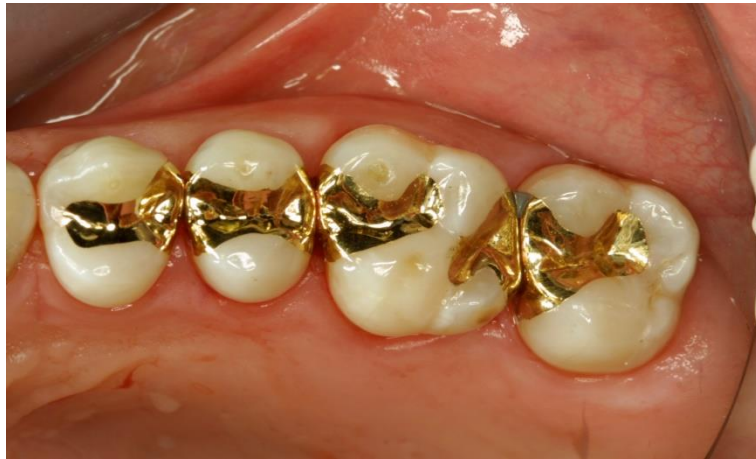
Slika 18. Zlatni indirektni ispun

a to podrazumijeva radikalno odstranjivanje tvrdih zubnih tkiva prilikom preparacije (36) (Slika 18).