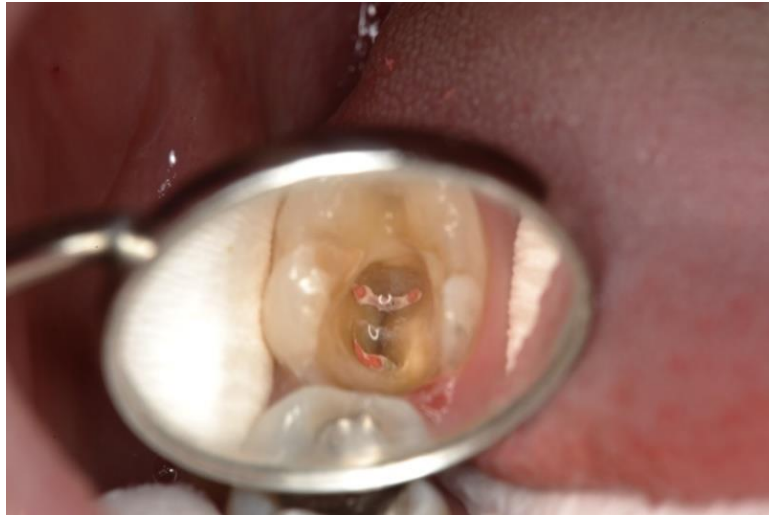
Slika 12. Endodontski liječen zub 37.