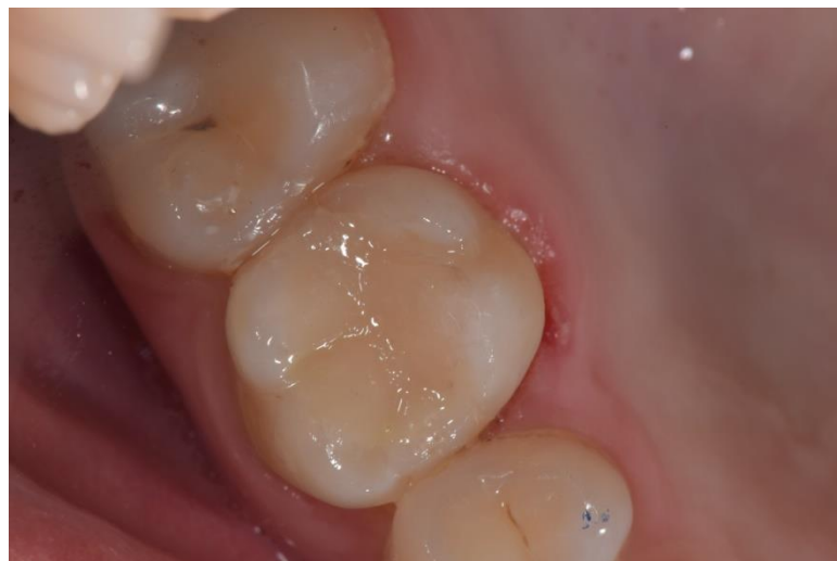
Slika 11. Kompozitni ispun na endodontski liječenom zubu 16.