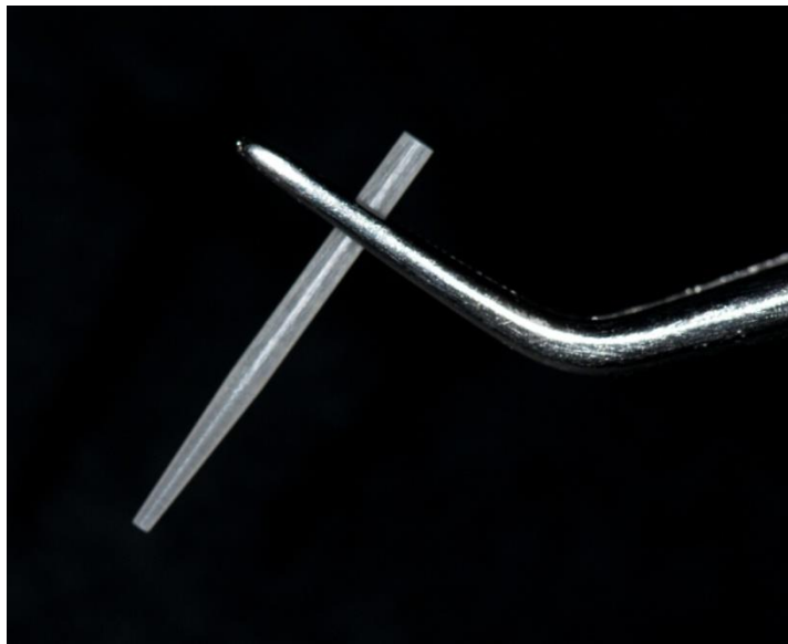
Slika 2. Kompozitni kolčić ojačan staklenim vlaknima.

Uporaba nemetalnih kolčića postaje sve učestalija, ne samo iz estetskih, već i medicinskih razloga, kao što su veća pojavnost alergija i moguće korozije. Estetske konfekcijske nadogradnje najčešće dolaze u setu s kalibriranim svrdlima čime se olakšava preparacija zuba (Slika 2).