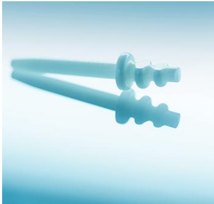
Slika 4. Cirkonski kolčić.

Cirkonski kolčići građeni su od polimorfnoga kristalnog dioksida i oksida (stabilizatora kristalne transformacije – itrij oksid). Imaju veliku otpornost prema frakturama te su biokompatibilni. Veza između cirkonskih kolčića i kompozitnih cemenata je ostvarena mehanički pjeskarenjem površine kolčića, čime se povećava i retencija samog kolčića (14). Cirkonski kolčići su kruti, nema amortiziranja sila stresa u korijenu pa se javlja povećan rizik frakture korijena (9) (Slika 4).