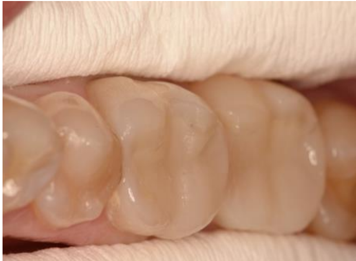
Slika 16. Indirektni kompozitni ispuni na zubima 36 i 37 nakon cementiranja.