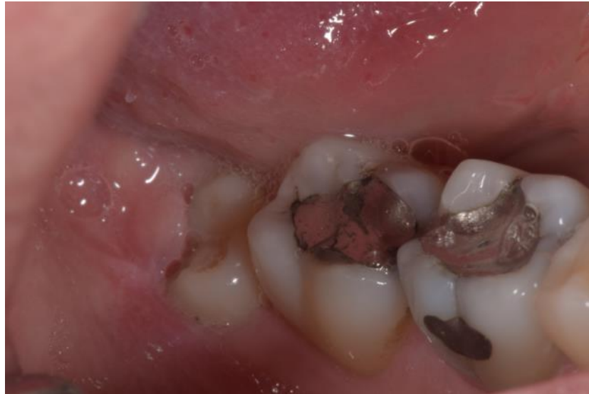
Slika 7. Stari amalgamski ispun na endodontski liječenom zubu 47.