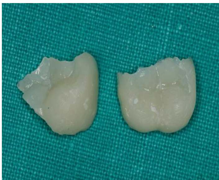
Slika 15. Indirektni kompozitni ispuni.