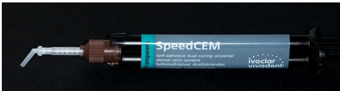
Slika 19. Samosvezujući kompozitni cement.