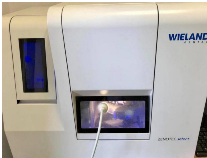
Slika 4. Glodalica.

Glodalice s tri osi za okretanje imaju mogućnost kretanja u tri ravnine dok glodalice s četiri osi mogu i rotirati držač bloka, što je povoljno za veće mosne konstrukcije. Glodalice pet osi uključuju i rotaciju glave stroja za glodanje, što im omogućuje glodanje nagnutih bataljaka (22, 24).