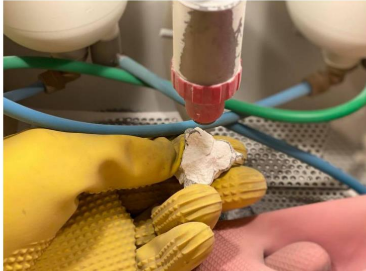
Slika 5. Pjeskarenje fiksnoprotetskog odljeva.

Obrada metalnih površina mobilnih odljeva započinje odsijecanjem ljevničkih kanala od osnovne metalne konstrukcije pomoću freza od tvrdog metala ili karborund pločica, ili oštrog točkastog kamena. Za obradu površina koje ne leže na modelu primjenjuju se freze od tvrdog metala, karborund kamen, hrapavi brusni papir, gumeni valjak, četkica i pasta za poliranje te pasta za visoki sjaj. Površine koje prilikom stavljanja na model leže na modelu teže je precizno mehanički obraditi te se one poliraju elektrolitički (2).