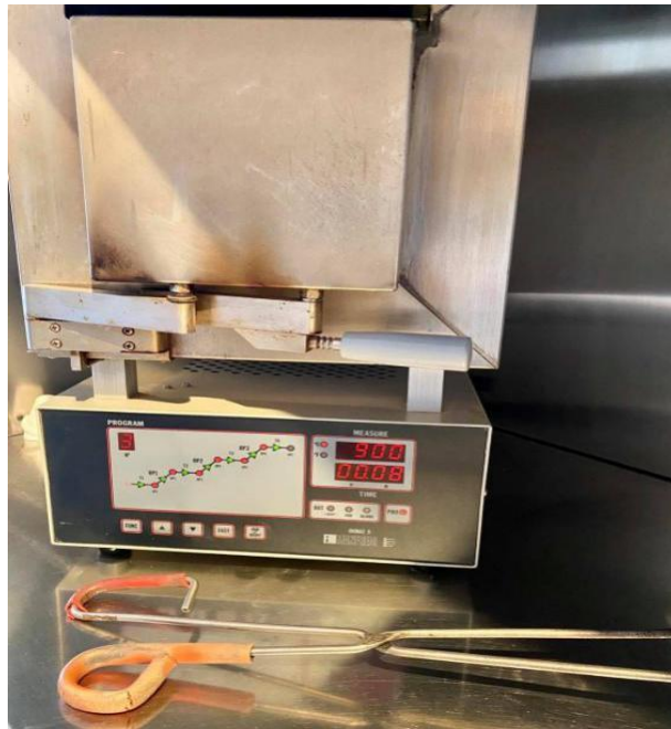
Slika 1. Peć za zagrijavanje.

Na tim temperaturama kiveta se ostavi 10 – 30 minuta. Kiveta je spremna za lijevanje kada je užarena do svijetlocrvenoga žara (Slika 2.) (21).