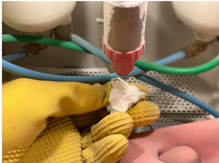
Slika 5. Pjeskarenje fiksnoprotetskog odljeva.

Obrada metalnih površina mobilnih odljeva započinje odsijecanjem ljevničkih kanala od osnovne metalne konstrukcije pomoću freza od tvrdog metala ili karborund pločica, ili oštrog točkastog kamena. Za obradu površina koje ne leže na modelu primjenjuju se freze od tvrdog metala, karborund kamen, hrapavi brusni papir, gumeni valjak, četkica i pasta za poliranje te pasta za visoki sjaj. Površine koje prilikom stavljanja na model leže na modelu teže je precizno mehanički obraditi te se one poliraju elektrolitički (2).