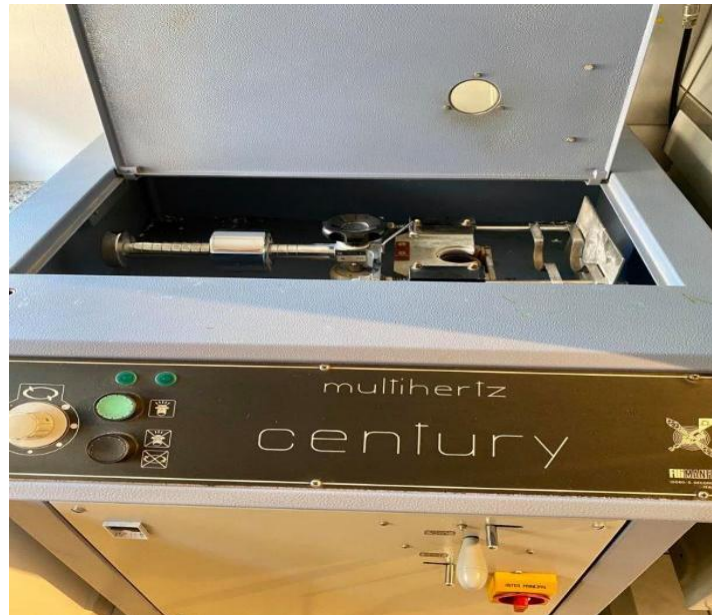
Slika 3. Centrifugalni lijevač.

Lijevanje je postupak pri kojem se rastaljena legura ulijeva u praznu kivetu. Danas se primjenjuje lijevanje pomoću centrifugalne sile ili lijevanje u tlačno vakuumskom aparatu uz pomoć zračnog tlaka i tlaka vodene pare (20). Centrifugalno lijevanje radi na principu djelovanja centrifugalne sile koja nastaje rotacijom kivete (Slika 3.). Centrifugalno se može lijevati u vakuumu ili normalnoj atmosferi. Tlačno vakuumski aparat rjeđe se nalazi u laboratorijima zbog svoje skuplje cijene. Sastoji se od dviju odvojenih komorica. Kada se postigne temperatura lijevanja, talina se pod utjecajem gravitacijske sile prelije u prazni prostor kivete te se dodatnim tlakom zraka utisne u najdalje i najuže prostore. Lijevanje u tlačko vakuumskom aparatu osigurava cjelovitost i kvalitetu površine odljeva (1).