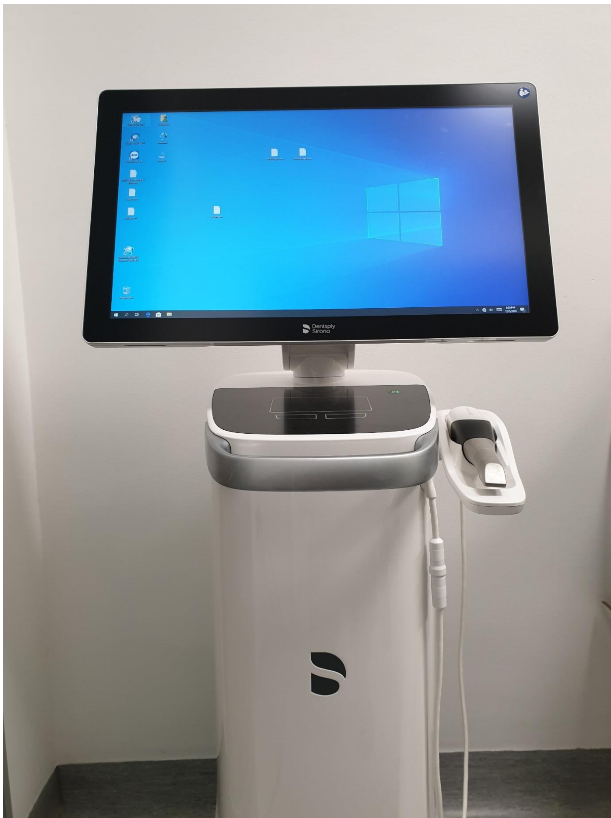
Slika 7. CEREC Primescan i računalo sa softverom za dizajn.