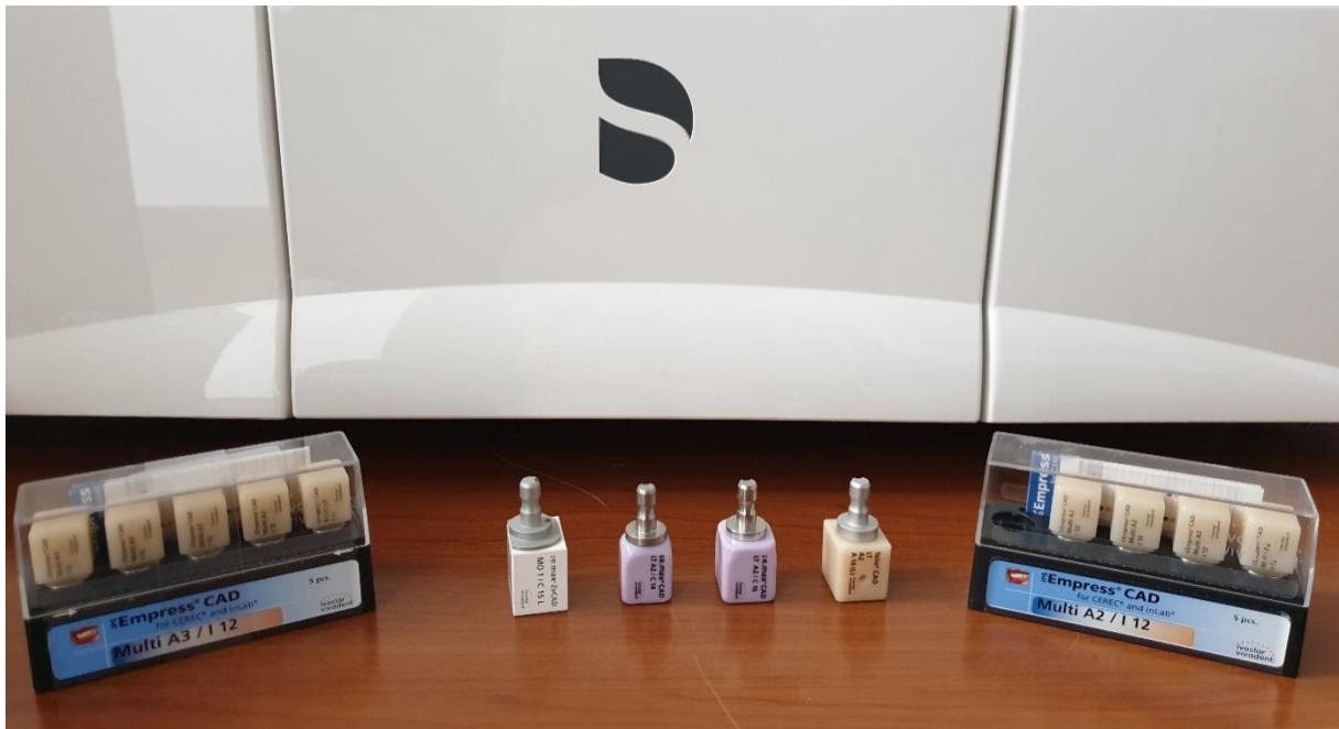
Slika 4. Blokovi materijala za glodalicu.

Litij-silikatna keramika ima kristaličnu fazu koja se sastoji od litijevog disilikata i litijevog ortofosfata, što povećava otpornost na lom bez negativnog utjecaja na translucenciju. Nakon što su glodalicom izvedeni, nadomjesci se moraju kristalizirati u peći za sinteriranje te nakon toga dodatno bojati i glazirati. Sa čvrstoćom od oko 407 MPa, smatraju se najjačom keramikom na bazi silicija za uporabu u dentalnoj medicini (25). U ovoj je skupini izuzetno popularan IPS e.max CAD (Ivoclar Vivadent, Schaan, Lihtenštajn) blok te litij silikatna keramika ojačana cirkonijevim oksidom: VITA Suprinity PC (VITA Zahnfabrik, Sachingen, Njemačka) i Celtra Duo (Dentsply Sirona, York, Pennsylvania, SAD) blokovi. U kombinaciji s titanskom bazom, ovi se materijali mogu koristiti za izradu monolitnih krunica na implantatima (14).