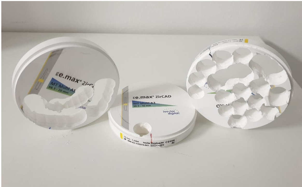
Slika 5. Cirkonijoksidni blok za glodalicu.