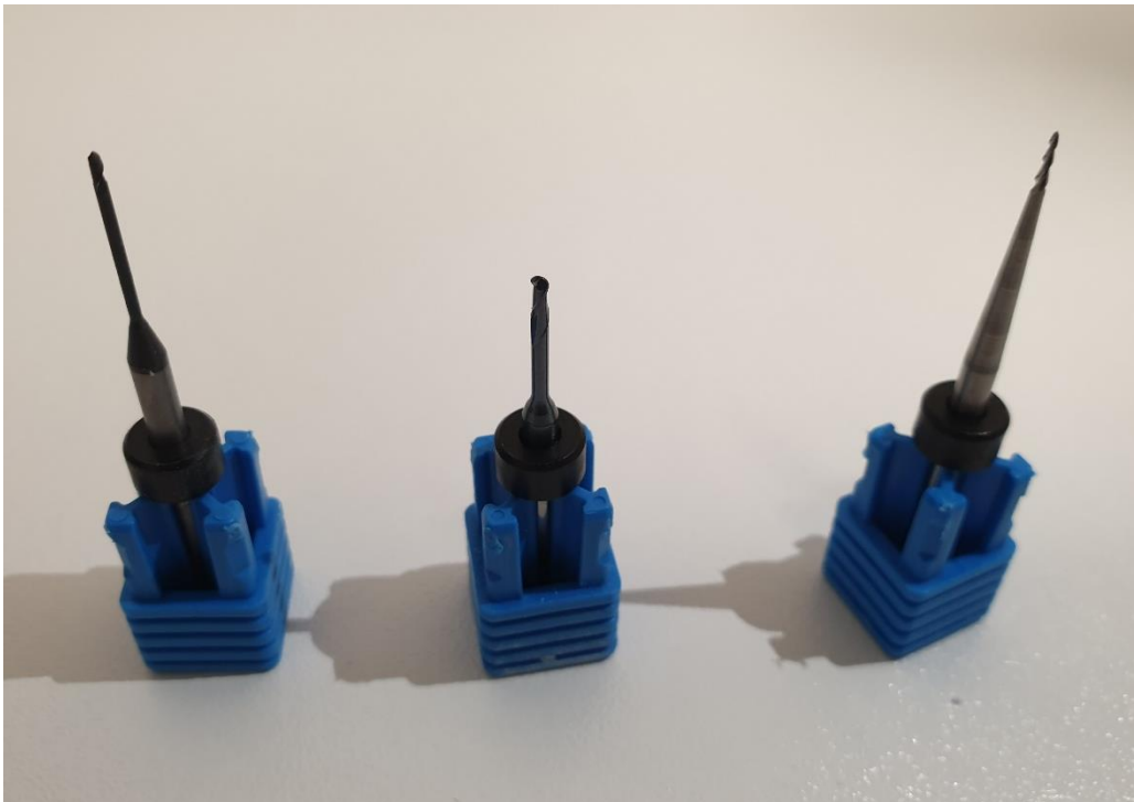
Slika 2. Svrdla za glodalicu. Preuzeto s dopuštenjem autora: prof.dr.sc. Zoran Kovač

Brusna sredstva odnosno svrdla mogu biti karbidna i čelična. Karbidna svrdla (Slika 2.) koja su ekonomski prihvatljivija koriste se za obradu PMMA termoplastičnog materijala, voska, kobalt krom legura, titan legura i cirkonijoksidne keramike. Potrebno je redovito čišćenje karbidnih svrdala kako bi se očuvale optimalne rezne sposobnosti. Materijali poput PMMA-a i voska mogu se zadržati unutar reznih žljebova tijekom hlađenja materijala i zaostati na svrdlu. Ukoliko se karbidna svrdla koriste za obradu cirkonijeva oksida skraćuje im se vijek trajanja. Za obradu cirkonijevog oksida bolje je koristiti dijamanta svrdla čime se dobivaju visoko kvalitetni nadomjesci sa dobrim marginalnim dosjedom, kao i za obradu kompozitnih materijala i hibridne keramike (15).