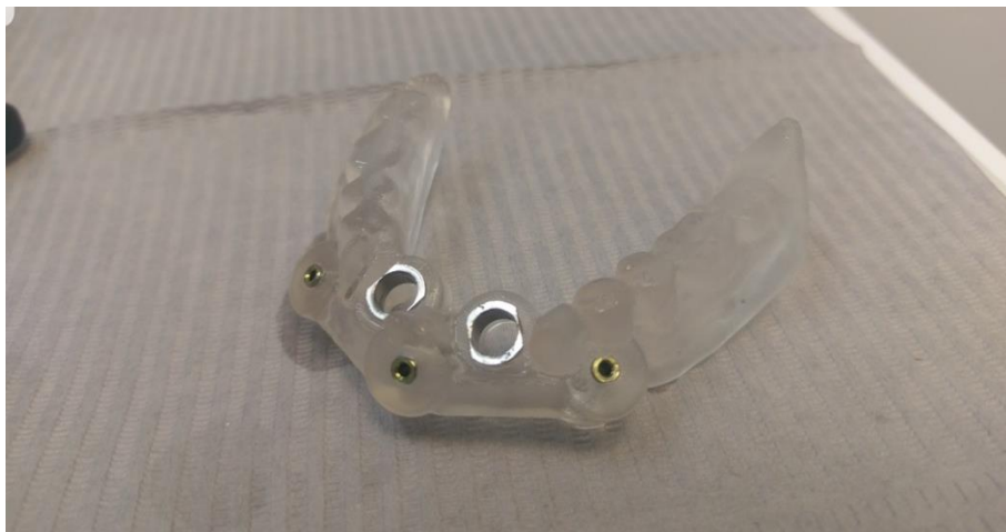
Slika 6. Kirurški predložak poduprt sluznicom.

Kod predloška poduprtog sluznicom moramo biti veoma oprezni i biti sigurni da čvrsto leži na predviđenom mjestu jer zbog pomičnosti sluznice može doći do pomaka predloška, a to može dovesti do postavljanja implantata na mjestu koje nije predviđeno, zato se dodatna retencija postiže s minimalno tri retencijska vijka koja su jednakomjerno raspoređena s vestibularne strane, izvan područja implantacije, kako ne bi ometali postavu implantata (47). Predložak poduprt sluznicom najčešće se izvodi kod osoba s potpuno bezubom čeljusti i s minimalno 2 mm koštanog tkiva bukalno i lingvalno od predviđenog mjesta za implantaciju zbog povećanog rizika od perforacije kortikalne kosti koja može biti posljedica neodizanja mukoperiostalnog režnja i ograničene vidljivosti operacijskog područja (45).