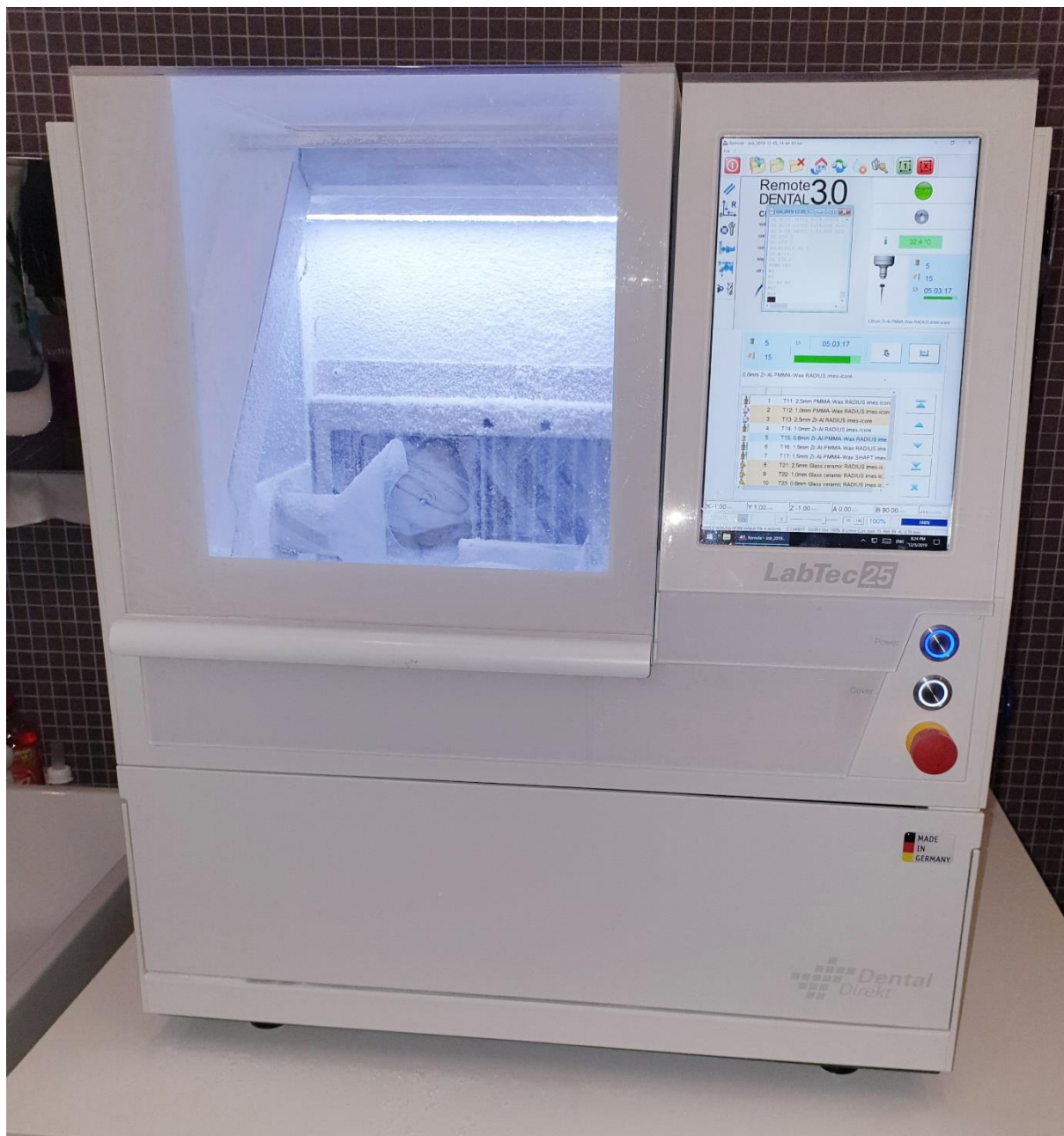
Slika 10. LabTec 25 glodalica.