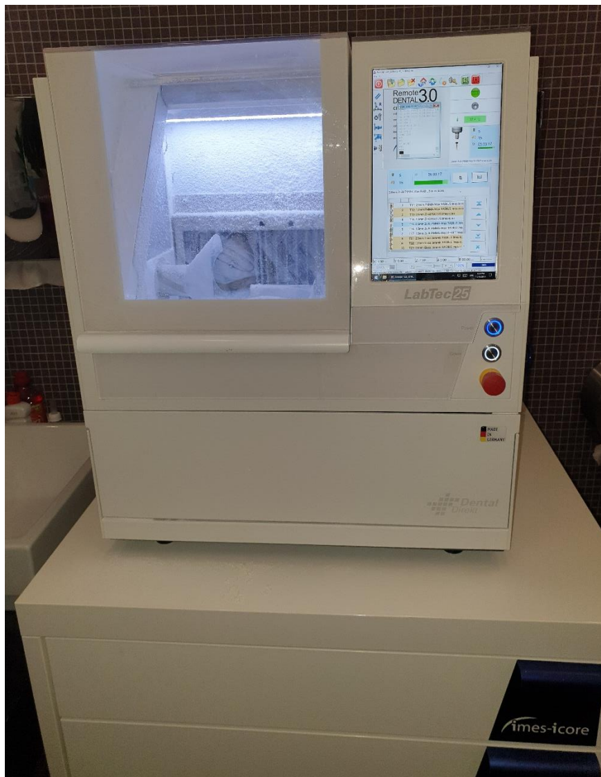
Slika 1. Glodalica.

Primjeri ovakvih glodalica su PlanMill 50 S (Planmeca, Helsinki, Finska), Programill One (Ivoclar Vivadent, Schaan, Lihtenštajn), Coritec series (Imes- icore, Eiterfeld, Njemačka), Ceramill motion 2 (Amann Girrbach, Koblach, Austrija), Datron D5 (Datron, Muhltal, Njemačka), Dgshape DWX- 52D (Rolanddg, Hamamatsu, Japan), DC (ZublerUSA, Lawrenceville, Georgia, SAD), LabTec (Dental Direkt, Spenge, Njemačka) (Slika 1.) i druge. Kvaliteta izgledanih nadomjestaka ne mora nužno biti povećana sa brojem osi za glodanje. Povećani broj osi preciznije izrađuje složene restauracije i ne odnosi se na kvalitetu. Kvaliteta nadomjeska više je rezultat precizno digitalno isplanirane restauracije (14).