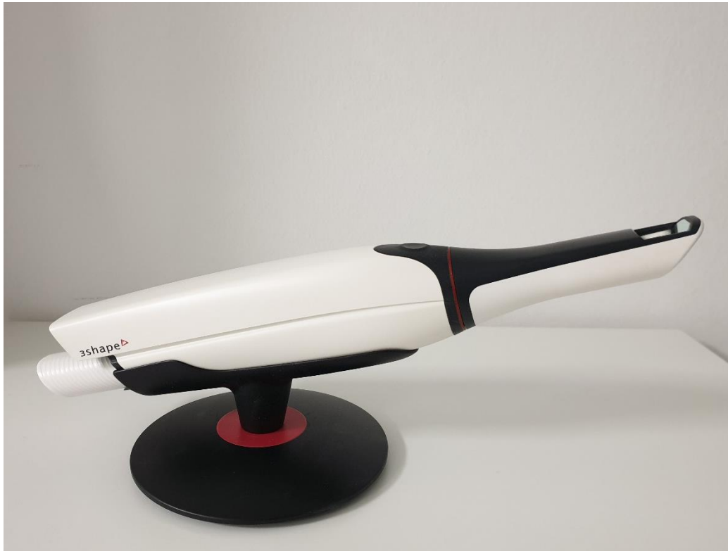
Slika 9. TRIOS 4 intraoralni skener.

ako govorimo o ortodontskim tretmanima alignerima simulaciju pomaka zuba (TRIOS Treatment simulator). TRIOS 4 (Slika 9.) ima i mogućnost detekcije početnih interproksimalnih karijesnih lezija transiluminacijom. Jedini je skener na tržištu koji može raditi bežično.