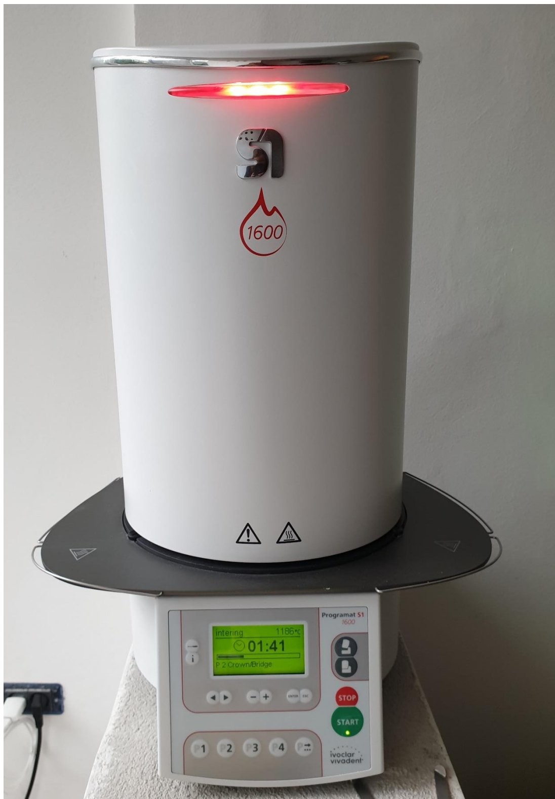
Slika 3. Peć za sinteriranje.