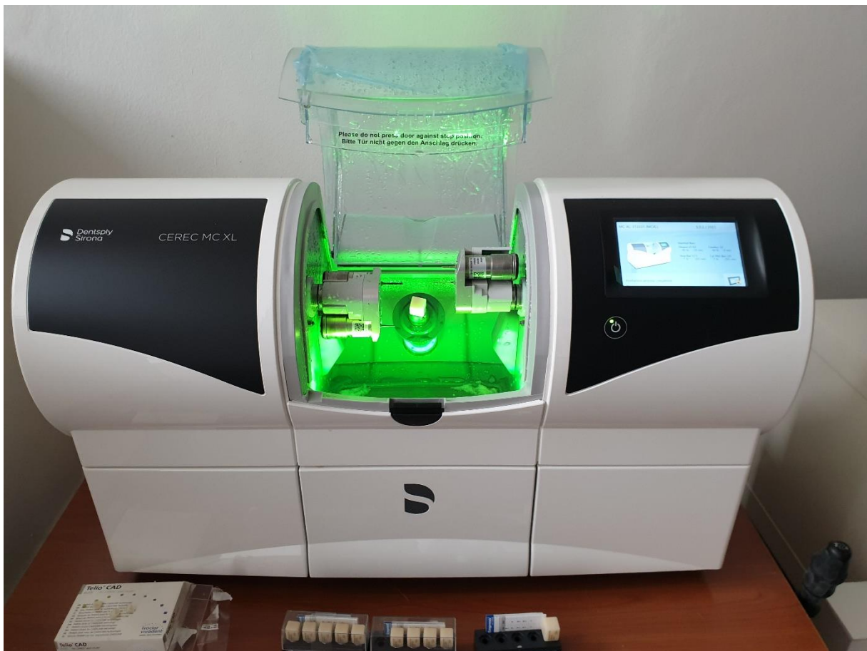
Slika 8. Glodalica CEREC MC XL.