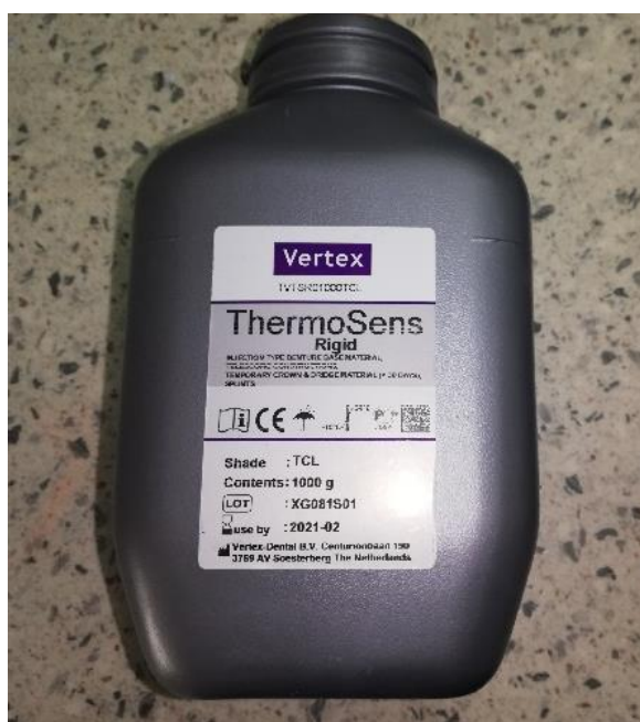
Slika 6. Materijal za poliamidne proteze

Na tržištu postoje brojni poliamidi koji se rabe u stomatologiji, primjerice Valplast, Ultimate, Vertex Thermosens, Deflex itd.