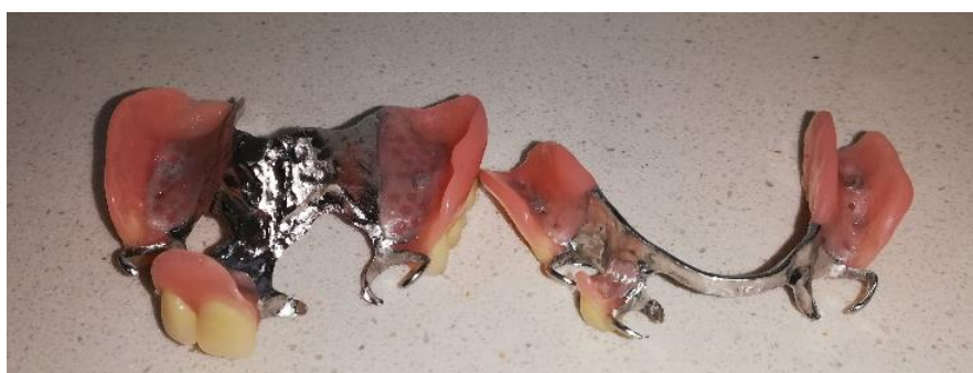
Slika 7. Djelomična akrilatna proteza poduprta metalnim skeletom

Sve se više teži uporabi neplemenitih legura bez nikla zbog njegove povezanosti s nastankom alergijskih reakcija. Danas su u upotrebi slitine bez nikla (npr. Wironit ili Wironium). Prednosti uporabe neplemenitih slitina za lijevanje mobilnih protetskih nadomjestaka jesu u tome što su lakše, što imaju bolja mehanička svojstva, tj. vrlo su tvrde, čvrste i otporne na trošenje i visoke temperature, a sadržavanje kroma čini ih otpornima na elektromehaničku koroziju (37).