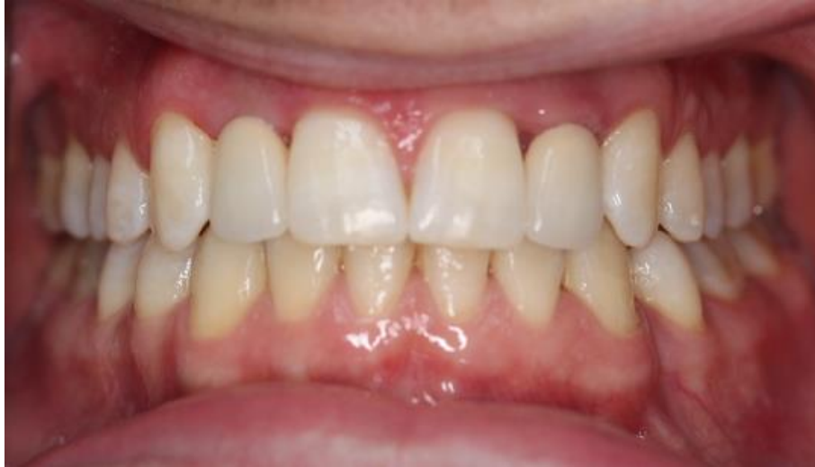
Slika 24. Završetak terapije.