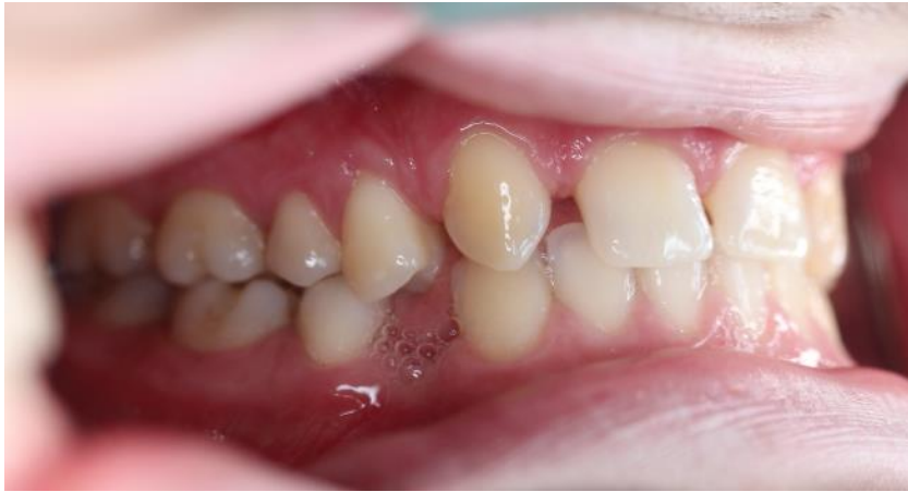
Slika 9. Lateralna dimenzija okluzije – lijeva strana.