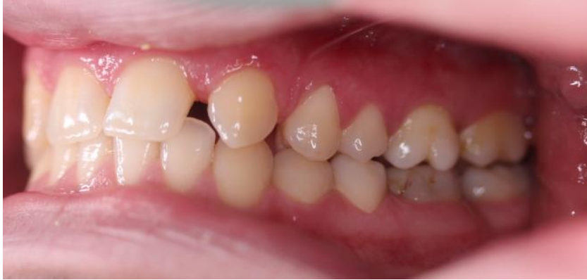
Slika 8. Lateralna dimenzija okluzije – desna strana.