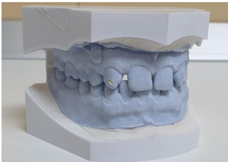
Slika 11. Studijski sadreni modeli.

U svrhu planiranja terapije kao i njenog praćenja, osim ekstraoralnih i intraoralnih fotografija (Slika 2.-9.), uvršteni su i studijski sadreni modeli (Slika 11.) dobiveni izlivanjem anatomskih otisaka iz ireverzibilnog hidrokoloida (alginata) te registracijom međučeljusnog odnosa pomoću adicijskog silikona (Futar D Fast – Kettenbach, Njemačka).