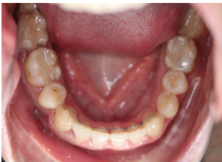
Slika 20. Okluzalne plohe zuba donje čeljusti - kraj aktivne faze ortodonske terapije.

Retencija je nužna iz tri osnovna razloga: