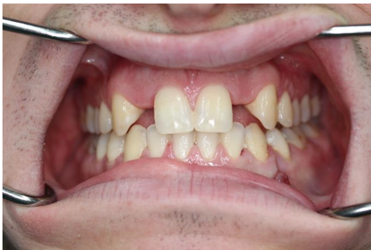
Slika 16. Frontalna dimenzija okluzije - kraj aktivne faze ortodontske terapije.