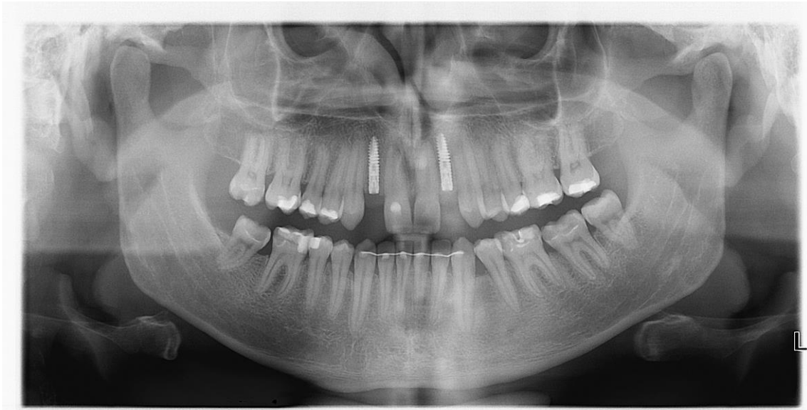
Slika 22. Ortopantomogram nakon perioda oseintegracije u trajanju od tri mjeseca.