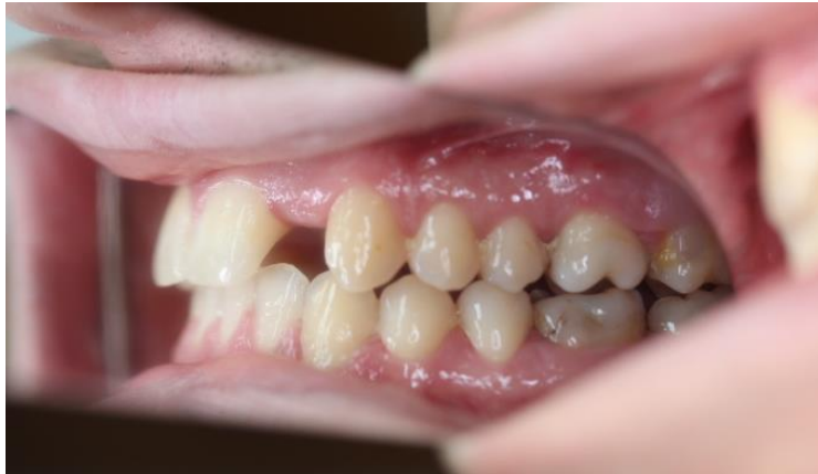
Slika 17. Lateralna dimenzija okluzije (desna strana) - kraj aktivne faze ortodonske terapije.