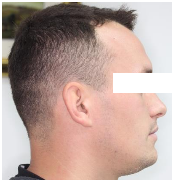
Slika 13. Profil lica - kraj aktivne faze ortodonske terapije.