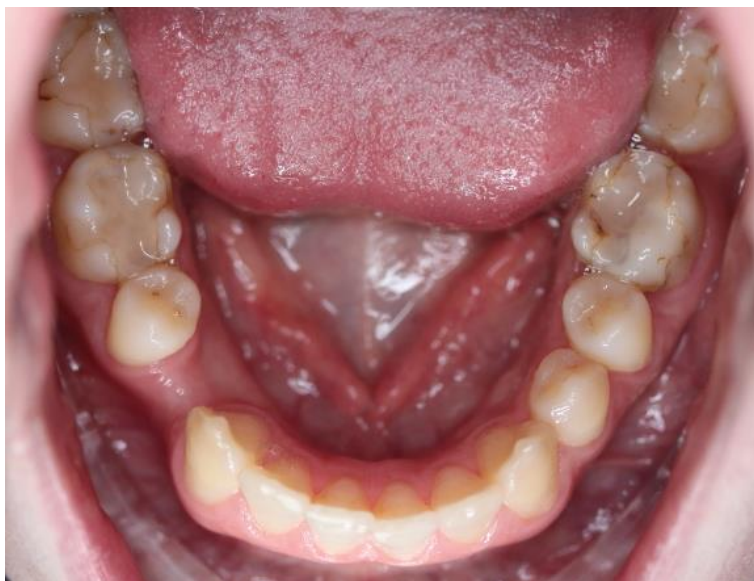
Slika 6. Okluzalne plohe zuba donje čeljusti.

Promatranjem frontalne dimenzije okluzije, zamijećen je estetski nepovoljan tijek gingive desnog i lijevog središnjeg sjekutića te estetski nepovoljan konkavni tijek linije koju tvore incizalni bridovi središnjih sjekutića. Pažljivim pregledom odnosa boja između očnjaka i maksilarnih središnjih sjekutića, otkriveno je nepodudaranje boje (Slika 7.). Analizom lateralne dimenzije okluzije, zamijećena je klasa II po Angleu s desne strane te klasa I po Angleu s lijeve strane (Slika 8. i Slika 9.).