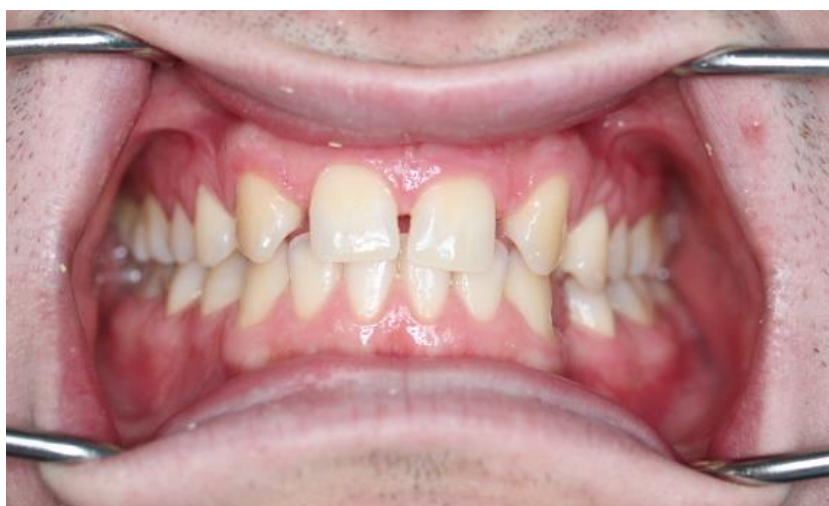
Slika 7. Frontalna dimenzija okluzije.

Promatranjem frontalne dimenzije okluzije, zamijećen je estetski nepovoljan tijek gingive desnog i lijevog središnjeg sjekutića te estetski nepovoljan konkavni tijek linije koju tvore incizalni bridovi središnjih sjekutića. Pažljivim pregledom odnosa boja između očnjaka i maksilarnih središnjih sjekutića, otkriveno je nepodudaranje boje (Slika 7.). Analizom lateralne dimenzije okluzije, zamijećena je klasa II po Angleu s desne strane te klasa I po Angleu s lijeve strane (Slika 8. i Slika 9.).