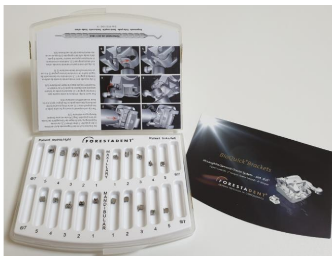
Slika 12. Set BioQuick bravica – Forestadent, Njemačka.

Ortodonska faza terapije započela je postavom samovezujućih BioQuick bravica (Forestadent, Njemačka) (Slika 12.) na zube gornje i donje čeljusti te aplikacijom okrugle termoaktivne nikal-titanske žice promjera 0.016" (Tensic Idealbogen - Dentaureum, Njemačka). Time smo započeli fazu nivelacije zubi.