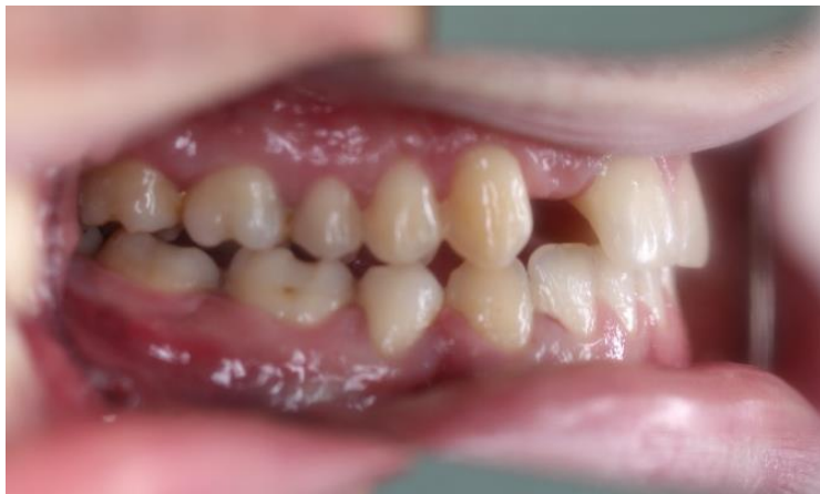
Slika 18. Lateralna dimenzija okluzije (lijeva strana) - kraj aktivne faze ortodonske terapije.