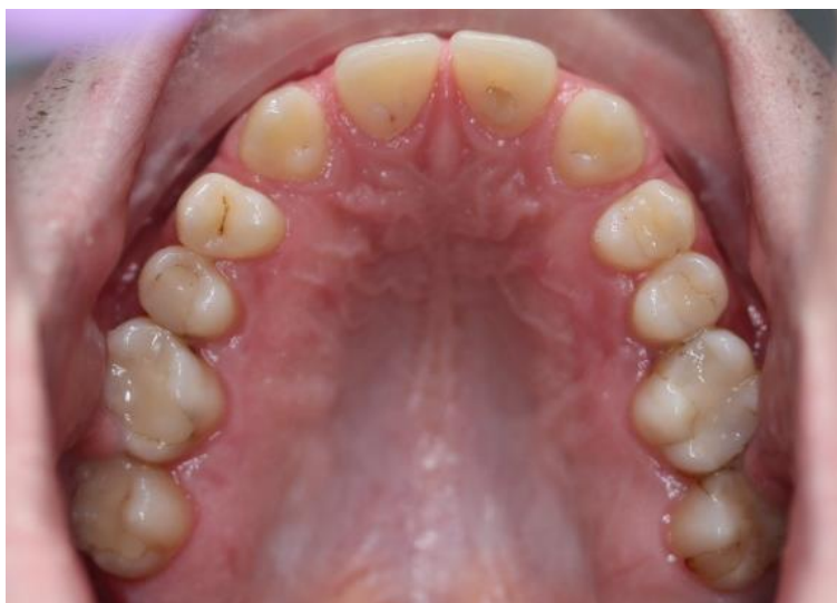
Slika 5. Okluzalne plohe zuba gornje čeljusti.

Kliničkim pregledom ustanovljeno je da je stanje oralne sluznice uredno, a oralna higijena zadovoljavajuća. Nisu nađeni znakovi bolesti parodonta. Nadalje, utvrđeno je, da su unatrag nekoliko godina, pretkutnjaci i kutnjaci u obje čeljusti sanirani kompozitnim ispunima (Slika 5. i Slika 6.). Utvrđen je nedostatak oba gornja lateralna sjekutića, donjeg lijevog prvog pretkutnjaka, gornjih trećih molara te donjeg desnog trećeg molara. Anamnestički smo došli do podatka da je donji lijevi prvi pretkutnjak prije nekoliko godina ekstrahiran zbog neuspjele endodontske terapije. Posljedično nalazimo na tom mjestu vertikalni i horizontalni gubitak kosti. (Slika 6.).