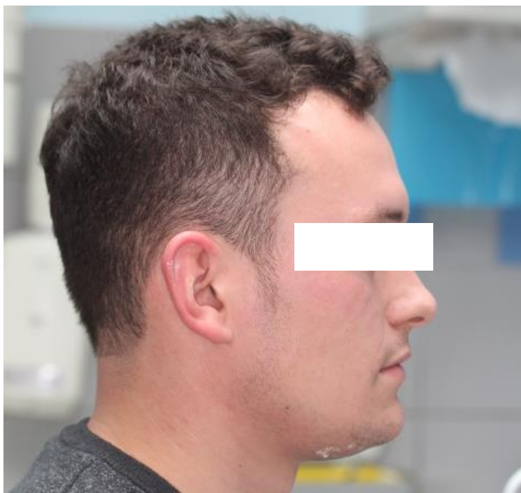
Slika 4. Profil lica.