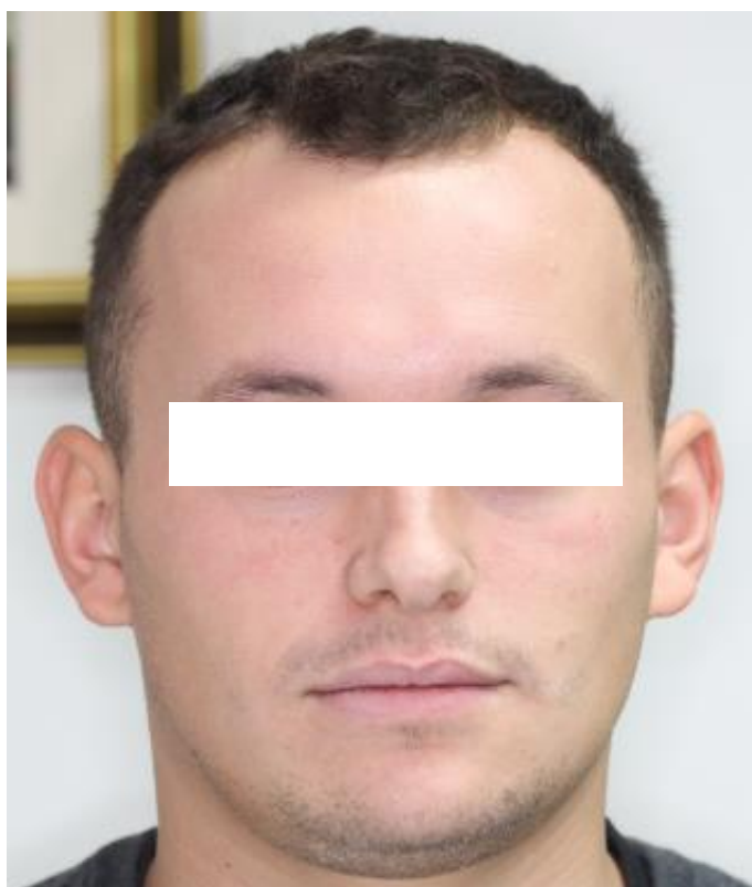
Slika 14. Simetrija lica - kraj aktivne faze ortodonske terapije.