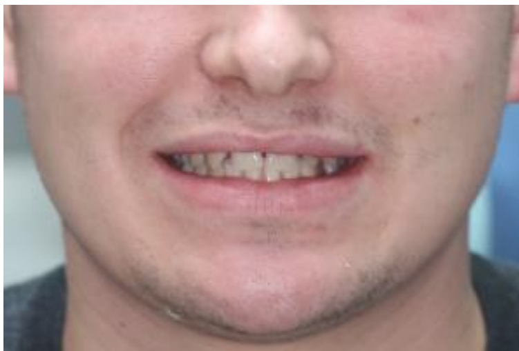
Slika 2. Slika osmijeha.

Glavni razlog dolaska pacijenta bilo je nezadovoljstvo estetikom osmijeha zbog postojanja dijastema u području gornje čeljusti (Slika 2.). Već samim promatranjem pacijenta prilikom prvog razgovora, uočen je nedostatak gornjih lateralnih sjekutića. Stomatološkom anamnezom isključena je mogućnost nedostatka zuba uzrokavanog traumom ili preranom ekstrakcijom zbog karijesa.