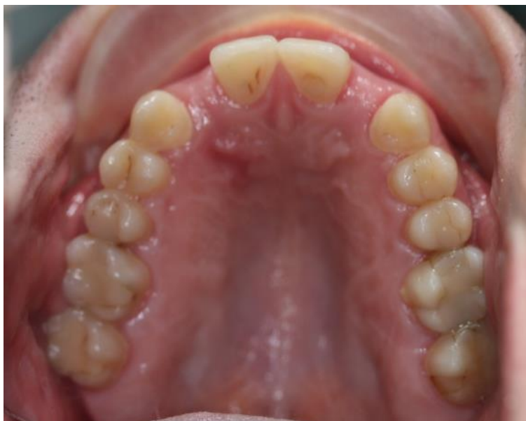
Slika 19. Okluzalne plohe zuba gornje čeljusti - kraj aktivne faze ortodonske terapije.