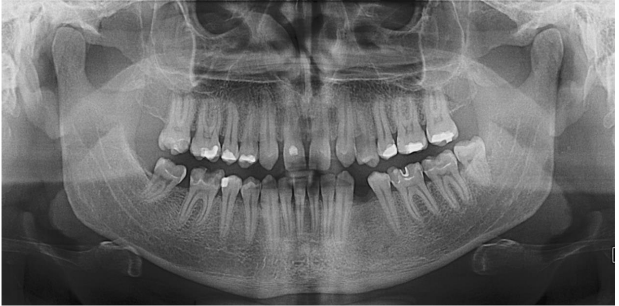
Slika 10. Ortopantomogram.