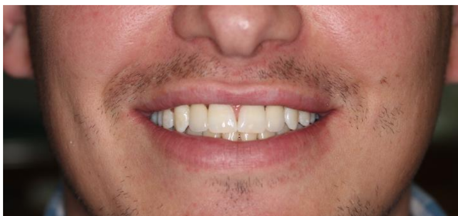
Slika 23. Završetak terapije.