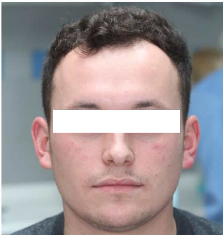
Slika 3. Simetrija lica.