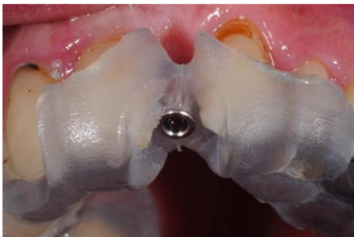
Slika 5. Digitalno izrađena kirurška šablona.