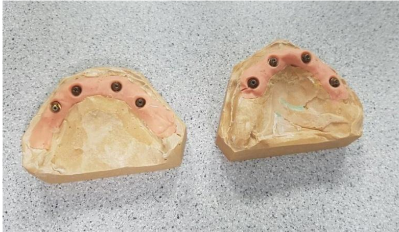
Slika 4. Modeli s replikama.

Nakon registracije međučeljusnih odnosa provjeravamo dosjed žiga, kako bi bio identičan u ustima i na modelu. Rade se dvije provjere. Prva uključuje provjeru na pacijentu. Skine se provizorij i žig se u komadu postavi na implantate gdje ne smije biti napetosti pri zatezanju. Rendgenski se provjere dosjedi. Zatim se žig diskom podijeli na 4 dijela, svaki se posebno stavi na svoj implantat i prostori između njih popune hladnopolimerizirajućim akrilatom. Vraćamo provizorij pacijentu, a žig tehničaru. Novi žig proba se na modelu i promatra se postoje li odstupanja. Ukoliko postoje, radi se modifikacija modela. Izvadi se ona replika u modelu na kojoj cilindar ne leži dobro i taj se dio sadre skine nožićem. Problematična replika se sada učvrsti za odgovarajući cilindar. Ostali cilindri na žigu se zategnu. Prazni se prostor u modelu puni sadrom ili akrilatom i tako smo dobili popravljene model. Tehničar izrađuje protezu u vosku. Skidamo provizorij i provjeravamo prototip proteze u vosku. Ako smo zadovoljni estetikom, fonetikom, funkcijom i podrškom usnama, šaljemo u laboratorij za izradu titanske konstrukcije. U idućoj posjeti provjeravamo dosjed titanske konstrukcije. Kad je rad gotov i stigao u ordinaciju, posljednji put skidamo provizorij. Učvršćujemo trajni rad bez napetosti i provjeravamo dosjed na rendgenu. Ukoliko je sve u redu otvore pečatimo teflonom i kompozitom. Preporučuje se pacijentu izraditi zaštitnu noćnu udlagu i predati u istom posjetu kad i gotov rad.