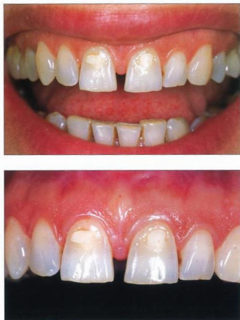
Slika 1. Dijastema medijana. Preuzeto: (4)