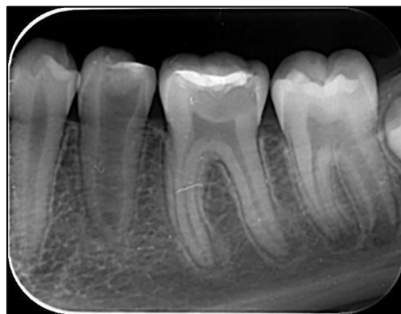
Slika 5. Radiološki prikaz zuba 35 nakon liječenja primjenom PRF-a.