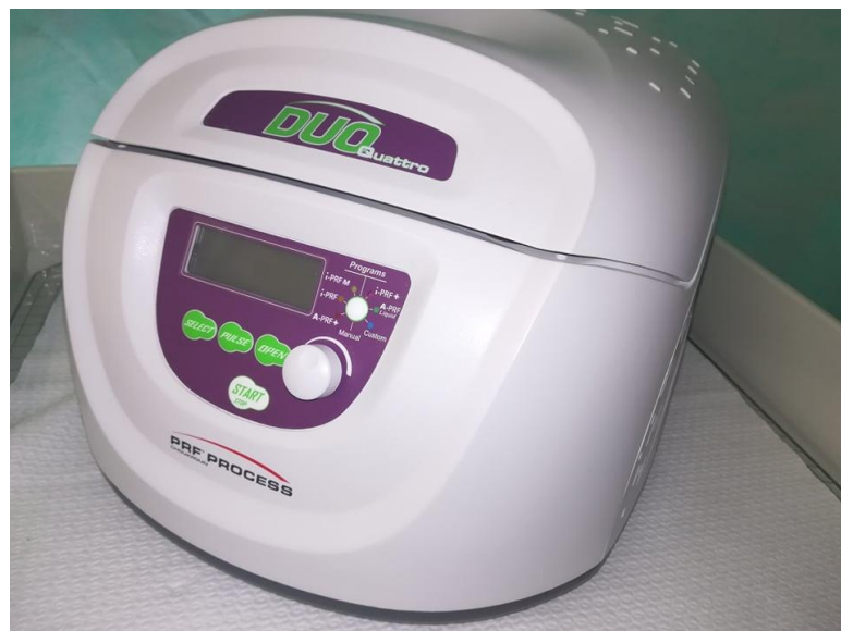
Slika 1. Centrifuga za PRF.

Nakon centrifugiranja slijedi formiranje troslojnog koloida koji se u epruveti sastoji od sloja crvenih krvnih stanica na dnu epruvete, fibrinskog ugruška u sredini te acelularne plazme pri vrhu epruvete (12).