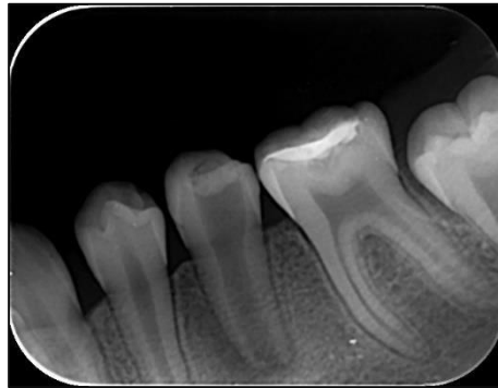
Slika 4. Radiološki prikaz zuba 35 prije liječenja.