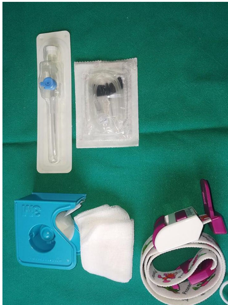
Slika 2. Set za venepunkciju.