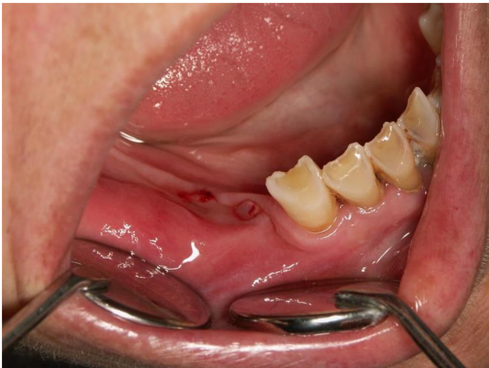
Slika 2. Stadij 0. MRONJ.

Stadij 0. predstavlja preteču pravoj bolesti. Kategorizira pacijente koji su izloženi riziku, ali s nespecifičnim simptomima te nespecifičnim kliničkim i rendgenskim znakovima.