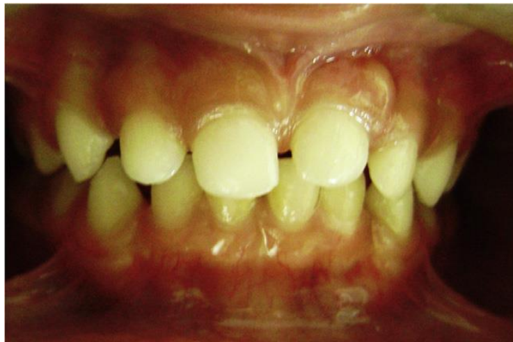
Slika 4. Re-erupcija zuba 61 nakon intruzije. Preuzeto iz (7).

Jedna od najtežih komplikacija ozljede je infekcija, ali odluka o antibiotskoj terapiji temelji se na iskustvu kliničara (51). Praćenje ozlijeđenih zuba mliječne denticije kliničko je i radiološko u vremenskim intervalima: nakon 1. tjedna kliničko, za 3 do 4 tjedna kliničko i radiološko, nakon 6 do 8 tjedana kliničko, nakon 6 i 12 mjeseci kliničko i radiološko te svake godine do erupcije trajnog nasljednika (11).