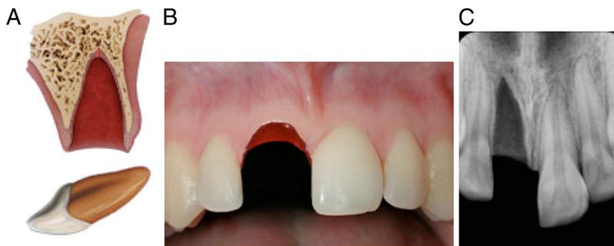
Slika 6. Avulzija. Preuzeto iz (11).