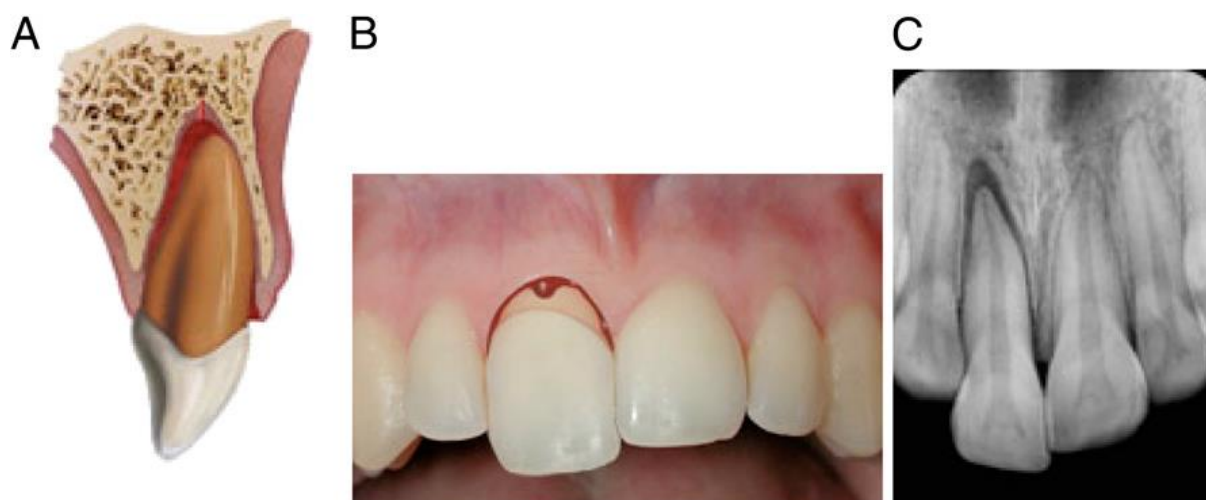
Slika 2. Ekstruzija. Preuzeto iz (11).