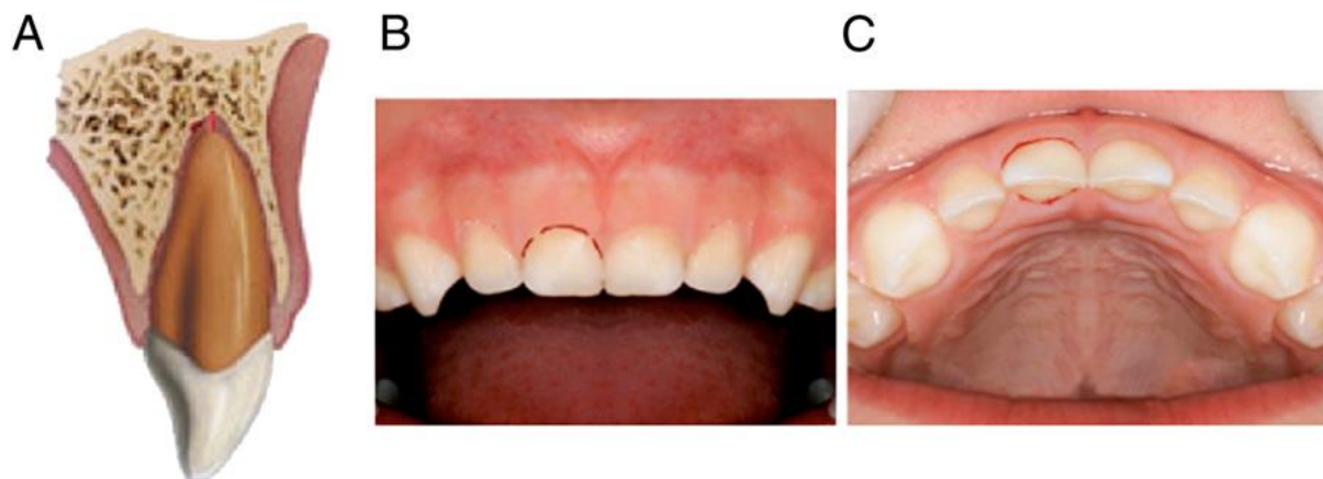
Slika 1. Subluksacija. Preuzeto iz (11).

Potrebno je praćenje zuba nakon 2, 4, 6 – 8 tjedana, 6 mjeseci i godinu dana (41).