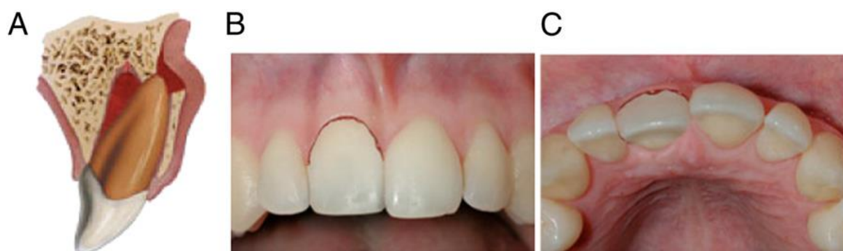
Slika 5. Lateralna luksacija. Preuzeto iz (11).

Trajni zub može se reponirati kliještima i prstima, pritiskom u incizalnom smjeru preko apeksa, čime se prvo zub lagano ekstrudira kako bi se oslobodio apeks i tada reponira u apikalnom smjeru. Provjeri se okluzija i učini rendgenska snimka radi kontrole položaja zuba. Stabilizacija zuba u njegovu anatomskom položaju postiže se fleksibilnim splintom tijekom 3 do 4 tjedna kako bi se postiglo optimalno cijeljenje PDL-a i neurovaskularna opskrba. Ako je ozlijeđena marginalna kost preporučuje se imobilizacija i do 6 do 8 tjedana. Uz preporuke oralne higijene prati se za 2, 4, 6 – 8 tjedana, 6 i 12 mjeseci te jednom godišnje tijekom pet godina. Kod zuba s lateralnom luksacijom treba nadzirati vitalitet pulpe. Ako tijekom nadzora pulpa postane nekrotična, potrebna je terapija korijenskog kanala kako bi se spriječila resorpcija korijena. Endodontska terapija korijenskog kanala potrebna je i kod teže lateralno luksiranih trajnih zuba s radiološki zatvorenim apeksom. Nekroza pulpe češća je komplikacija cijeljenja. Lateralnu luksaciju često prati ozljeda kosti i lokalizirana ishemija radi prekida neurovaskularne opskrbe pulpe. Treba spriječiti upalnu resorpciju kao rezultat toksina iz nekrotične pulpe. Ako je zanemarena terapija korijenskog kanala, može se razviti infekcijom uzrokovana resorpcija korijena kao vrlo opasna mogućnost (41, 55, 56).