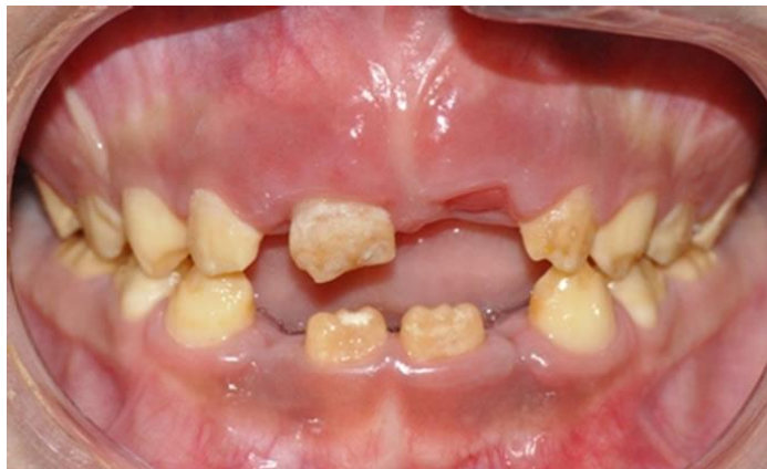
Slika 4. Amelogenesis imperfecta. Preuzeto iz: (15)

Dentinogenesis imperfecta (DI) je nasljedni poremećaj koji pogađa mliječne i trajne zube. Promjene nastaju na dentinu kao posljedica mutacije gena koji su uključeni u sintezu kolagena. Zubi pokazuju različite promjene boje, od žute do plavkasto-sive (Slika 5). Boje se mijenjaju ovisno o tome promatra li ih se pomoću transmitirane ili reflektirane svjetlosti. Također, pokazuju i veliki stupanj jantarne translucencije zubi. Dentin je često izložen jer caklina lako puca, što olakšava apsorpciju kromogena u porozni dentin i zubi vrlo brzo mijenjaju boju (8).