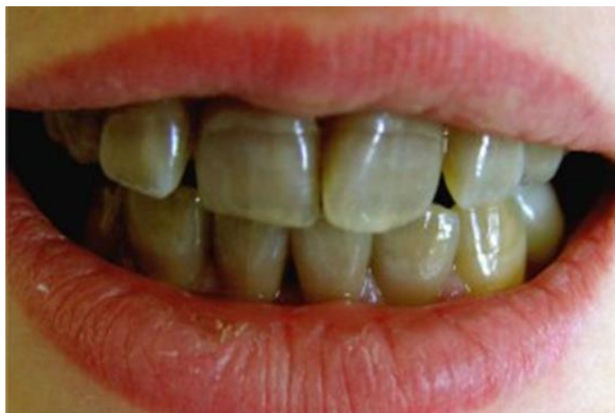
Slika 6. Tetraciklinsko obojenje. Preuzeto iz: (17)

Diskoloracije se dijele u četiri stupnja, prema opsegu, stupnju i lokalizaciji. Prva dva stupnja su pogodna za izbjeljivanje a kod trećeg i četvrtog stupnja potpuni uspjeh nije uvijek zagarantiran i terapija može trajati do 6 mjeseci (7,8).