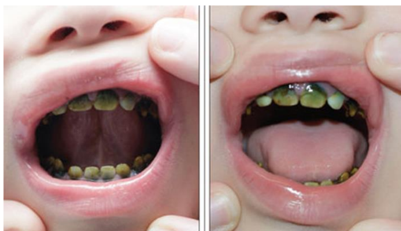
Slika 3. Urođena hiperbilirubinemija. Preuzeto iz: (13)

Urođena hiperbilirubinemija rezultira povišenom razinom seruma bilirubina koji se može nataložiti u zubnom tkivu za vrijeme rasta zuba i izazvati zeleno obojenje. Dijagnoza se postavlja na temelju medicinski utvrđene žutice kombinirane sa diskoloracijom zubi (Slika 3) (13).