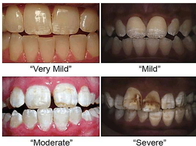
Slika 7. Četiri stupnja dentalne fluoroze. Preuzeto iz: (19)

na brzinu pri kojoj proteini matriksa cakline razgrađuju i/ili na brzinu kojom se nusproizvodi ove razgradnje povlače iz zrele cakline. Interferencija s uklanjanjem matriksa cakline može spriječiti rast kristala za vrijeme sazrijevanja i može dovesti do nepotpune mineralizacije. Smetnje u stvaranju cakline očituju se kao diskoloracije koje su posljedica poroznosti fluorozne cakline. Vidljive su u obliku bijelih ili smeđih površinski poroznih caklinskih mrlja na koje se mogu nakupljati kromogene tvari iz usne šupljine. Razlikuju se četiri stupnja dentalne fluoroze, ovisno o zahvaćenosti zubne površine (Slika 7). Klinička slika vrlo je slična kliničkoj slici hipomaturacijske amelogenesis imperfecta (7,8).