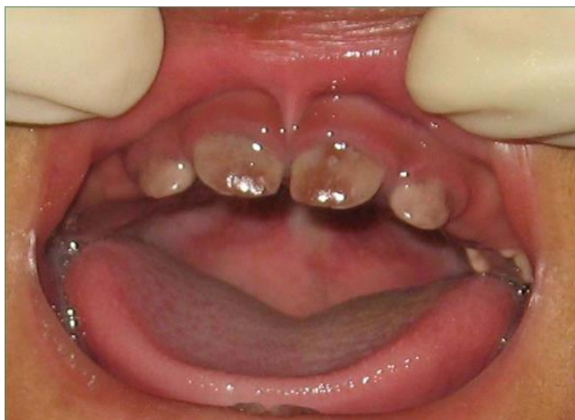
Slika 2. Urođena eritropoetska porfirija.

Urođena hiperbilirubinemija rezultira povišenom razinom seruma bilirubina koji se može nataložiti u zubnom tkivu za vrijeme rasta zuba i izazvati zeleno obojenje. Dijagnoza se postavlja na temelju medicinski utvrđene žutice kombinirane sa diskoloracijom zubi (Slika 3) (13).