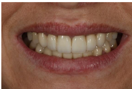
Slika 9. Protetsko rješenje endodontski uzorokovane diskoloracije zubi 12,11,21 potpuno keramičkim kunicama. Poslije protetskog tretmana.

Keramičke krunice cementiraju se adhezivnom tehnikom, koristeći kompozitni cement odgovarajuće boje.