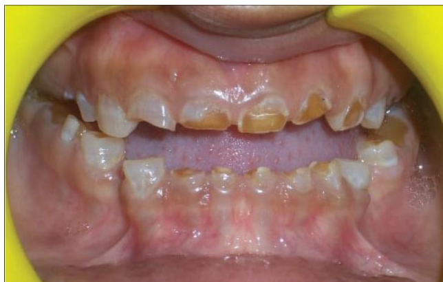
Slika 5. Dentinogenesis imperfecta. Preuzeto: (16).

Tetraciklinsko obojenje javlja se na mliječnim i trajnim zubima za vrijeme odontogeneze zbog primjene antibiotika, kod trudnica u drugom i trećem tromjesečju i djece do 8. godine. Diskoloracija može nastati ako je ukupna doza iznad 3 grama ili ako uporaba antibiotika traje duže od 10 dana. Stvaranje obojenja objašnjava se sposobnošću tetraciklina da čini spojeve s ionima kalcija, tzv. kelatione. Tetraciklin kelira s ionima kalcija iz hidroksiapatita dentina, da bi stvorio stabilnu tetraciklin-kalcij-ortofosfatnu vezu. Ovi spojevi se deponiraju u kostima i zubima, posebno dentinu. Promjene su trajne jer se caklina i dentin ne mogu metabolički pregraditi. Obojenja variraju, ovisno o vrsti antibiotika, dozi, trajanju terapije i fazi odontogeneze, od žute ili sive do smeđe sa ili bez pruga. Klorotetraciklin uzrokuje sivo-smeđe obojenje dok tetraciklin, demitilklortetraciklin i oksitetraciklin uzrokuju žuto obojenje. Zahvaćeni zubi najčešće požute nakon erupcije i izlaganja svjetlu, a fluorescentno žute mrlje se s vremenom mijenjaju u nefluorescentne smeđe. Zubi koji su više izloženi svjetlu posebice će potamniti zbog raspadanja tetraciklina uslijed izlaganja svjetlu (Slika 6) (7,8).