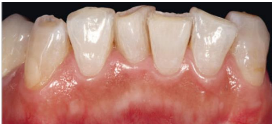
Slika 1. Zubi na donjim prednjim zubima prije preparacije za keramičke ljuste.

Zbog jednostavnije izrade, danas su zastupljenije ljuste od staklokeramike (Slike 1. i 2.). Mogu biti izrađene u laboratoriju toplo-tlačnim postupkom ili CAD/CAM tehnologijom. Izrada CAD/CAM tehnologijom je brža te omogućuje jednoposjetnu terapiju. Ipak, ljuste izrađene toplo-tlačnom tehnikom imaju bolja mehanička svojstva. Također, postoji mogućnost dodatnog nanošenja slojeva keramike što pridonosi boljoj estetici.