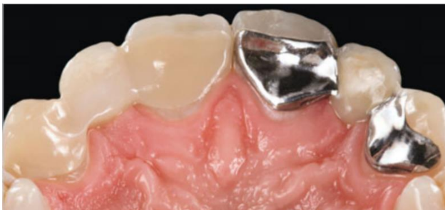
Slika 6. Primjer adhezivnog mosta s dva retentivna krilca. Preuzeto s dopuštenjem izdavača:

Najbolju funkcijsku trajnost imaju privjesni adhezivni mostovi koji se sastoje od jednog privjesnog člana i krilca koje se nalazi na lingvalnoj plohi samo jednog zuba nosača. Kod mostova s dva nosača, zbog nejednolikih pomaka prilikom prijenosa sila, postoji mogućnost odcementiranja jednog od retencijskih krilaca (Slika 6.). Tada se povećava rizik pojave sekundarnog karijesa, osobito u slučaju kada pacijenti to ne primijete odmah ili predugo čekaju s odlaskom stomatologu. Kod jednokrlnih privjesnih mostova, ukoliko dođe do odcementiranja, most ispada iz usta te se pacijent obično odmah javlja svom stomatologu. Preparacija za most s jednim nosačem puno je jednostavnija, manje invazivna i zahtijeva manje vremena (28).