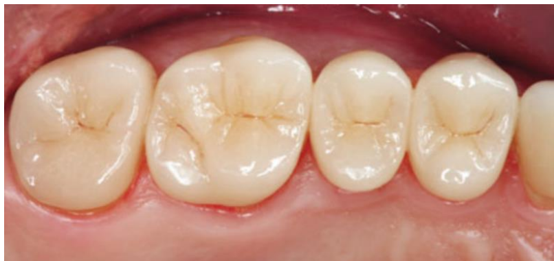
Slika 4. Keramički (IPS e.max Press) onleji nakon cementiranja. Preuzeto s dopuštenjem izdavača: (12)

Kompozitni inleji, onleji i overleji mogu se izraditi u ordinaciji ( chairside ) ili u dentalnom laboratoriju. Uglavnom se izrađuju indirektnom tehnikom na radnom modelu. Kompozit se nanosi u slojevima na radni model te polimerizira. Nakon završene modelacije, dodatno se polimerizira sa svih strana te je time polimerizacijsko skupljanje svedeno na minimum. To je prednost kompozitnih intrakoronarnih nadomjestaka u odnosu na klasične ispune. Naime, polimerizacijsko skupljanje dovodi do marginalnih defekata i pukotina (18). Negativna strana kompozitnih intrakoronarnih nadomjestaka jest što je preparacija za njih uglavnom opsežnija