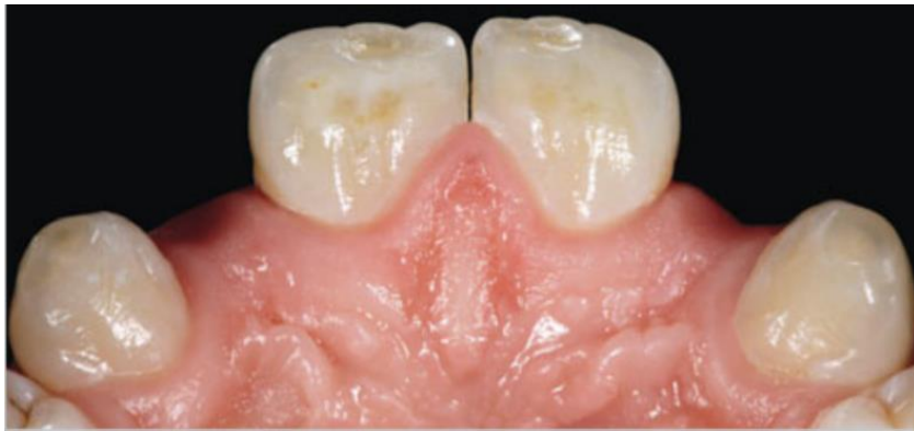
Slika 5. Hipodoncija lateralnih sjekutića.

Adhezivni mostovi indicirani su kod pacijenta kod kojih ugradnja implantata u svrhu nadomještanja jednog zuba nije moguća ili postoji velika mogućnost neuspješne oseointegracije. To su najčešće pacijenti koji imaju nezavršeni skeletni rast, neadekvatan prostor za postavu implantata, zdravstveno stanje koje bi kompromitiralo cijeljenje nakon kirurškog zahvata te pušači. Vrlo česte indikacije za izradu adhezivnog mosta su kongenitalni nedostatak zuba ili gubitak zuba uslijed traume kod mladih ljudi, kojima je zbog dobi kontraindicirana izrada klasičnog mosta ili ugradnja implantata (Slika 5.). Također, nekim su pacijentima adhezivni mostovi privremeno rješenje zbog cijene ugradnje implantata (25).