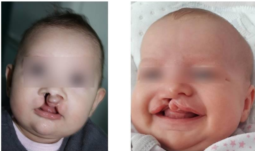
Slika 3. Obostrani (lijevo) i jednostrani rascjep (desno).

mišićni kontinuitet između lateralnih segmenata - funkcijska kirurgija rascjepa usne. Tijekom nekoliko posljednjih desetljeća, kako je već navedeno, posebna se važnost usmjeruje oblikovanju nosa i radikalnijim operacijama nosa zajedno s plastikom usne. Smatra se da ni u ovom obliku rascjepa ništa ne nedostaje, odnosno da je kolumela kratka, ali zapravo skrivena u nosu. Postoji nekoliko tehnika, više ili manje radikalnih, u oslobađanju nosnih hrskavica i oblikovanja vrška nosa (1).