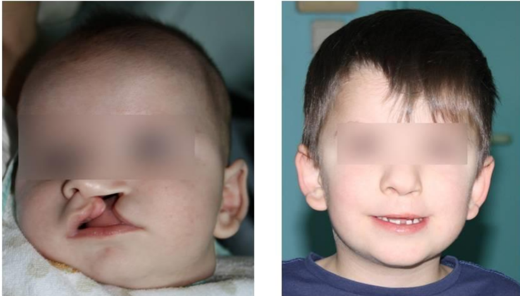
Slika 1. Prikaz rezultata kirurškog liječenja jednostranog rascjepa. Lijevo: početno stanje. Desno: stanje nakon učinjene plastike.