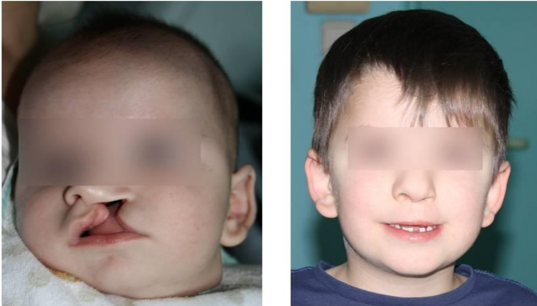
Slika 1. Prikaz rezultata kirurškog liječenja jednostranog rascjepa. Lijevo: početno stanje. Desno: stanje nakon učinjene plastike.