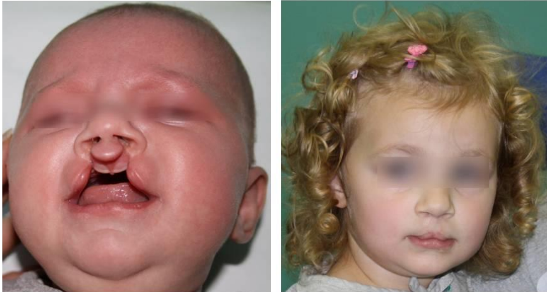
Slika 2. Prikaz rezultata kirurškog liječenja obostranog rascjepa. Lijevo: početno stanje. Desno: stanje nakon učinjene plastike.