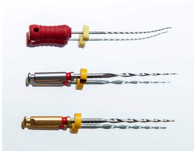
Slika 1. Usporedbe čeličnog (strugač #25) i NiTi (F360, F6 SkyTaper) instrumenta nakon savijanja

Legure NiTi koje se koriste u liječenju korijenskih kanala sadrže oko 56% nikla i 44% titana te se ovisno o temperaturi pojavljuju u dvije kristalne strukture nazvane austenit (kubični oblik kristalne rešetke) i martenzit (heksagonalni oblik kristalne rešetke). Pri nižim temperaturama legura je u martenzitnoj fazi i ima izražena plastična svojstva, dok povišenjem temperature prelazi u međufazu (R-faza) i nakon toga prelazi u austenitnu fazu koja ima izražena svojstva superelastičnosti i vraćanja u prvobitni oblik (eng. shape memory ) (Slika 1).