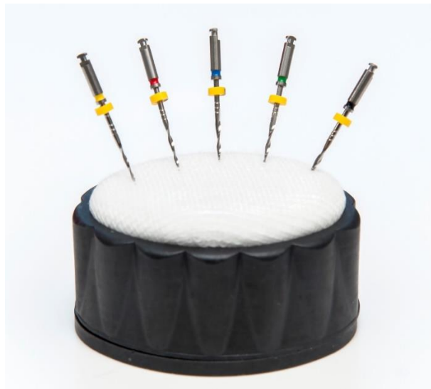
Slika 4. F6 SkyTaper instrumenti (#20, #25, #30, #35, #40)

Sustav F6 SkyTaper također koristi samo jedan instrument za potpunu obradu korijenskog kanala koji je dostupan u tri različite dužine (21, 25 i 31 mm) i konstantnog je koniciteta od .06. Instrumenti su dostupni u pet različitih veličina koje odgovaraju ISO standardu: #20 (žuta), #25 (crvena), #30 (plava), #35 (zelena) i #40 (crna). Veličine od #20 do #30 koriste okretni moment od 2,2 Ncm, dok veličine od #35 do #40 koriste moment od 2,8 Nm. Brzina rotacije za sve veličine instrumenata iznosi 300 o/min. Instrumenti su građeni od konvencionalne NiTi legure s presjekom u obliku dvostrukog slova S, istog kao kod instrumenata iz sustava F360. Instrumenti su dostupni u sterilnom pakiranju i primjenjuju se jednokratno. Sustav F6 SkyTaper obrađuje kanale kontinuiranom rotacijskom kretnjom. F6 je fleksibilan sustav sa sveobuhvatnim rasponom iglica koje odgovaraju gotovo svim anatomijama korijenskih kanala (Slika 4) (39).