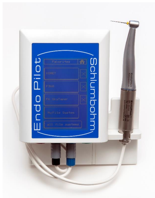
Slika 3. EndoPilot uređaj (Komet Dental, Lemgo, Njemačka)

Od pojave prvog rotacijskog sustava do danas razvile su se brojne tehnike, instrumenti i sustavi koji su omogućili lakšu, precizniju i bržu obradu endodontskog prostora. Na tržištu je dostupan EndoPilot (Komet Dental, Lemgo, Njemačka) uređaj koji omogućuje primjenu dvaju različitih rotacijskih sustava: F360 i F6 SkyTaper (Slika 3). Karakterizira ih jednostavan slijed instrumentacije, fleksibilnost instrumenata, smanjen rizik pucanja i identičan moment sile za sve instrumente.