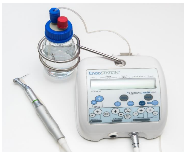
Slika 2. SAF sustav (Self Adjusting File, ReDent Nova, Ra'nana, Izrael)