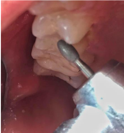
Slika 9. Poliranje ispuna finim dijamantom