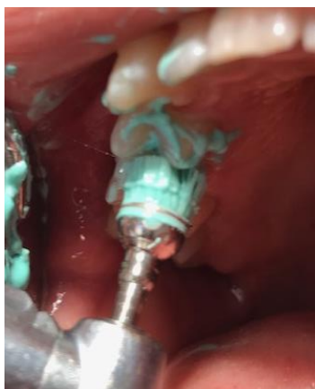
Slika 11. Poliranje četkicom i polirnom pastom