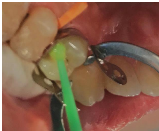
Slika 5. Nanošenje adheziva