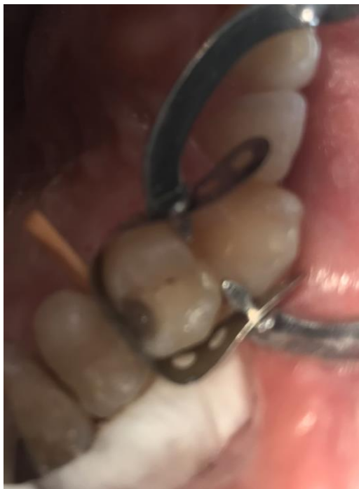
Slika 7. Polimerizirani tekući kompozit