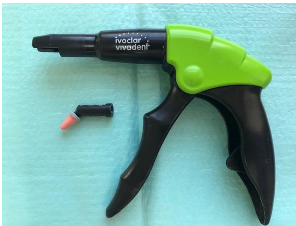
Slika 8. Kavifil Injector i Tetric EvoCeram Bulk Fill IV A kapsula