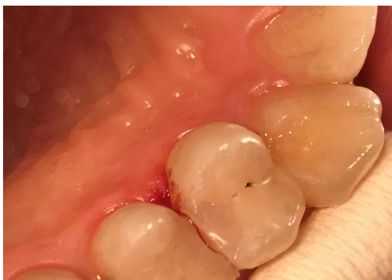
Slika 12. Završni izgled ispuna