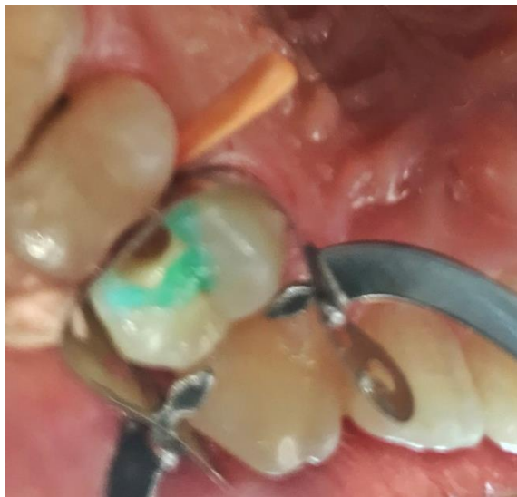
Slika 3. Selektivno jetkanje