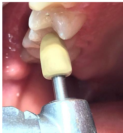
Slika 10. Poliranje gumicom