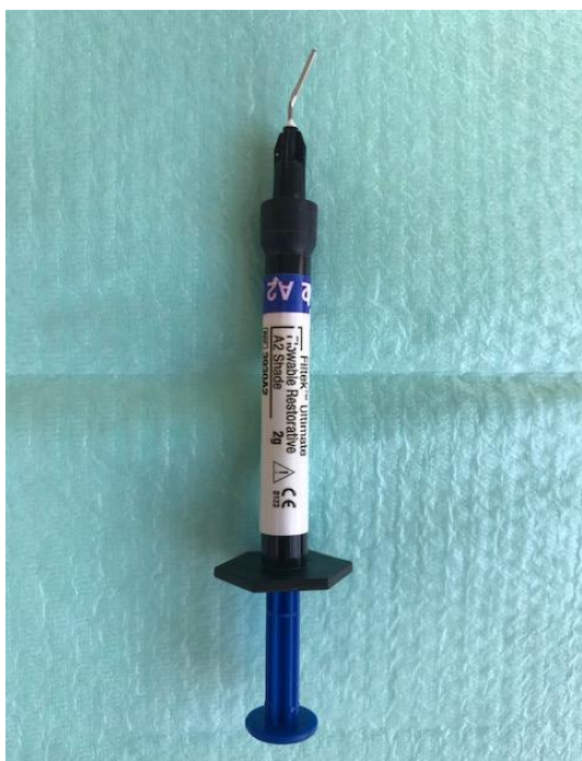
Slika 6. Tekući kompozit