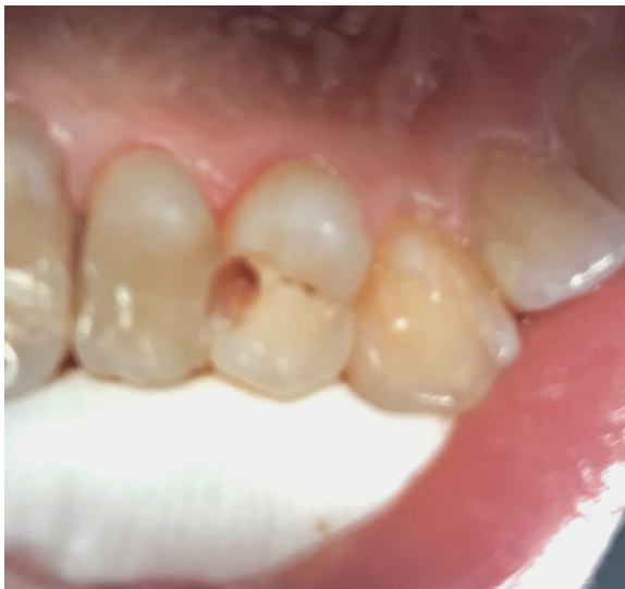
Slika 2. Preparirani kavitet