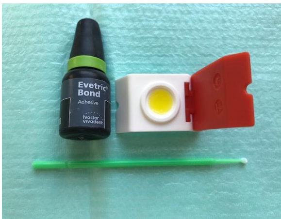
Slika 4. Samojetkajući adheziv