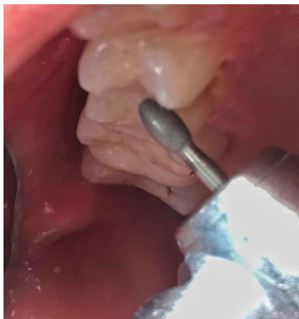
Slika 9. Poliranje ispuna finim dijamantom