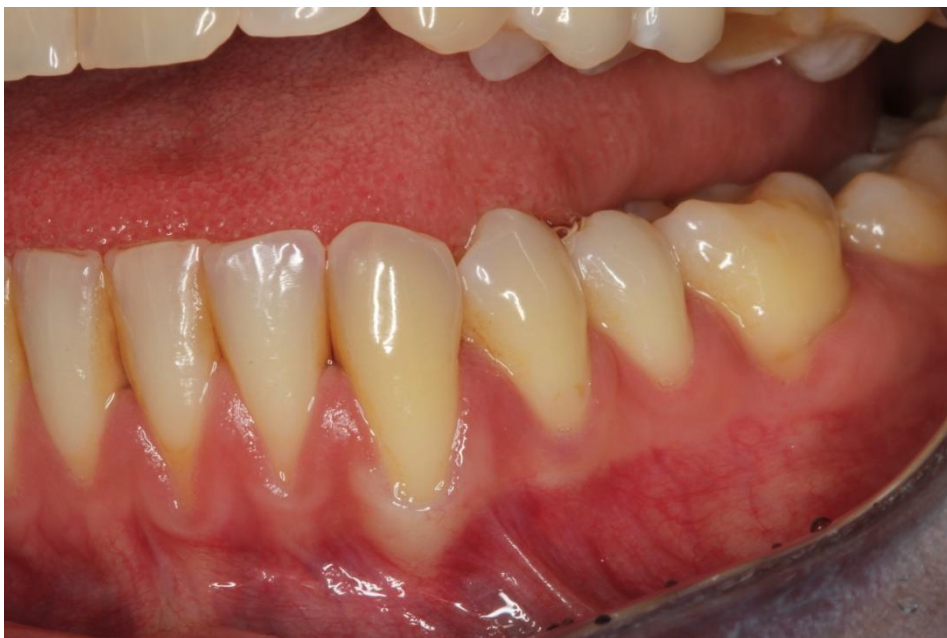
Slika 2. Izgled gingive prije operacije.