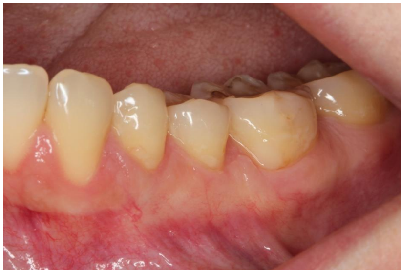
Slika 5. Izgled gingive 6 mjeseci nakon operacije.