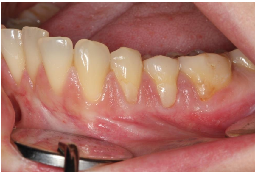
Slika 4. Izgled gingive prije operacije.