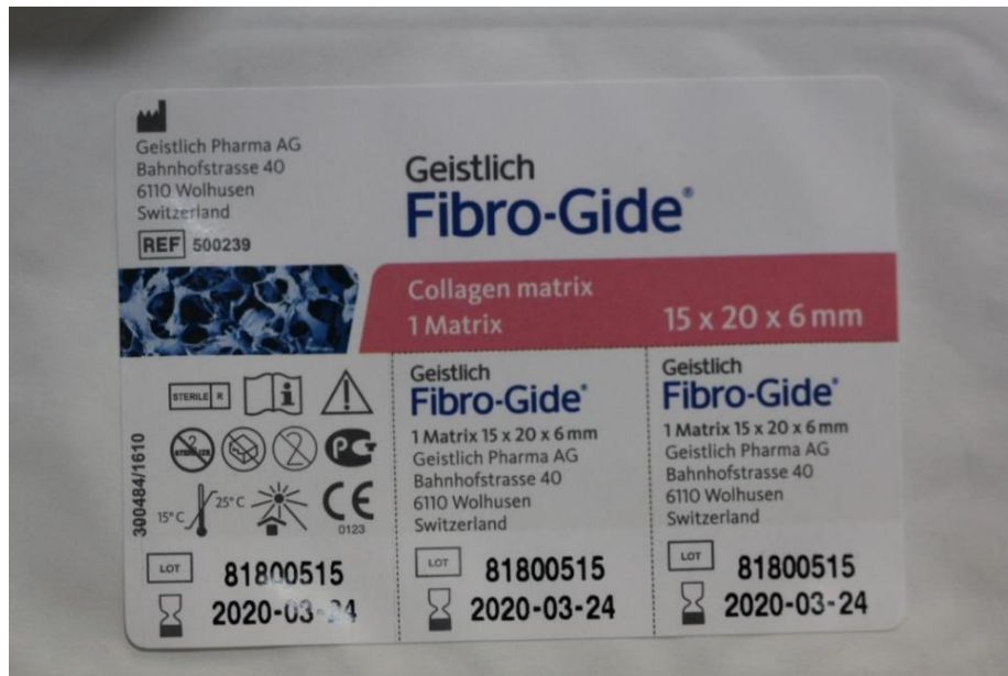
Slika 1. Fibro-Gide® kolageni matriks.