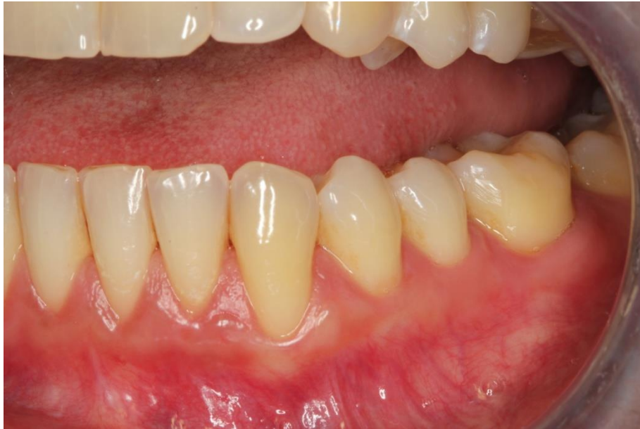
Slika 3. Izgled gingive 6 mjeseci nakon operacije.