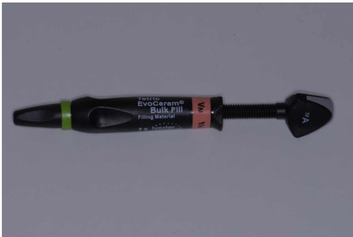
Slika 2. Tetric Evoceram®Bulkfill (Ivoclar Vivadent, Schaan, Liechtenstein).

se preporučuje obasjavanje LED svjetlom minimalne jačine od 550 mW/cm 2 . Za njegov niski postotak kontrakcije zaslužni su prije svega prepolimerizirane čestice stakla te tzv. shrinkage stress reliever (hrv. smanjivač stresa tijekom skupljanja), koji značajno smanjuje polimerizacijski stres i kontrakciju te ima vrlo nizak modul elastičnosti (10 GPa) (6, 43).