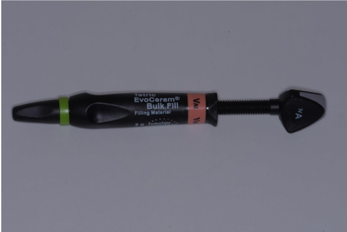
Slika 2. Tetric Evoceram®Bulkfill (Ivoclar Vivadent, Schaan, Liechtenstein).

se preporučuje obasjavanje LED svjetlom minimalne jačine od 550 mW/cm 2 . Za njegov niski postotak kontrakcije zaslužni su prije svega prepolimerizirane čestice stakla te tzv. shrinkage stress reliever (hrv. smanjivač stresa tijekom skupljanja), koji značajno smanjuje polimerizacijski stres i kontrakciju te ima vrlo nizak modul elastičnosti (10 GPa) (6, 43).