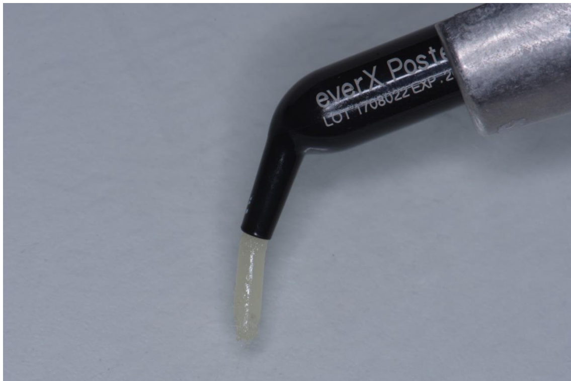
Slika 1. everX Posterior (GC, Tokyo, Japan).