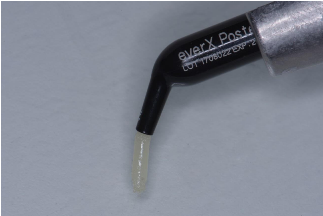
Slika 1. everX Posterior (GC, Tokyo, Japan).