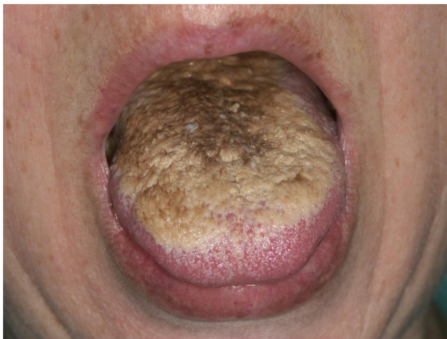
Slika 4. Crni obloženi jezik.

ambulanti moguće napraviti mehaničko uklanjanje naslaga s površine jezika uz pomoć prethodne primjene lokalnih keratolitika sa salicilnom kiselinom. Ako je obloženost jezika manja, pacijent ju može liječiti i sam, struganjem dorzuma jezika nekoliko puta tjedno, posebnom četkicom ili strugačem za jezik.