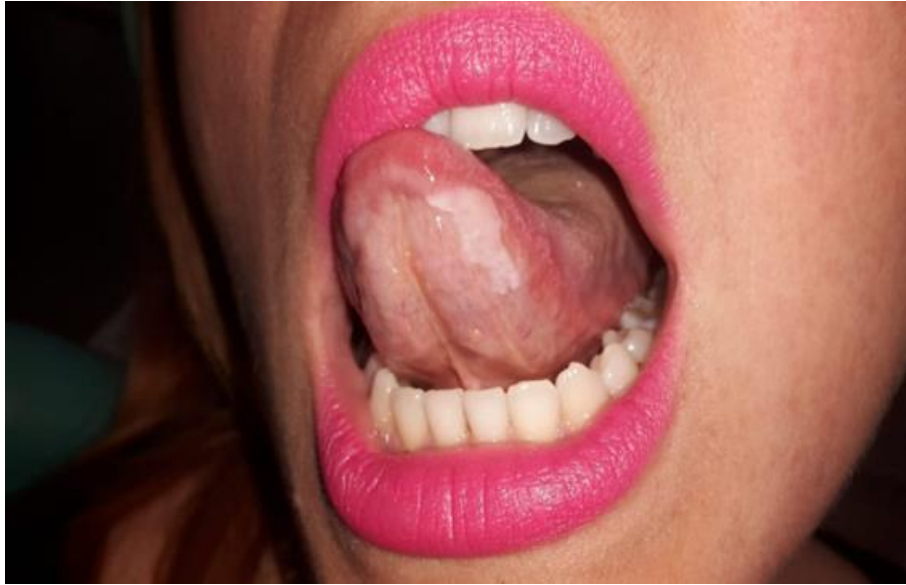
Slika 9. Leukoplakija.