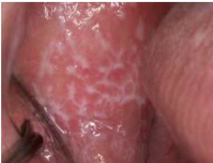
Slika 8. Oralni lihen planus.

lokalne kortikosteroide (0,05-postotni fluocinolon ili 0,05-postotni klobetazol). Kortikosteroidi imaju imunosupresivno i protuupalno djelovanje (26). Suportivno se uz topikalne kortikosteroide mogu primjenjivati antimikotici i antiseptici. U slučajevima većih erozija, kortikosteroide je moguće ordinirati i perilezijski ili sustavno (21, 22).