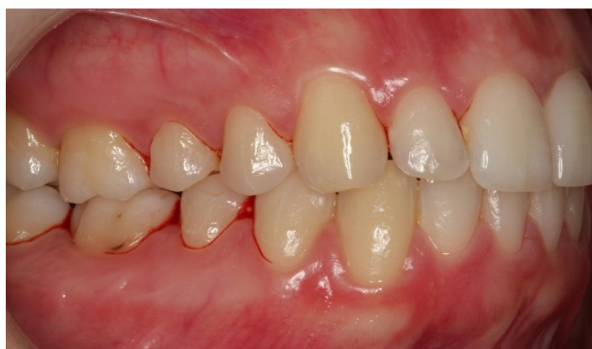
Slika 3. Klinička slika pacijentice s gingivitisom.

Gingivitis je stanje upalno promijenjene gingive koje se klinički očituje njezinim edemom, crvenilom, promijenjenom konzistencijom, spontanom krvarenjem u slučajevima izraženije kliničke upale ili izazvanim krvarenjem pri pažljivom sondiranju te kao takvo predstavlja najblaži i najjednostavniji oblik parodontne bolesti (Slika 3).