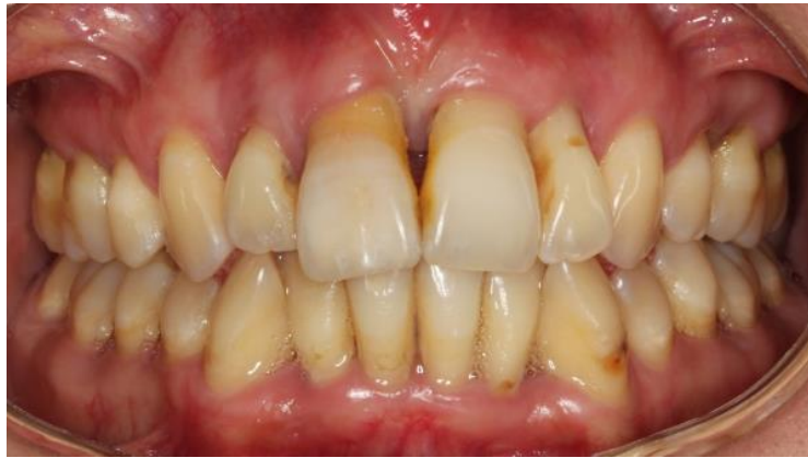
Slika 4. Klinička slika pacijenta s dijagnozom generaliziranog parodontitisa stadija III, razreda C.

Terapija parodontitisa dugotrajna je i zahtjevna te ne rezultira stanjem restitutio ad integrum . Terapija se može podijeliti u nekoliko koraka, pri čemu je inicijalna parodontološka terapija zlatni standard u liječenju ove bolesti. Gingivne i subgingivne naslage uklanjaju se nekirurškom terapijom struganja i poliranja korijena uz opcionalno antibiotsko liječenje u izrazito progresivnim i teškim generaliziranim oblicima bolesti. Kao potpora inicijalnoj terapiji mogu uslijediti kirurške metode čišćenja i poliranja korijena. Parodontitis se kao takav ne može izliječiti, ali se pravodobnom dijagnozom i usmjerenim liječenjem može zaustaviti daljnja progresija bolesti. Parodontno zdravlje važno je očuvati radi očuvanja oralnog zdravlja generalno, ali i radi očuvanja općega zdravstvenog statusa jer brojna istraživanja sa sve više dokaza ukazuju kako parodontni džepovi predstavljaju rezervoare bakterija koji se mogu smatrati potencijalnim žarištima infekcije.