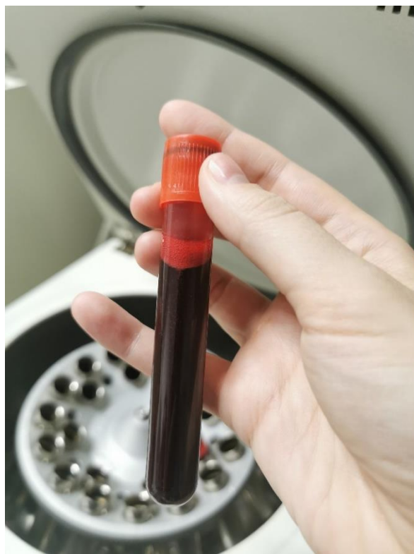
Slika 4. Izgled pune krvi prije centrifugiranja