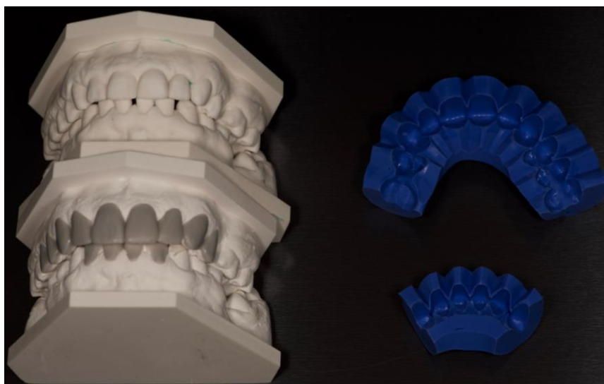
Slika 3. Wax-up na modelu gornje čeljusti te izrađeni slikonski ključ.

Dijagnostički wax-up izrađuje tehničar na sadrenom modelu. Koristi se za odabir preparacije te eventualne preprotetske terapije (27). Uz to, služi i za izradu silikonskog ključa (Slika 3).