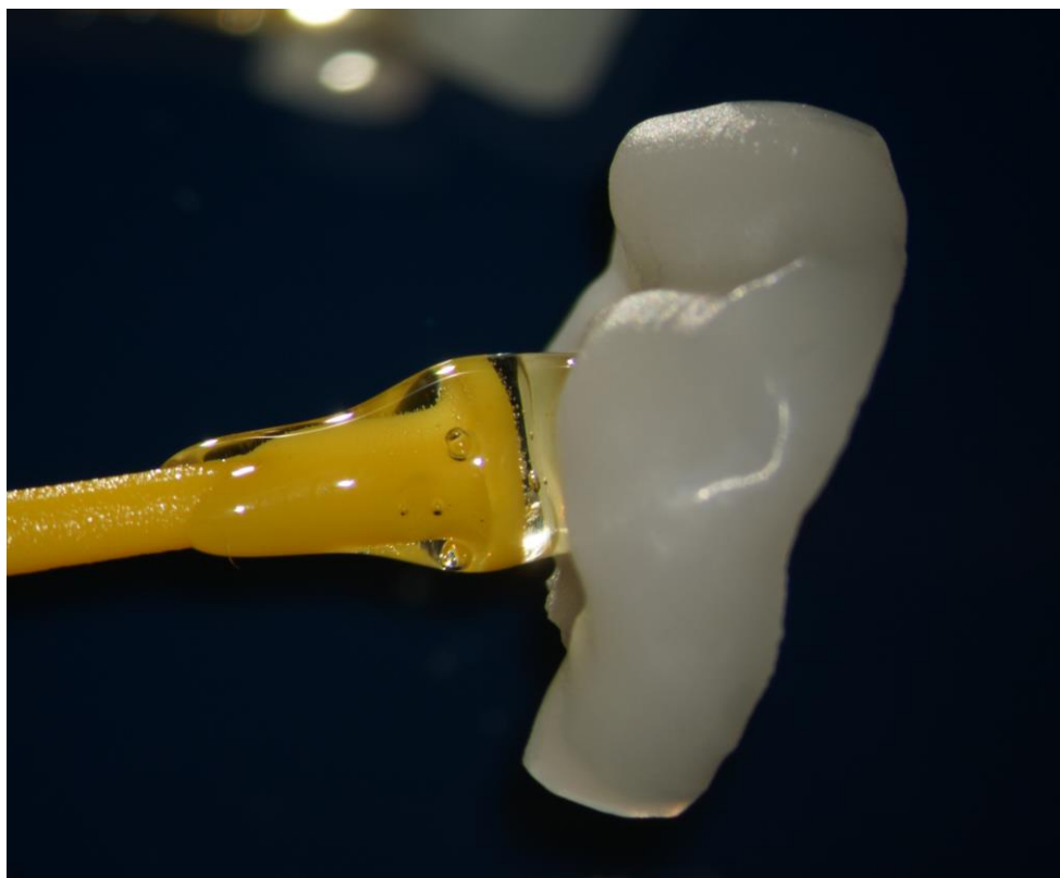
Slika 1. Okluzalna ljoska izrađena od litij-disilikatne keramike, spremna za cementiranje.

U određenim slučajevima, kao prijelazno rješenje mogu poslužiti okluzalne ljoske izrađene od kompozitnih materijala.