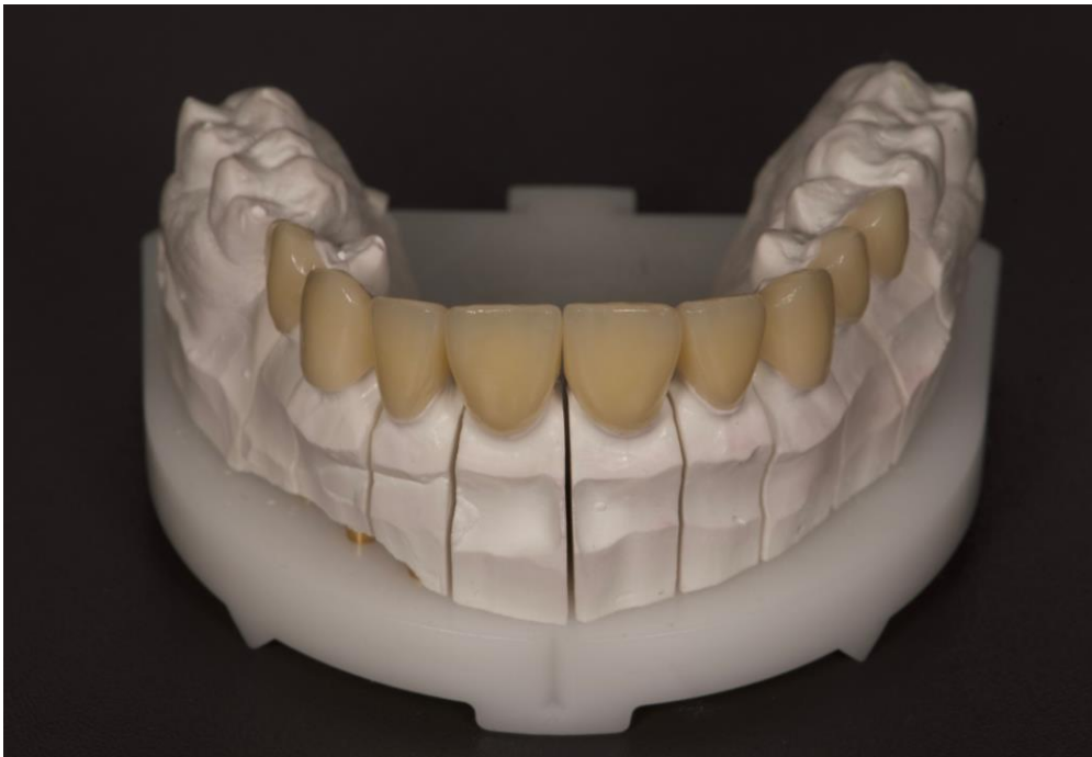
Slika 5. Luskice na radnom modelu. Preuzeto s dopuštenjem autora doc. dr. sc. Andreje Carek.

preciznosti i dosjeda marginalnih rubova, interproksimalnih kontakata, oblika, boje te cjelokupnog estetskog dojma (58). Dosjed se luskica prvo provjerava pojedinačno, a zatim i svih luskica zajedno da bi se provjerili svi aproksimalni kontakti, konture, kao i estetska funkcionalnost. Ovisno o potrebi, provjerava se i okluzija.