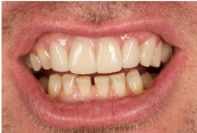
Slika 4. Mock-up na gornjim sjekutićima.

Mock-up se izrađuje izravno u ordinaciji pri čemu se zubi preoblikuju do željenog rezultata, najčešće kompozitnim materijalom poput bis-akril kompozita za privremene restauracije (Slika 4) (28, 29). Na taj način i stomatolog i pacijent mogu vidjeti kako će izgledati završni rezultat. Budući da se radi o kliničkoj fazi, u nju je uključen i sam pacijent koji svojim prijedlozima može utjecati na to da ishod terapije bude bliže njegovim očekivanjima.