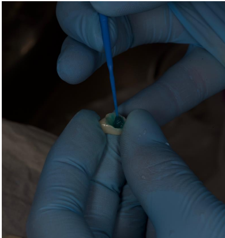
Slika 7. Istovremeno nanošenje jetkajuće otopine i primera na veznu površinu ljuskice.