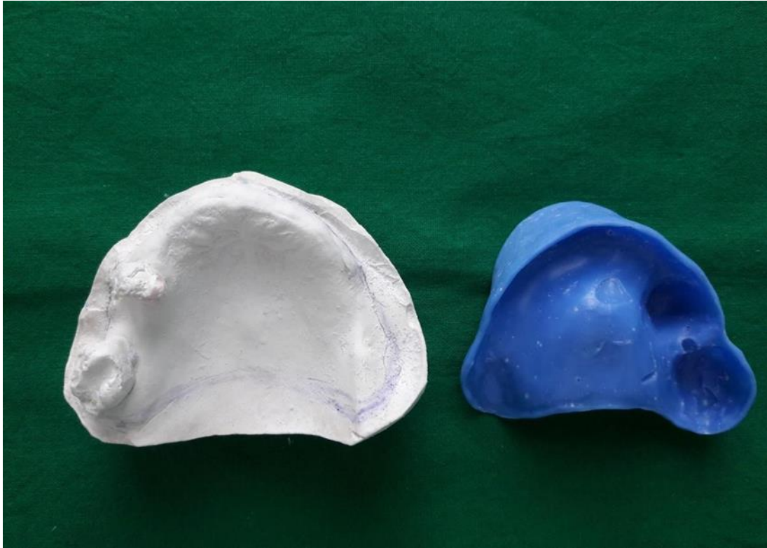
Slika 8. Anatomski model i individualna žlica.

Nakon izrade, uslijedio je postupak probe individualne žlice te pronalaženje i uvježbavanje načina unošenja žlica u usta (naročito gornje individualne žlice). Gornja individualna žlica je frezom dodatno reducirana, naročito u području ručke i dijelova koji su obuhvaćali postojeće zube u ustima pacijentice. Potom je uspješno unesena u usta. Također je ispitan i pasivan dosjed žlice na ležište kako bi bila spremna za izradu funkcijskog otiska u postupku izrade gornje djelomične proteze. Funkcijskim otiskom precizno je otisnuto ležište baze proteze, prikazan oblik ležišta, a time određena i veličina buduće proteze, registrirana rezilijencija sluznice i oblikovan funkcijski rub proteze (16-25). Rubovi funkcijskog otiska gornje i donje čeljusti napravljeni su pomoću termoplastičnog materijala (Kerr Impression compound material, Kerr, Bioggio, Švicarska), a završno je otisak napravljen kondenzacijskim silikonom rijetke konzistencije (Xantopren L, Heraeus Kulzer, Hanau, Njemačka) (Slika 9.). Tijekom izrade funkcijskog otiska gornje čeljusti, funkcijski rubovi za buduću protezu oblikovali su se kombiniranim izvođenjem aktivnih kretnji pacijentice (sisanje prsta, smijanje, izgovaranje glasa “a”) te kontroliranih pasivnih kretnji (masiranje obraza i usana) od strane terapeuta.