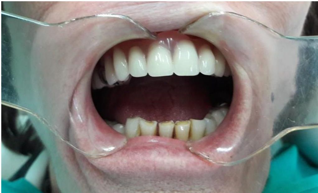
Slika 18. Predaja djelomičnih proteza.