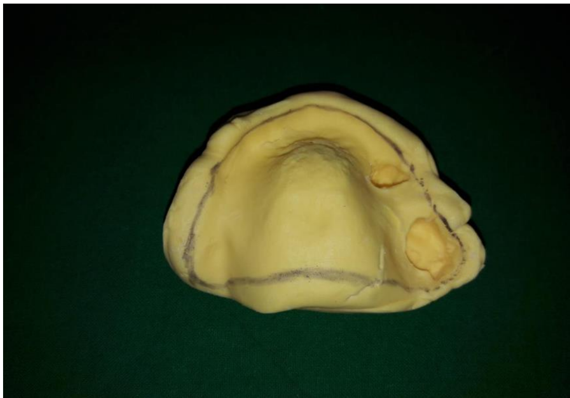
Slika 6. Anatomski otisak od kondenzacijskog silikona s ucrtanim rubom za izradu individualne žlice.

Nakon završene izrade fiksnog protetskog rada slijedi izrada djelomičnih proteza s metalnom bazom u gornjoj i donjoj čeljusti. Zbog izrazito reduciranog usnog otvora konfekcijsku žlicu za gornju čeljust nije bilo moguće unijeti u usta te uobičajenim postupkom uzeti gornji anatomski otisak. Stoga je napravljen anatomski otisak gornje čeljusti pomalo modificiranom metodom koju su opisali Whitsitt i Battle (46). Zamiješan je kondenzacijski silikon kitaste konzistencije (Optosil; Heraeus Kulzer, Hanau, Njemačka ) te je zamiješani otisni materijal prstima liječnika oblikovan poput „knedle“, bez žlice unesen u usta pacijentice i ravnomjerno raspoređen preko gornje čeljusti – ležišta buduće proteze tako da prekrije tvrda i meka tkiva potrebna za oblikovanje i izradu individualne žlice. Nakon stvrdnjavanja otisnog materijala, takav je otisak izvađen iz usta pacijentice te su olovkom ucrtani rubovi, nešto kraći od granice pomično-nepomične sluznice kako bi se u dentalnom laboratoriju na izlivenom modelu napravila individualna žlica (Slika 6.).