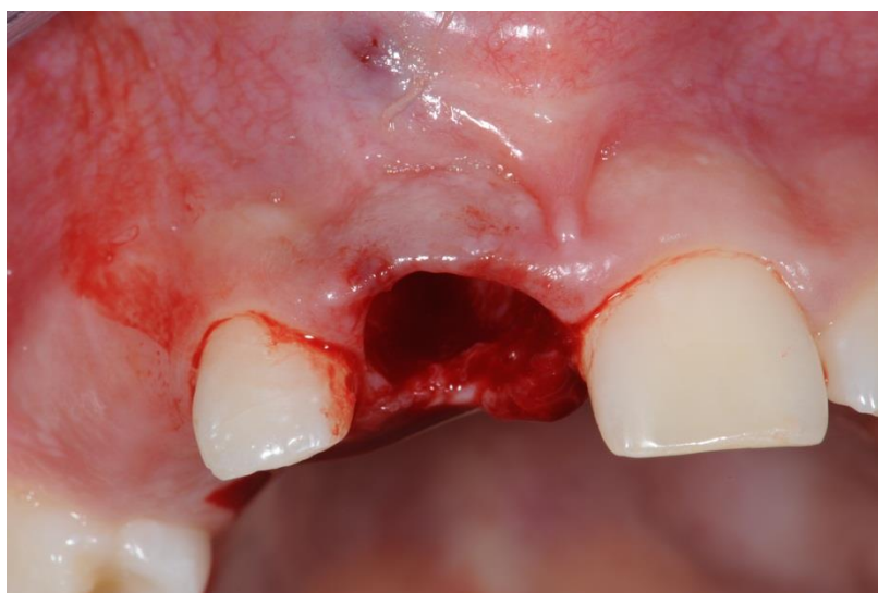
Slika 2. Postekstrakcija alveola na mjestu implantacije.

Prvo se ekstrahira zub na mjestu implantacije i naprave korekcije postojeće alveole tako da donorski zub može stati u istu, poput uklanjanja eventualnog interradikularnog septuma i upalnog granulacijskog tkiva (Slika 2). Ako nema upalnog sadržaja, treba izbjegavati kohleiranje kako bi se zadržale postojeće parodontne stanice u alveoli. Alveola mora biti 1 do 2 milimetra veća i dublja od donorskog zuba da bi se sačuvao parodontni ligament (2).