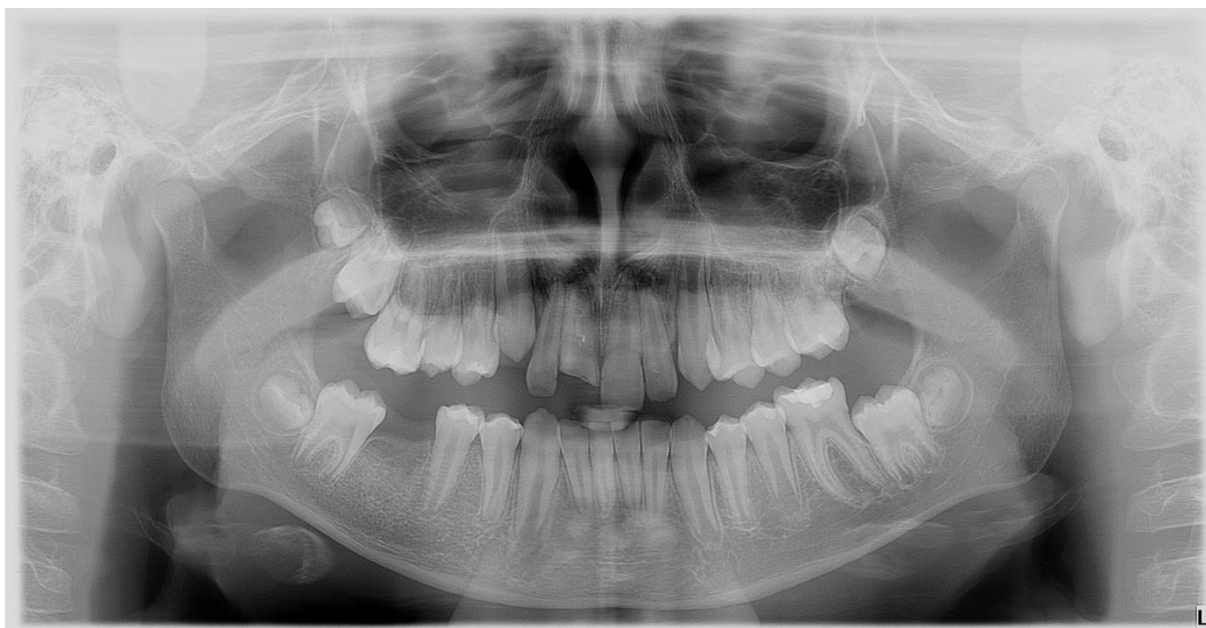
Slika 1. Ortopantomogram pacijenta s traumom zuba 11. Izabrani zub donor je zub 35 sa nezavršenim razvojem korijena.

Velik broj istraživanja potvrdio je da je stadij razvoja zuba vrlo važan čimbenik uspjeha i preživljavanja transplantata. Mogu se transplantirati zubni zametci i zreli zubi (zubi sa završenim rastom i razvojem korijena). Nezreli zubi su bolji izbor za transplantaciju jer ostaju vitalni te se razvoj i rast korijena nastavlja nakon transplantacije (2). Najbolji rezultati postignuti su sa zubima čiji su korijenovi dosegli \frac{1}{2} do \frac{3}{4} ukupne duljine (1).