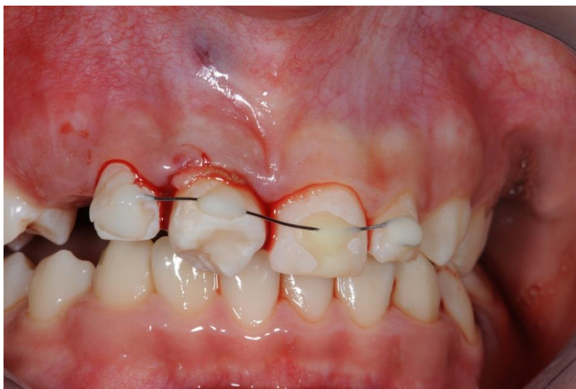
Slika 4. Učvršćivanje zuba donora žičano-kompozitnim splintom.