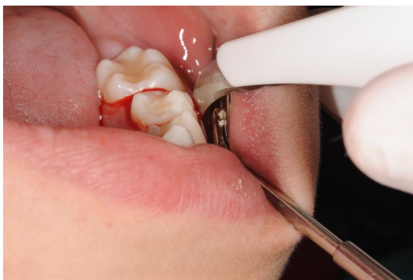
Slika 3. Priprema za ekstrakciju zuba donora.

Slijedi ekstrakcija zuba donora (Slika 3). Postupak započinje odizanjem mukoperiostalnog režnja uz nježno rukovanje mekim tkivima i uz očuvanje integriteta periostalne membrane, za bolju regeneraciju pri cijeljenju. Pri vađenju zuba donora koriste se kontrolirane luksacije za što manju traumu zuba. Ukoliko je nužna, učini se osteotomija. Cilj je maksimalno očuvati intaktni parodontni ligament pri ekstrakciji jer oštećenje Hertwigove ovojnice transplantata limitira ili inhibira daljnji rast i razvoj korijena, ovisno o veličini traume (1).