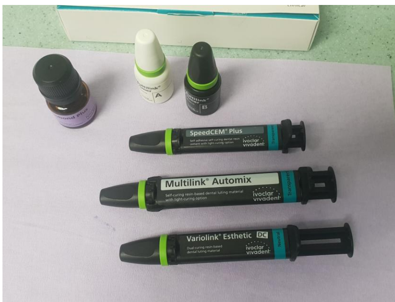
Slika 6. Kompozitni trajni cementi

kod potpunokeramičkih radova potrebno je pripremiti keramiku fluorovodičnom kiselinom i silanom. Danas se te dvije komponente mogu naći u jednom proizvodu što skraćuje i olakšava pripremu (73).