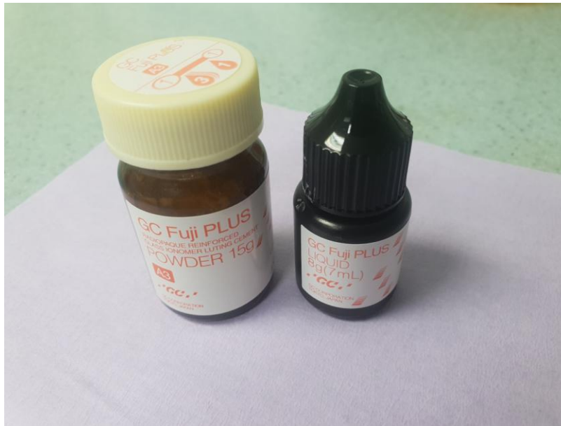
Slika 5. Staklenoionomerni trajni cement ( GC Fuji PLUS )

Pojavom bezmetalnih protetskih konstrukcija i visoko postavljenim estetskim standardima, u modernoj stomatologiji sve se više koriste kompozitni cementi. Njihova je prednost u odnosu na druge trajne cemente adhezija na tvrda zubna tkiva i nadomjestak, netopljivost u vlažnom mediju, krase ih izuzetna mehanička i estetska svojstva, boja i translucencija. Čine tzv. monoblok: zub (nadogradnja) – kompozitni cement – nadomjestak. Zbog izuzetnih mehaničkih svojstava, kompozitnim cementima cementirani nadomjestci podnose veće vrijednosti žvačne sile. Prema načinu polimerizacije, kompozitni cementi mogu biti kemijski i svjetlosno polimerizirajući, ovisno o kemijskom sastavu. Sve češće dolaze u dualnom obliku gdje su oba načina polimerizacije moguća. Sastoje se od umjetne smole, odnosno od metaakrilata i nekih drugih metaakrilatnih monomera, anorganskih punila, katalizatora, stabilizatora i pigmenata. U sastavu mogu biti i samojetkajuće komponente kao i aktivatori za kemijsko ili svjetlosno stvrdnjavanje ili oboje (82, 83).