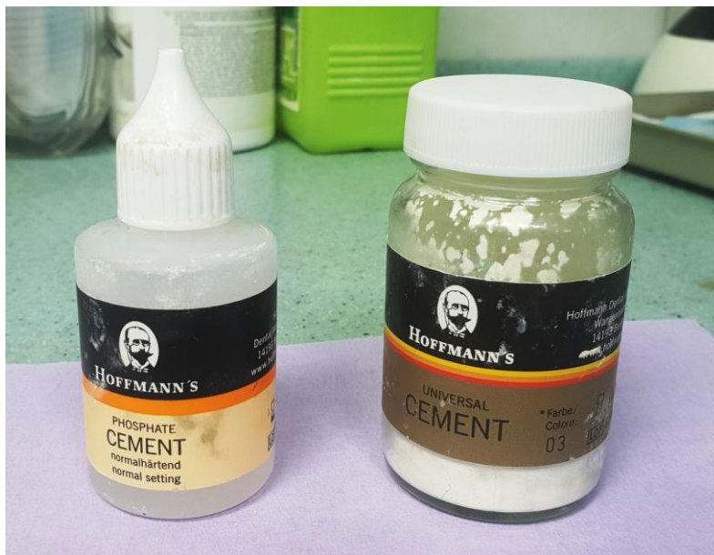
Slika 4. Cink-oksifosfatni trajni cement

mane koje pokazuje prilikom cementiranja na zube nosače, naročito vitalne, prilikom cementiranja u implantoprotetici jesu i prednosti. Topljiv je, što znači da se lako uklanja iz sulkusa oko implantata, a njegova kiselost koja može dovesti do devitalizacije zuba, u implantoprotetici nije važna (73,74).