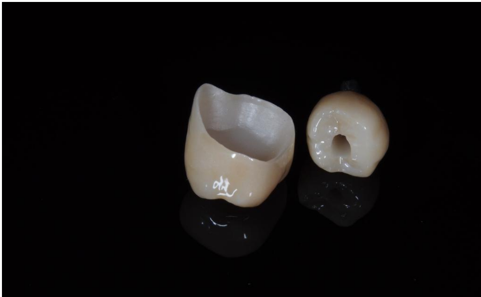
Slika 7. Krunica na cementiranje i krunica na vijak.

(86). Najčešće se koristi okluzijski vijak. Njegov pristupni otvor nalazi se na okluzalnoj plohi protetskog rada što omogućava brz i jednostavan pristup vijku te lakše postavljanje i uklanjanje protetskog nadomjestka, čak i kada postoji ograničen vertikalni prostor. Okluzijski vijak s nagnutim otvorom omogućuje pristup vijku tako da su i vijak i ključ prilikom pričvršćenja usmjereni pod određenim kutem. Naravno da se javljaju određeni problemi vezani za takav način pričvršćenja. Neki od mogućih problema jesu: izrada nadomjestaka isključivo CAD/CAM tehnologijom, potreba za novim odvijačem što povlači za sobom i posebno dizajniran vijak te veći pristupni otvor vijku (87).