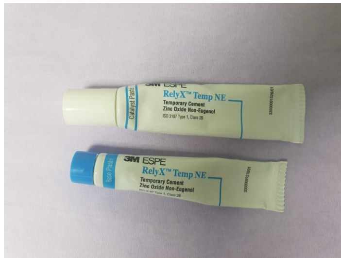
Slika 2. Privremeni cement na bazi cinkova oksida bez eugenola ( RelyXTemp NE , 3M ESPE)

Mogu se koristiti i kompozitni privremeni cementi koji se uglavnom rabe za cementiranje visokoestetskih radova u predjelu fronte gornje čeljusti zbog njihove translucencije. Prema kemijskom sastavu kompozitni privremeni cementi jesu: 56% dimetaakrilati, 43% punila, a ostatak čine pigmenti, stabilizatori i katalizatori. Jednostavni su za rukovanje i čišćenje. Najnovija skupina privremenih cemenata jesu adicijski silikoni s cinkovim oksidom. Po sastavu su polidimetilsiloksan i cinkov oksid. Dolaze u automix obliku i sastoje se od dviju pasta. Odlikuju se jednostavnom aplikacijom i čišćenjem (73, 77).