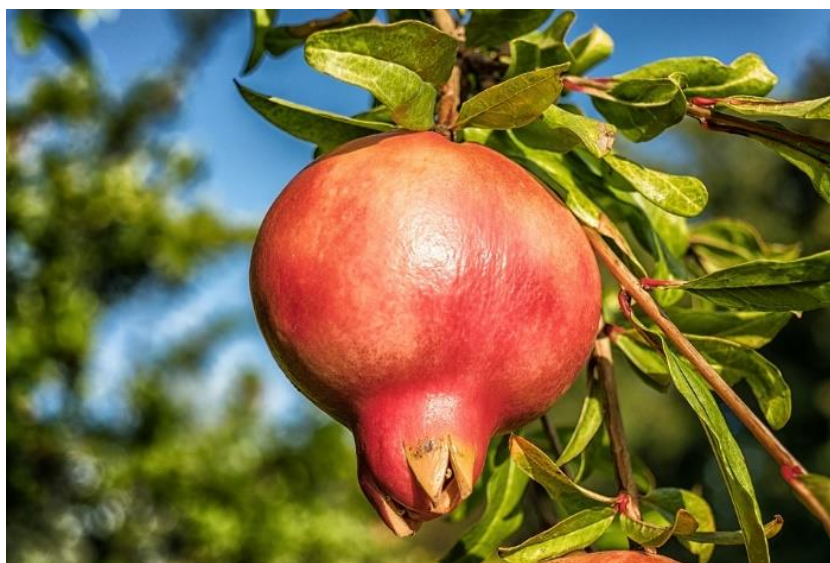
Slika 8. Punica granatum .

Tanini pripadaju skupini polifenola (metaboliti biljaka) te zbog njihove antibakterijske aktivnosti raste interes za njihovom upotrebom u tretiranju parodontne bolesti. To duguju precipitaciji mikrobnih proteina, čime sprječavaju razvoj mikroorganizama, dok je drugi mehanizam djelovanja povećanje antioksidativne sposobnosti oralnih tekućina. Polifenoli i tanini glavne su supstance drva perzijskog hrasta ( Quercus brantii ), koje se tradicionalno koristilo u Iranu za tretiranje površinskih ozljeda i lokalnih upala zbog svog, uz sve navedeno, i hemostatskog, protuupalnog te antinociceptivnog djelovanja. Koriandar Coriandrum sativum još je jedna biljka koja se tradicionalno koristila u Iranu i sadrži tanine. Budući da njihovo djelovanje kod parodontne bolesti još nije istraženo, u sljedećoj studiji istražen je učinak biljnog gela koji sadrži kombinaciju ekstrakata spomenutih biljaka, apliciranog subgingivno u parodontne džepove, nakon SRP-a, kod pacijenata s umjerenim kroničnim parodontitisom. Korištena je tehnika split-mouth , a pokazalo se da nema statistički značajne razlike između eksperimentalne i kontrolne strane te da biljni gel s SRP-om nije imao bolji učinak od samog SRP-a (51).