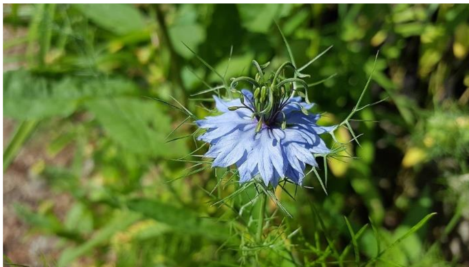
Slika 15. Crni kim ( Nigella arvensis ).

Sljedeća je važna medicinska biljka crni kim ( Nigella arvensis ) (Slika 15.). Pripisuju joj se antimikrobna, protuupalna, antioksidativna i protutumorska svojstva te stimulacija imunskog sustava. Fitokemijska analiza njezinih sjemenki otkriva sastav bogat hlapljivim uljima i ostalim bioaktivnim komponentama, uključujući nigelin, karvon, melantin, timokinon i brojne druge. Razni ekstrakti crnog kima (etanol, benzin) pokazuju značajni antiproliferativni učinak na tumorske stanice HeLa linije u odnosu na kontrolne skupine (109).