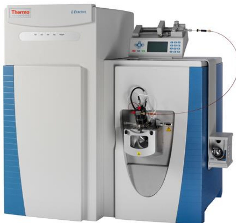
Slika 1. Spektrometar mase.