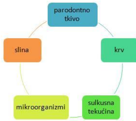
Slika 3. Biološki uzorci dostupni za proteomska istraživanja parodontnih bolesti