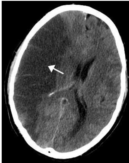
Slika 2. CT snimak ishemijskog moždanog udara. Preuzeto s dopuštenjem izdavača (41).

Prema mehanizmu nastanka razlikujemo: trombotički, embolijski i hemodinamički ishemijski moždani udar (7). U trombotičkom moždanom udaru, tromb se uglavnom formira oko aterosklerotičnog plaka. Dva tipa tromboze mogu uzrokovati moždani udar: bolest velikih krvnih žila i bolest malih krvnih žila. Bolest velikih krvnih žila zahvaća zajedničku i unutarnju karotidnu arteriju, vertebralnu arteriju i Willisov krug (16).