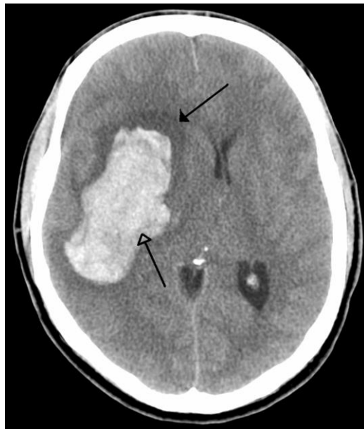
Slika 4. CT snimak hemoragijskog moždanog udara.

Subarahnoidalno krvarenje najčešće nastaje rupturom aneurizme. Aneurizma nastaje kada dio krvne žile postane povećan zbog kroničnog i opasno visokog krvnog tlaka ili zbog slabe stijenke krvne žile, što je obično kongenitalna malformacija. To povećanje dovodi do stanjenja zida krvnožilne stijenke i posljedične rupture. Najčešći su simptomi subarahnoidalnog krvarenja jaka glavobolja, ukočen vrat, slabost, mučnina i povraćanje, fotofobija, gubitak svijesti, otežan govor, zamagljen vid ili dvoslike (Slika 4) (36).