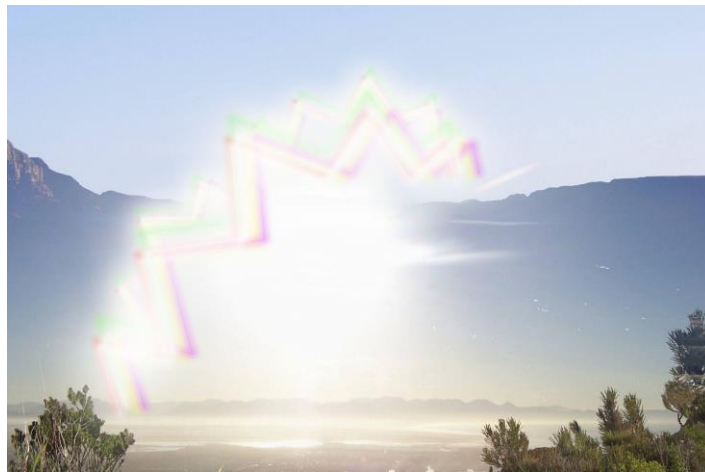
Slika 1. Prikaz migrenske aure. Preuzeto s dopuštenjem izdavača (20).

Mogu se javiti i nevizualni simptomi, primjerice, smetnje u percepciji ili pokretanju tijela - apraksija ili agnozija, smetnje govora, stanja svijesti povezane s deja vu ili jamais vu fenomenom, olfaktorne halucinacije itd. Parestezije, koje su drugi najčešći simptom aure (nakon vizualnih), obično su migrirajuće i traju nekoliko minuta. Počinju obično u dlanu, migriraju uz ruku prema ramenu i na kraju zahvaćaju područje lica, usta i jezika. Noga je ponekad zahvaćena. Motorni simptomi javljaju se u 18 % slučajeva i obično nastaju uz osjetne simptome, no prava je slabost rijetka i uvijek je unilateralna (19).