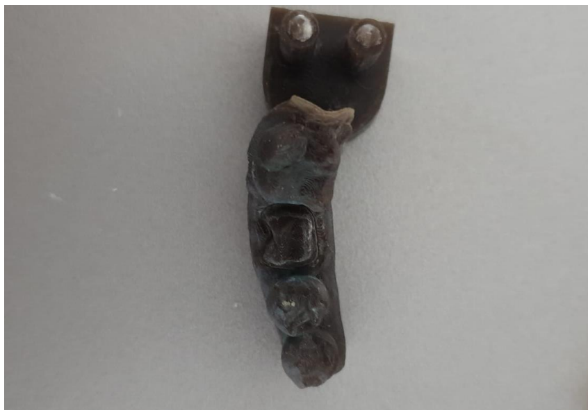
Slika 1. 3D printani djelomični model od polimera. Preuzeto s dopuštenjem autora: doc. dr. sc. Joško Viskiće