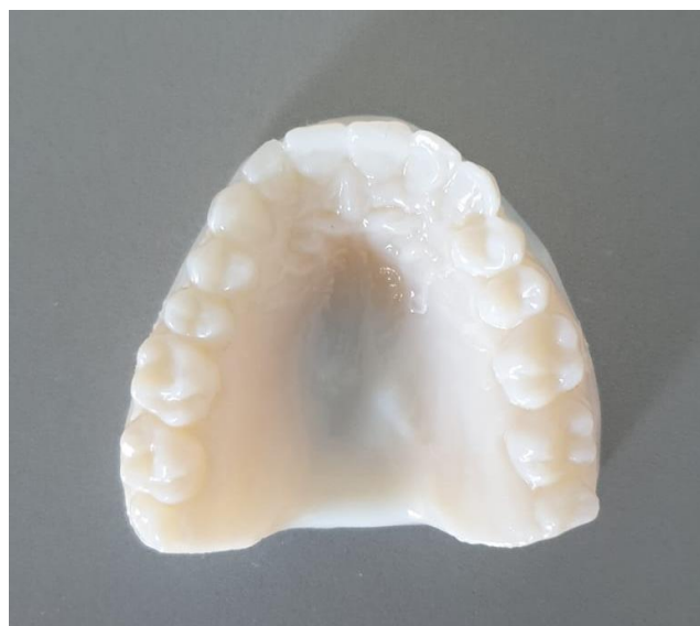
Slika 2. 3D printani anatomski model.