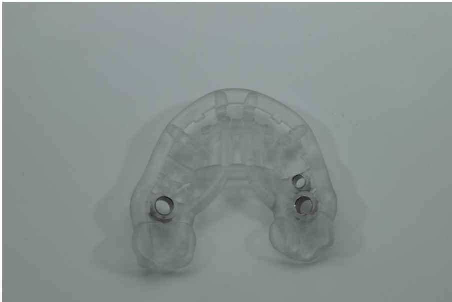
Slika 6. 3D printana implantatna žlica za otiskivanje.

tomography ) koji daje informacije o anatomiji te digitalizirani model situacije, gdje se vrši planiranje protetske opskrbe. Na virtualnom modelu određuje se smjer i dužina implantata. Ucertavaju se granice šablona i ugrađuju se vodilice ovisno o odabranom implantatnom sustavu (slike 6 i 7) (16). Kirurške šablone moraju biti robusne i precizne te moraju biti izrađene od materijala koji se može sterilizirati (26).