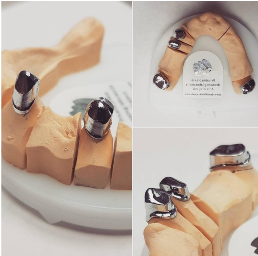
Slika 5. 3D printani unutarnji teleskopi od kobalt-kroma postupkom laserskog taljenja.

maksimalno 20 radova (18). Daljnje pitanje koje se nameće jest kakva je veza metala i keramike. U istraživanju koje su proveli Tara i suradnici na 39 pacijenata, sa sve skupa 64 modelirane metal-keramičke krunice u praćenom razdoblju od 47 mjeseci nije bilo lomljenja keramike, čime su zaključili da je metoda laserskog taljenja obećavajuća u izradi metal-keramičkih nadomjestaka (19).