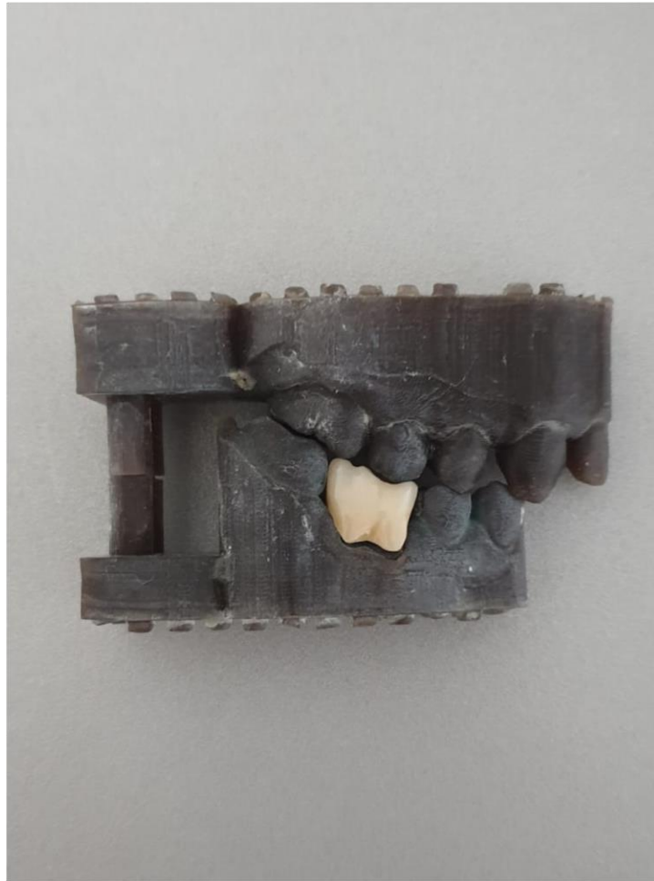
Slika 3. 3D printana privremena krunica od polimera na modelu.

Privremeni nadomjestci bitan su korak u izradi fiksnog nadomjestka jer, osim što održava funkciju, također štiti pulpu i parodont od vanjskih utjecaja. Izrađuju se od polimera, najčešće se radi o biopolimeru PLA te polimetil-metakrilat (PMMA) (slike 3 i 4) (17).