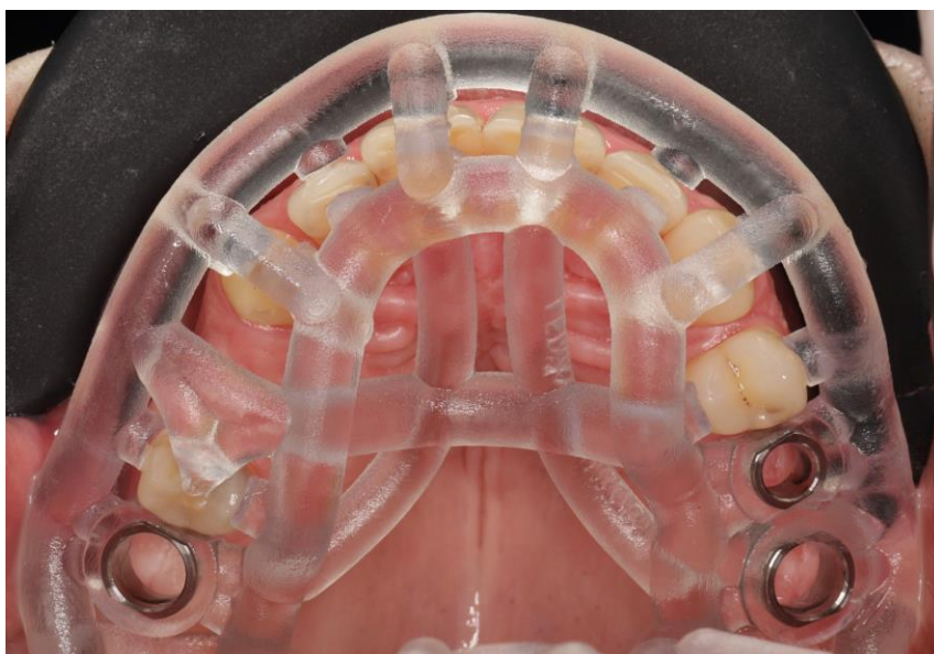
Slika 7. 3D printana implantatna žlica za otiskivanje u ustima pacijenta.