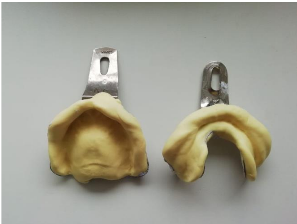
Slika 3. Prvi otisak

stanje. Glavni je sastojak alginata alginska kiselina koja se dobiva iz morskih biljaka. Alginat sadrži kalijeve, natrijeve i amonijeve soli alginske kiseline. Kada otopine tih soli dođu u dodir s kalcijevom soli, stvara se elastični gel. U prašku se nalazi topljiv alginat i dihidrat kalcijeva sulfata. Miješanjem praška s vodom nastaje kalcijev alginat. Svojstva zbog kojih se alginat primjenjuje za izvođenje prvog otiska mnogobrojna su. Precizno prikazuje detalje tkiva ležišta, registraciju nabora sluznice i aktivnosti okolnih mišića. Dovoljno je elastičan materijal da omogućuje lako vađenje iz usta preko potkopanih područja, a bez trajne deformacije. Zbog relativno niske viskoznosti omogućuje otisak bez dislokacije mekih i pomičnih tkiva, a detalji otisnute površine usta ne mijenjaju se u vlažnom mediju. Samo izlijevanje modela u gipsu lagan je postupak te je to materijal koji je relativno ekonomičan (1).