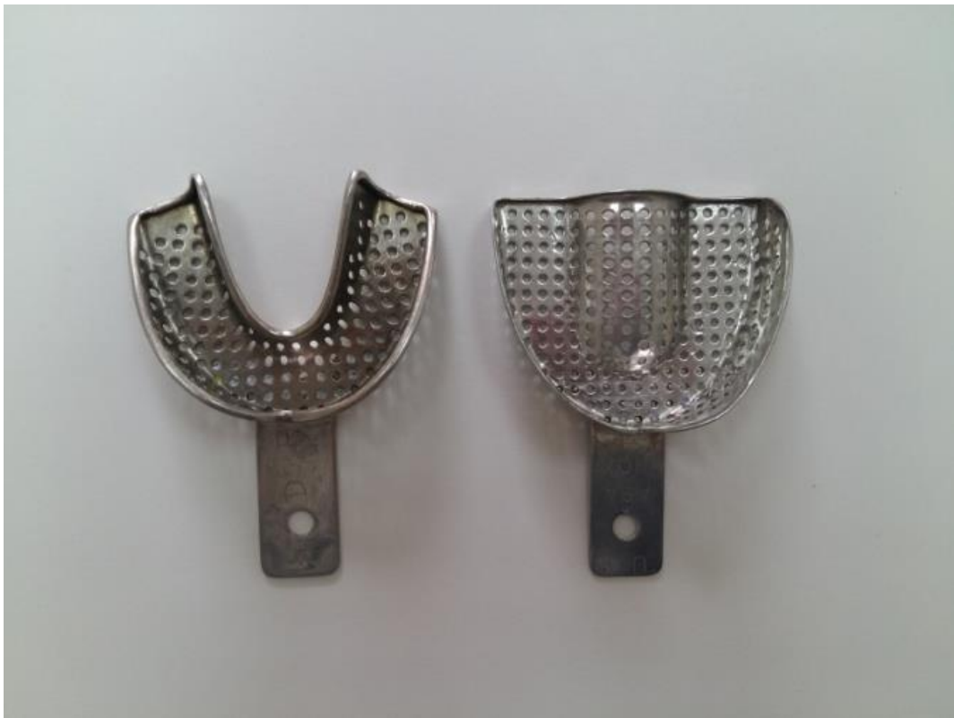
Slika 2. Konfekcijske žlice

Prvi otisak kod izrade imedijatne proteze najčešće se izvodi alginatom ili nekim od gumastih materijala u konfekcijskoj žlici (Slika 2.-3.). Svi oni spadaju pod elastične materijale kojima je zajednička osobina da poslije učvršćivanja ostaju elastični te da se lako i bez neugode vade iz pacijentovih usta.