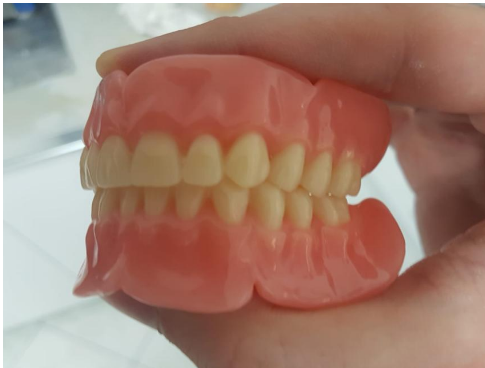
Slika 10. Obradene i polirane proteze

Imedijatnu protezu koja je obrađena i polirana stomatolog treba pažljivo pregledati i ukloniti sva moguća oštra mjesta frezom. Estetski izgled, visina okluzije i okluzijski odnosi ispituju se u pacijentovim ustima. No, prije stavljanja u usta proteza se pere sapunicom i na jedan sat uranja u rastvor dezinfekcijskog sredstva (Slika 10.).