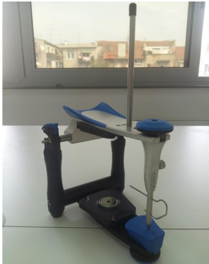
Slika 8. Artikulator

Artikulatori su mehaničke naprave koje služe za što točniju i individualniju reprodukciju kretnji mandibule i odnosa među čeljustima (Slika 8.). Prema tipu konstrukcije dijelimo ih na arcon i non-arcon artikulare. Kod arcon artikulatora gornji član oponaša zglobnu jamicu temporomandibularnog zgloba, a donji član kondil. Kod non-arcon artikulatora taj je položaj obrnut. Prema stupnju složenosti i svrsi upotrebe podijelili smo ih na jednostavne-neprilagodljive, poluprilagodljive i potpuno prilagodljive artikulare. Najširu upotrebu imaju poluprilagodljivi artikulatori (26).