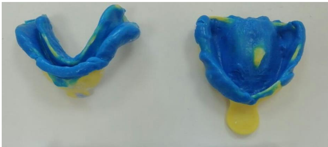
Slika 5. Funkcijski otisak

Funkcijski otisak najčešće se izvodi nekim gumastim materijalom ili pastom na bazi cink oksida (Slika 5.). Može se izvesti u jednoj fazi ili dvije faze. Jednofazna metoda izbjegava se zbog nedovoljne preciznosti (24). Kod dvofaznog otiska rubovi se mogu oblikovati termoplastičnim ili gumastim materijalom, a otisak ležišta provodi se gumastim materijalom ili pastom na bazi cink oksida. Oblikovanje rubova funkcijskog otiska kod imedijatne proteze nije uvijek jednostavno. Često su ti rubovi suviše prošireni, pogotovo u području gdje se nalaze zubi. Dakle, u prvoj se fazi oblikuju rubovi, a nakon toga se individualna žlica puni elastičnim materijalom i završava se otisak (1).