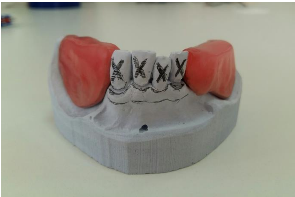
Slika 9. Povučena linija po marginalnoj gingivi

Ako preostali prirodni zubi imaju duboke džepove, u pacijentovim ustima ta se dubina ispita te se na modelu označi marginalna gingiva i radirana mjesta koja označavaju dubinu džepova (1). Svrdlom, pilicom za gips, montiranim kamenom ili čeličnom frezom režu se sadreni zubi do razine marginalne gingive. Odstranjuje se jedan po jedan zub i postavlja odgovarajući umjetni zub.