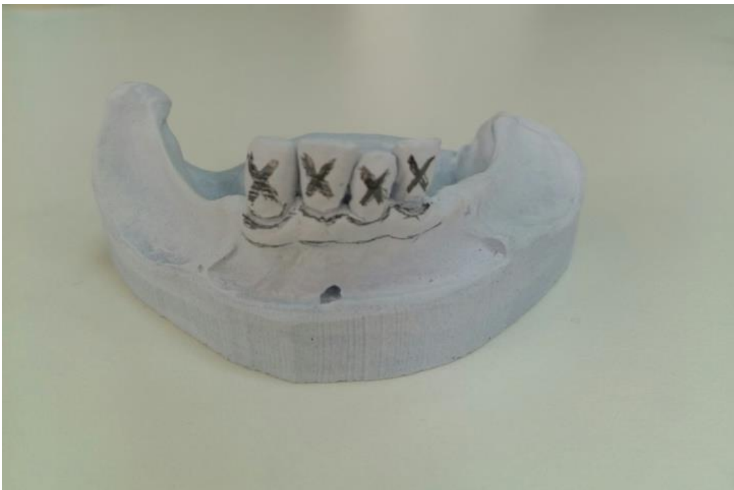
Slika 6. Radni model

Budući da je funkcijski otisak završen, odabire se konfekcijska žlica odgovarajuće veličine. Bitno je da prekriva individualnu žlicu koja se vraća u pacijentova usta. Konfekcijska se žlica puni alginatom, postavlja se preko individualne žlice i preostalih zuba. Nakon stvrdnjavanja alginata žlica se zajedno s funkcijskim otiskom vadi iz pacijentovih usta (1). U tako dobivenom otisku izlijeva se radni model u tvrdom gipsu te se na njemu provode daljnji postupci izrade proteze (Slika 6.).