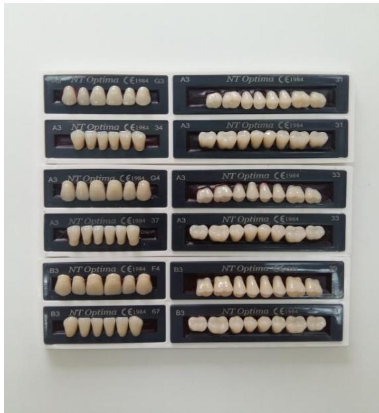
Slika 1. Različiti oblici, veličine i boje umjetnih zuba

Postavljanjem proteze u pacijentova usta neposredno nakon vađenja zuba sprječava se kolaps usnica i obraza. Stoga je estetska vrijednost imedijatne proteze velika. Važno je naglasiti i psihološku sigurnost koju ona pruža jer se izbjegava razdoblje bezubosti, što omogućuje nesmetanu poslovnu i društvenu aktivnost (7).